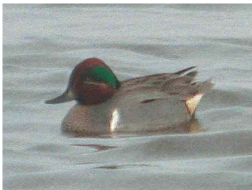
293 Roodstuitzwaluw / Red-rumped Swallow Hirundo daurica , Budel-Dorplein, Noord-Brabant, 18 april 2004 294 Alpengierzwaluw / Alpine Swift Apus melba , De Geul, Texel, Noord-Holland, 20 april 2004 295 Ringsnavelmeeuw / Ring-billed Gull Larus delawarensis , eerste-winter, Hoornse Plas, Groningen, Groningen, 8 maart 2004 296 Amerikaanse Wintertaling / Green-winged Teal Anas carolinensis , mannetje, Slufter, Texel, Noord-Holland, 17 april 2004

Zuid-Holland, op 11 april langs het Oostvoornse Meer, Zuid-Holland, en op 23 april langs de centrale op de Maasvlakte. Een Grote Burgemeester L. hyperboreus werd op 12 en 13 maart waargenomen bij Huizen, Noord-Holland. Lachsterns Gelochelidon nilotica werden gezien op 26 (twee), 27 en 28 april (vier) langs Breskens, op 26 en 27 april langs de Eemshaven, op 26 april bij de Ter Aase Zuwe bij Demmerik, Utrecht, en op 27 april over het Ketelmeer, Flevoland, en over Westerbroek, Groningen. Naar schatting 25 Reuzensterns Sterna caspia werden in april waargenomen met maxima van zes op 14 april in de Makkumerzuidwaard, Friesland, en zeven op 28 april langs Breskens. Een Witwangstern Chlidonias hybrida verbleef in de Sophiapolder bij Oostburg, Zeeland, op 29 en 30 april. Een andere vloog op 1 mei boven de Oostvaardersplassen. Een Witvleugelstern C. leucopterus in zomerkleed werd op 30 april aangetroffen bij De Steile Bank, Friesland. Op 30 maart werd een Papegaaiduiker Fratercula arctica dood gevonden in De Slufter op Texel.