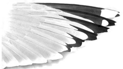
FIGURE 3 Newfoundland American Herring Gull / Amerikaanse Zilvermeeuw Larus smithsonianus , upperwing of adult (Peter Adriaens)

The red gonys spot is often distinctly small, obviously not reaching up to the lower cutting edge, and is rather pale (more orange than red). Therefore, the bill pattern resembles that of argentatus although the gonys spot may be even smaller. In winter, adult argenteus usually retains a more yellowish bill throughout (although the basal two thirds may be paler yellow than the tip), dark subterminal markings are more often absent, and the gonys spot is larger (reaching up to or almost up to the cutting edges) and brighter. Beware of subadult birds, however. From mid-February onwards, the bills of NF smithsonianus rapidly turn bright yellow as head streaking disappears. However, the dark subterminal marks often remain into May at least, which only exceptionally occurs in European Herring Gulls. The orange gonys spot may increase in size and brightness, although it remains relatively small in quite a few birds.