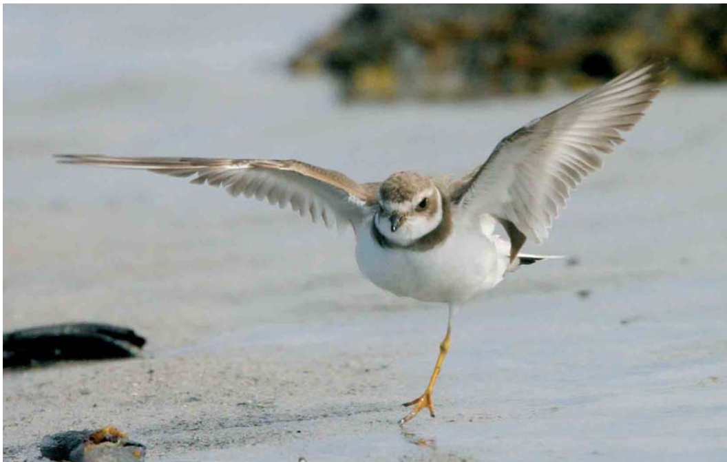
272 Semipalmated Plover / Amerikaanse Bontbekplevier Charadrius semipalmatus , Sandgerði, Iceland, 9 May 2004 (Daniel Bergmann)

JAEGERS TO TERNS Possibly the largest-ever flock of 22 Long-tailed Jaegers Stercorarius longicaudus for Israel was at North Beach, Eilat, on 31 March; moreover, three Pomarine Jaegers S pomarinus and 12 Parasitic Jaegers S parasiticus were counted that day. In Banc d'Arguin, Mauritania, the resident Cape Gull Larus dominicanus vetula was seen again with its Yellow-legged Gull L michahellis partner on Zira and at Iwik on 23-24 March. In the Pontic Gull L cachinnans colony between Krakow and Jankowice, Poland, an adult female Yellow-legged Gull wearing an Italian ring shared a nest with an adult female Pontic Gull incubating five eggs ( www.czaplou.most.org.pl ); probably, the former was ringed as a chick in the Po delta in 1997. If accepted, a subadult Thayer's Gull L thayeri at