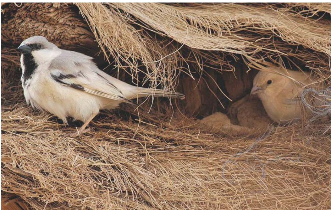
282 Desert Sparrows / Woestijnmussen Passer simplex , male (left) and female, Merzouga, Tafilalt, Morocco, 30 March 2004