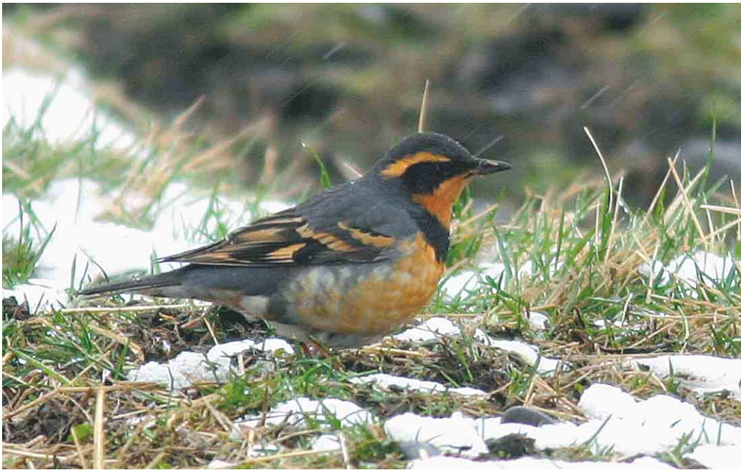
278-279 Varied Thrush / Bonte Lijster Ixoreus naevius , Unaós, Hjaltastaðapínghá, Iceland, 3 May 2004