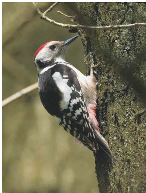
290 Kortsnavelboomkruiper / Central European Treecreeper Certhia familiaris macrodactyla , Vijlenerbos, Limburg, 27 maart 2004 ( Ran Schols ) 291 Middelste Bonte Specht / Middle Spotted Woodpecker Dendrocopos medius , Vijlenerbos, Limburg, 26 april 2004 ( Ran Schols ) 292 Beflijster / Ring Ouzel Turdus torquatus , mannetje, Terschelling, Friesland, 3 april 2004 ( Arie Ouwerkerk )