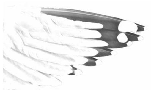
FIGURE 2b Newfoundland American Herring Gull / Amerikaanse Zilvermeeuw Larus smithsonianus , underwing of adult

BILL COLOUR In winter, this may be another element of limited help, as the bill is rather dull in adult NF smithsonianus , compared with adult argenteus . While the bill-tip is normally yellow, the basal two thirds are often clearly less brightly coloured, and may even be greenish, pinkish, or greyish without a yellowish hue. Many winter adults have dark subterminal bill markings, such as a greyish or blackish spot or bar above the gonys.