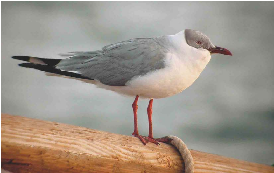
255 Grey-headed Gull / Grijskopmeeuw Larus cirrocephalus , Iwik-Zira, Banc d'Arguin, Mauritania, 23 March 2004 (Kris De Rouck)