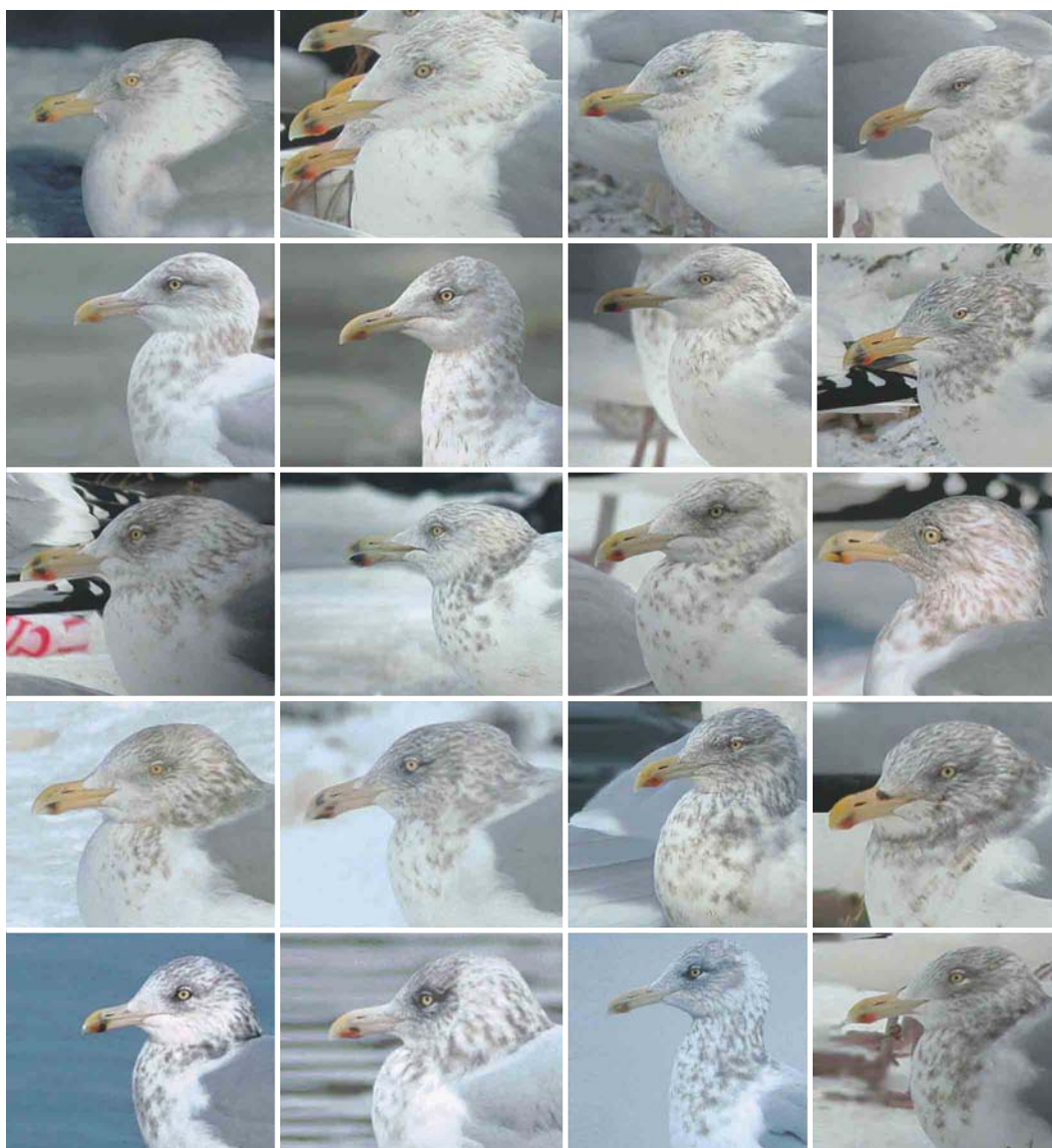
COMPOSITE 1 Winter head patterns of adult American Herring Gull / Amerikaanse Zilvermeeuw Larus smithsonianus , St John's, Newfoundland, Canada. All photographs taken between 23 October and 7 February. Head streaking is usually extensive; note that even paler-headed birds tend to show some streaks or blotches on the lower hindneck and breast. Darker-headed individuals can show a very dark spot in front of or around the eye. Note also bill pattern.

the upperparts are slightly paler than in 'northern' or 'Arctic' argentatus , the primary pattern is often also subtly different and the moult seems to occur slightly earlier, thus being more similar to argenteus (Hario & Kilpi 1986, Mierauskas & Greimas 1992, Jonsson 1998; pers obs; Klaus