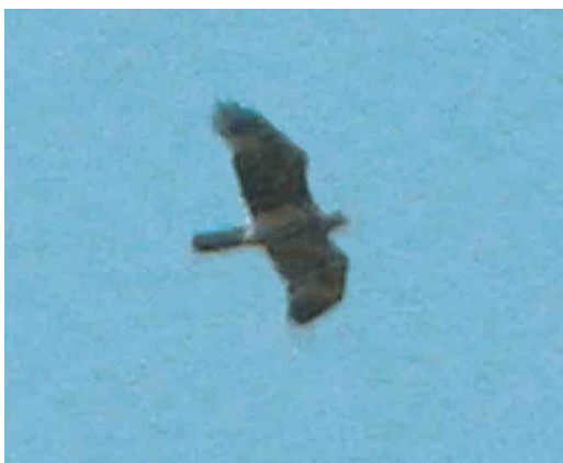
302 Havikarend / Bonelli's Eagle, Hieraetus fasciatus , onvolwassen, Oostende-Zandvoorde, West-Vlaanderen, 26 april 2004 (Roland François)

Het betrof een onvolwassen vogel van het lichte type (crèmekleurig met weinig rosse tinten); aangezien hij geen rui vertoonde vermoeden we dat het een tweede-kalenderjaar vogel betrof. Indien aanvaard door het Belgisch Avifaunistisch Homologatiecomité (BAHC) betreft dit de vijfde Havikarend voor België. De eerste vier gevallen betreffen alle verzamelde exemplaren: een juveniel mannetje bij Bornem, Antwerpen, op 23 maart 1889; een vogel bij Yvoir, Namur, op 27 juni 1926; een juveniele c 14 dagen bij Wuustwezel, Antwerpen, in begin juli 1955; en een onvolwassen vogel bij Moerbeke, Oost-Vlaanderen, in juni-augustus 1972. Havikarend is normaliter een (zeldzame) standvogel van zuidelijk Europa. De soort staat er bekend als bedreigd met naar schatting 600 broedparen. Er zijn drie gevallen in Nederland: in januari 1958 bij Gendringen, Gelderland (juveniel mannetje, verzameld), en zowel in september 1995 als september 2002 een onvolwassen vogel op Vlieland, Friesland. TIM GOETHALS