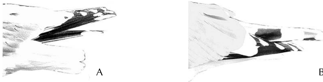
FIGURE 11 Wing-tips of European Herring Gull / Zilvermeeuw Larus argentatus at rest (Peter Adriaens). A = typical L. a. argentatus ; B = some L. a. argentatus and Eastern Baltic Herring Gulls. B is an example of a European bird with a long, broad tongue (projecting beyond the tertials) on the underside of p10. Note, however, in this case the absence of black marks near the tip of this primary. The black subterminal band of p9 shimmers through. Compare with plate 224.

We checked the presence or absence of black