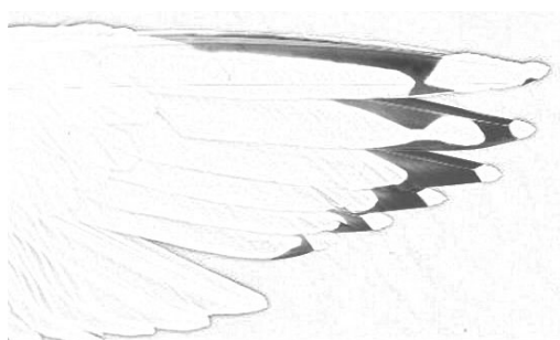
FIGURE 1b Newfoundland American Herring Gull / Amerikaanse Zilvermeeuw Larus smithsonianus , underwing of adult