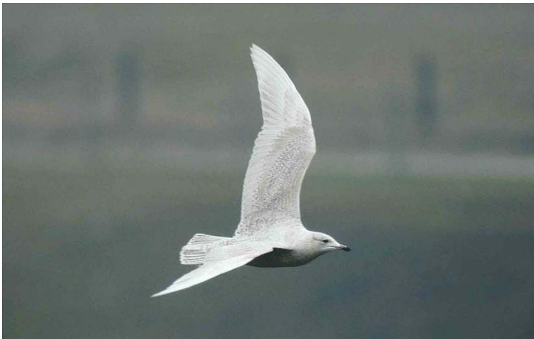
286 Kleine Burgemeester / Iceland Gull Larus glaucoides , eerste-winter, Katwijk aan Zee, Zuid-Holland, 6 mei 2004