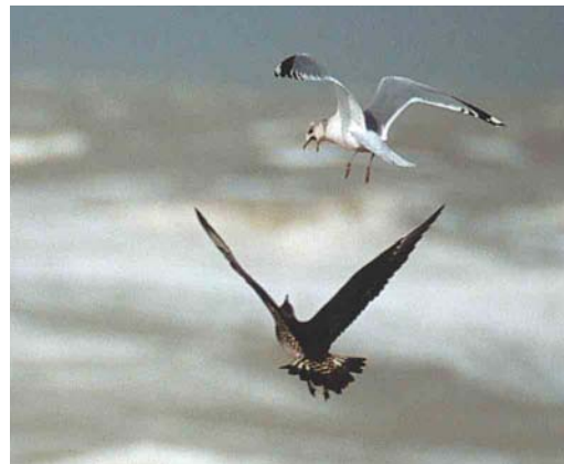
254 Parasitic Jaeger / Kleine Jager Stercorarius parasiticus , juvenile, with Common Gull / Stormmeeuw Larus canus canus , Katwijk aan Zee, Zuid-Holland, Netherlands, October 2003

This Parasitic Jaeger was photographed by Menno van Duin at Katwijk aan Zee, Zuid-Holland, the Netherlands, in October 2003. The same bird is depicted in plate 254 showing the projecting central rectrices. In Pomarine Jaeger, these are very short and hardly projecting, giving the tail a square-ended appearance, whereas in