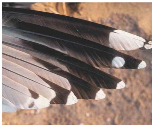
237 European Herring Gull / Zilvermeeuw Larus argentatus argenteus , adult, Zeebrugge, West-Vlaanderen, Belgium, June 2001. The tongue of p10 is not visible but in any case cannot be very broad. P5 does not show a complete black band, and the spot on the outer web is thick and solid (not 'U'-shaped). The grey tongue of p8 is shorter than on p7, and lacks a white tongue-tip. There are no 'bayonets' on p7-8, or perhaps a very slight one on p8, but it is hardly visible. Note also the rather large amount of black on the inner and outer webs of p9.

ters on p10 (as in figure 5a) was found in less than 9%. Again, we would like to emphasize that, of these 9% (and of those 5.8% of Eastern Baltic Herring Gulls mentioned under fig 5a), none showed a complete black band between the white mirror and tip.