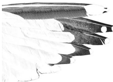
FIGURE 4b European Herring Gull / Zilvermeeuw Larus argentatus argenteus , underwing of adult (Peter Adriaens)

spring) show this colour. In argenteus , any yellow tinge to the legs often coincides with the development of a brighter yellow bill and pure white head in February-March, indicating that this yellow colour is a signal in breeding birds, and therefore not very likely to occur in smithsonianus vagrants. In Europe, a distinct yellowish tinge on the legs should be considered a sign that the bird is not a smithsonianus .