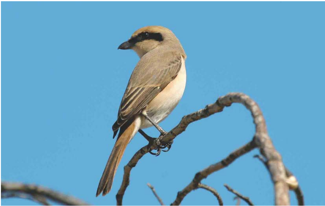
280 Daurian Shrike / Daurische Klauwier Lanius isabellinus , Paphos, Cyprus, 27 April 2004 (Pete Morris)