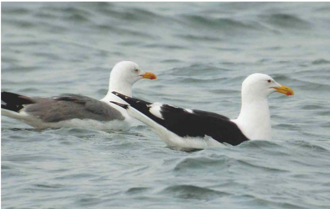
256 Cape Gull / Afrikaanse Kelpmeeuw Larus dominicanus vetula , with Yellow-legged Gull / Geelpootmeeuw L. michahellis , Iwik-Zira, Banc d'Arguin, Mauritania, 23 March 2004 (Kris De Rouck)