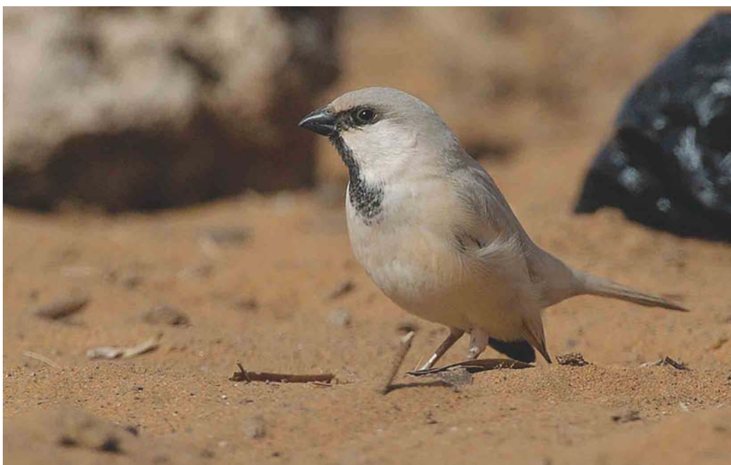
283 Desert Sparrow / Woestijnmus Passer simplex , male, Merzouga, Tafilalt, Morocco, January 2004