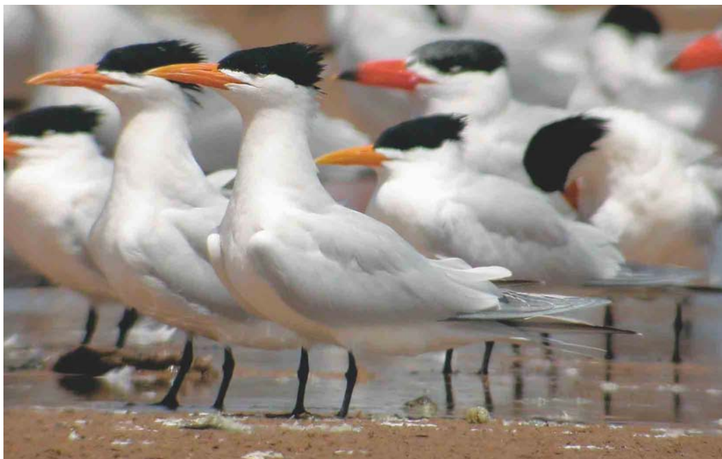
258 Royal Terns / Koningssterns Sterna maxima , with Caspian Terns / Reuzensterms S caspia , Cap Blanc, Mauritania, 26 March 2004 (Kris De Rouck)