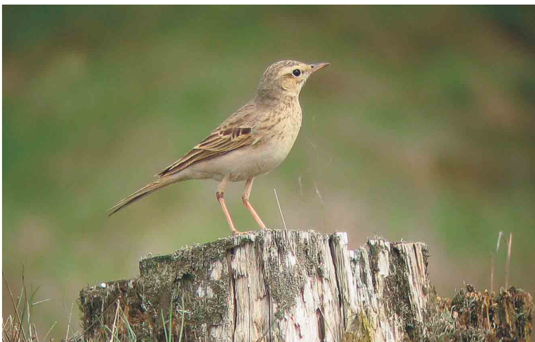
289 Duinpieper / Tawny Pipit Anthus campestris , Zeist, Utrecht, 27 april 2004 ( Maarten Pieter Lantsheer )