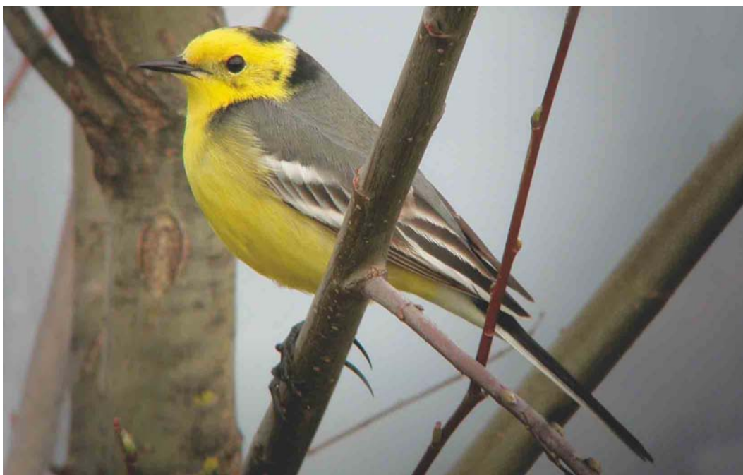
277 Citrine Wagtail / Citroenkwikstaart Motacilla citreola , second calendar-year male, Kerzers, Freiburg, Switzerland, April 2004