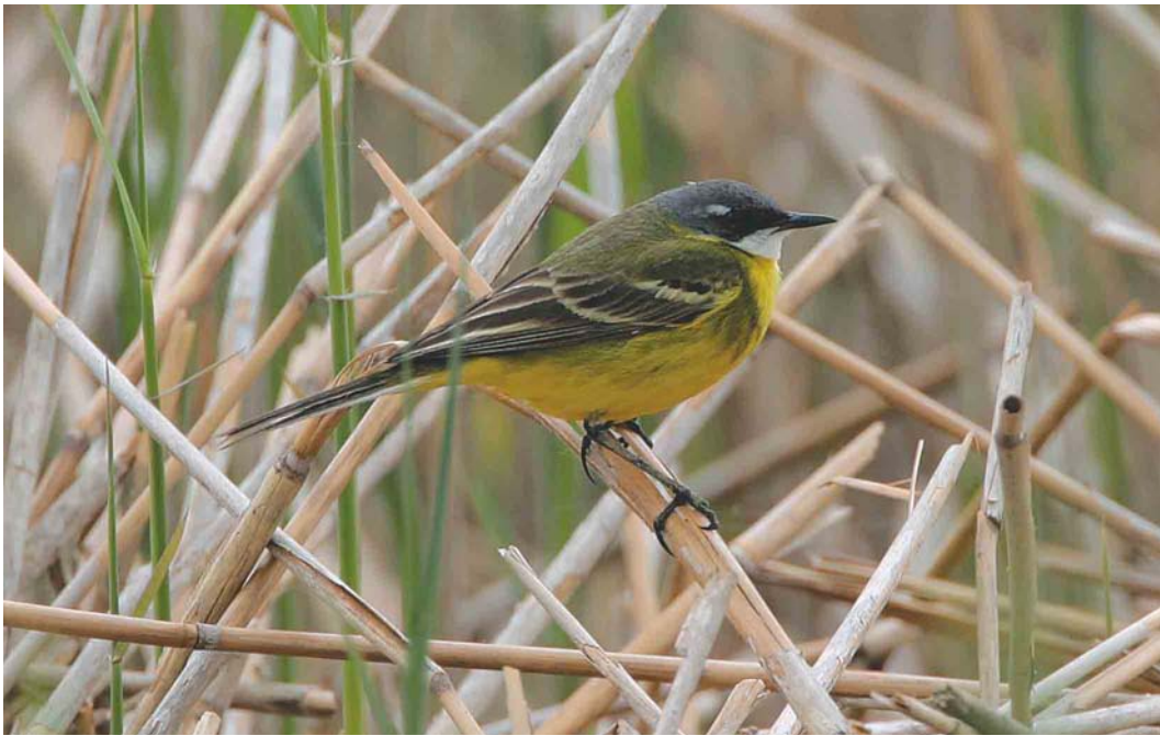
303-304 Vermoedelijke Italiaanse Kwikstaart / presumed Ashy-headed Wagtail Motacilla cinereocapilla , mannetje, Makkum, Friesland, 5 mei 2004 (Bas van den Boogaard)