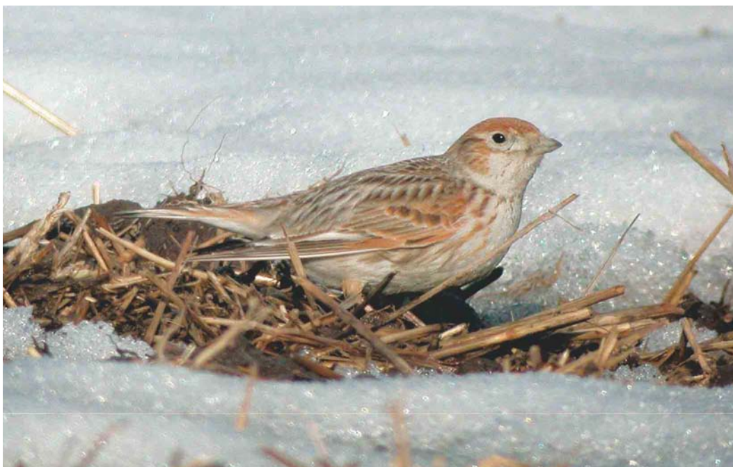
276 White-winged Lark / Witvleugelleeuwerik Melanocorypha leucoptera , Luumaki, Finland, April 2004