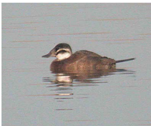
298 Geelsnavelduiker / Yellow-billed Loon Gavia adamsii , eerstejaars, Duffel, Antwerpen, 17 april 2004 299 Steppiekievit / Sociable Lapwing Vanellus gregarius , Mehaigne, Namur, 23 maart 2004 300 Witkopeend / White-headed Duck Oxyura leucocephala , met Tafeleend / Common Pochard Aythya ferina , Verrebroek, Oost-Vlaanderen, 20 maart 2004 301 Witkopeend / White-headed Duck Oxyura leucocephala , Verrebroek, Oost-Vlaanderen, maart 2004

kerke; Roloux, Liège; Zwijndrecht, Oost-Vlaanderen; Herent, Vlaams-Brabant; Adinkerke, West-Vlaanderen; Zeebrugge; en Uitkerke, West-Vlaanderen. De eerste Draaihals Jynx torquilla werd op 6 april bij Jalhay, Liège, waargenomen. Na 17 april volgden nog 21 meldingen. Op 6 maart werd bij Zedelgem, West-Vlaanderen, een Middelste Bonte Specht Dendrocopos medius waargenomen. Drie Strandleeuweriken Eremophila alpestris trokken op 16 april over Het Zwin in Knokke. De eerste Roodstuitzwaluw Hirundo daurica voor dit jaar vloog op 25 april over Het Zwin in Knokke en op 26 april vloog er één over Bredene. Op 27 april werd er één opgemerkt over Bredene-Zeebrugge-Knokke (en later over Breskens, Zeeland, Nederland); over Doel, Oost-Vlaanderen, trokken er toen twee samen. In Zeebrugge werd iets later een tweede exemplaar opgemerkt (ook in Breskens). Op 28 april vloog er alweer één over Bredene. Op 9 april