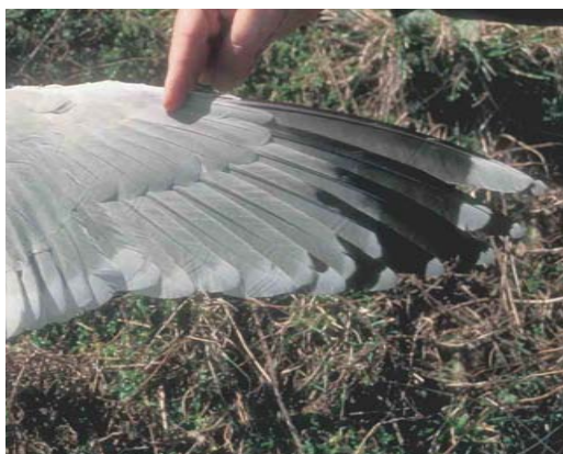
236 European Herring Gull / Zilvermeeuw Larus argentatus argenteus , adult, Zeebrugge, West-Vlaanderen, Belgium, June 2001 (Geert Spanoghe). An example of a bird with a complete black 'W' on p5. The grey tongue on p10 is not visible, but is certainly neither very broad nor long – otherwise it would appear in this photograph. The white mirror of p9 reaches onto the outer web, the outer web is solidly black up to the primary coverts, and the grey tongue is not visible, even though the wing is quite well spread here. The grey tongue of p8 is shorter than on p7, and does not really have a white tongue-tip. There are no 'bayonets' on p7-8, or perhaps a very slight one on p7, but it is hardly visible. The black pattern on p6 is quite thick, and is therefore more difficult to compare to a 'W'.