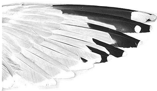
FIGURE 4a European Herring Gull / Zilvermeeuw Larus argentatus argenteus , upperwing of adult (Peter Adriaens)