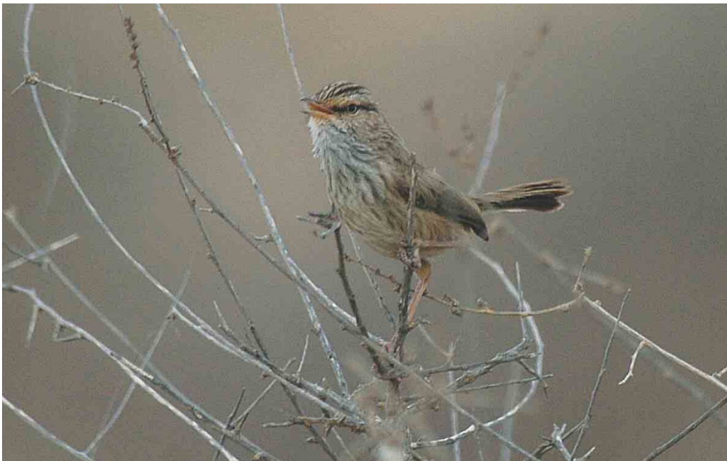
281 West Sahara Scrub Warbler / Westelijke Maquiszanger Scotocerca inquieta theresae , Goulimime, Morocco, 5 April 2004 (Arnoud B van den Berg)