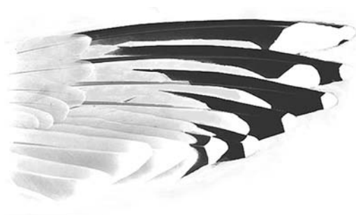
FIGURE 1a Newfoundland American Herring Gull / Amerikaanse Zilvermeeuw Larus smithsonianus, upperwing of adult