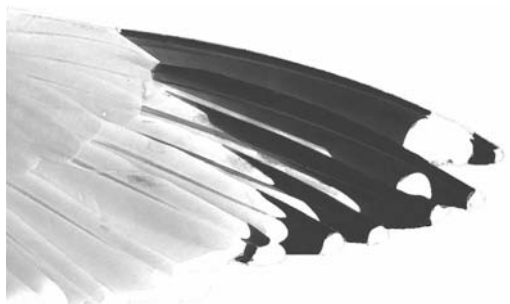
FIGURE 2a Newfoundland American Herring Gull / Amerikaanse Zilvermeeuw Larus smithsonianus, upperwing of adult