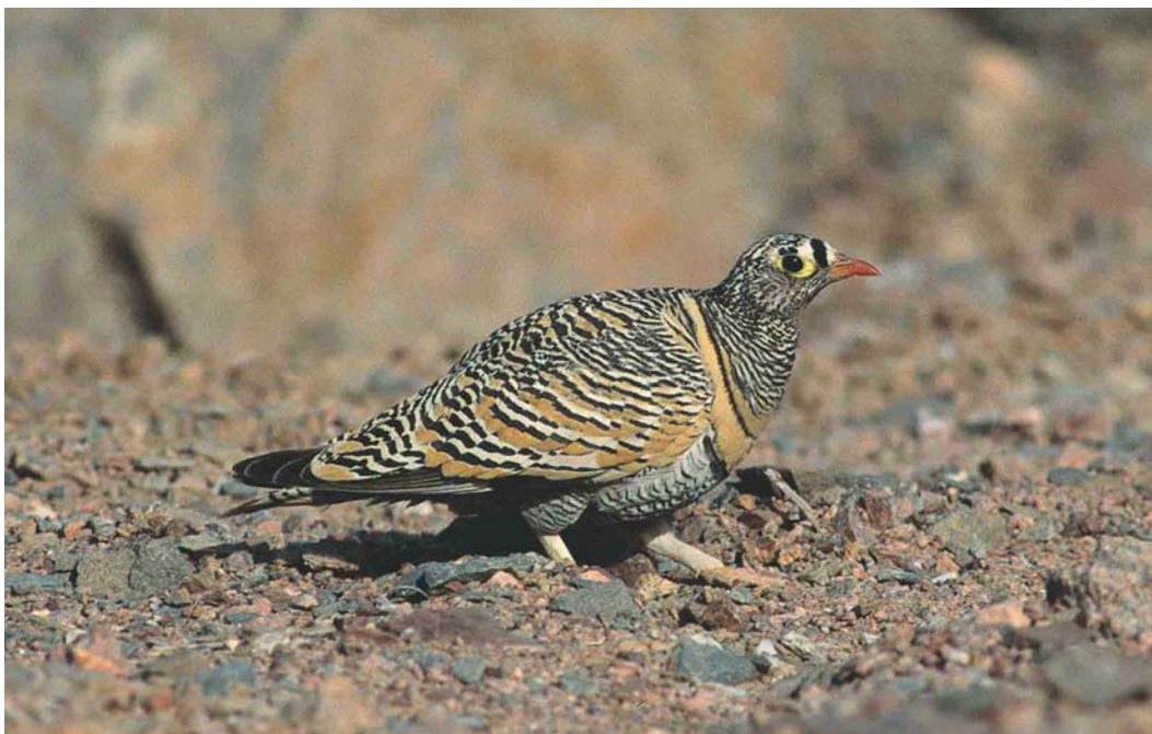
268 Lichtenstein's Sandgrouse / Lichtensteins Zandhoen Pterocles lichtensteinii , male, Eilat, Israel, 24 March 2004