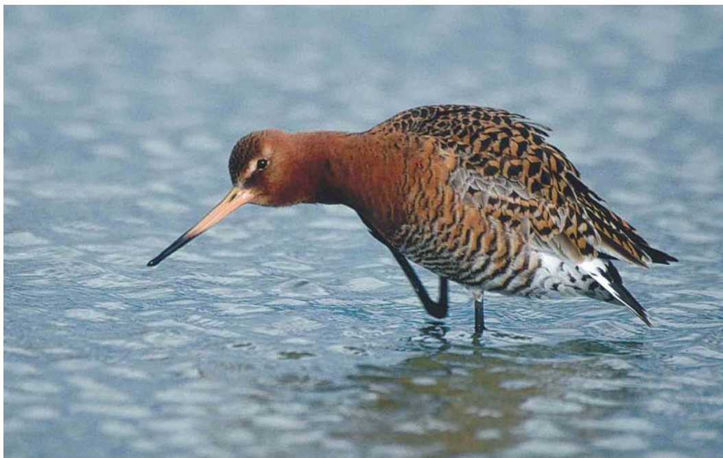
285 IJslandse Grutto / Icelandic Godwit Limosa limosa islandica , Spijk, Zuid-Holland, 26 maart 2004