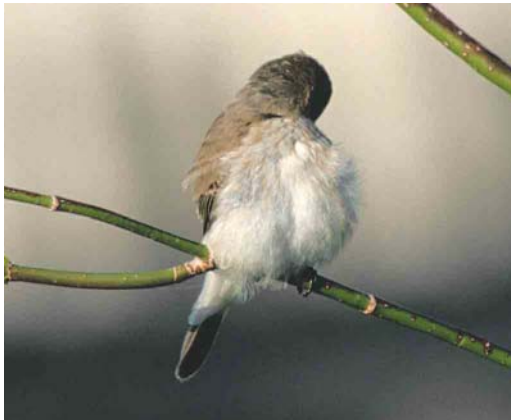
Mystery photograph V (May)