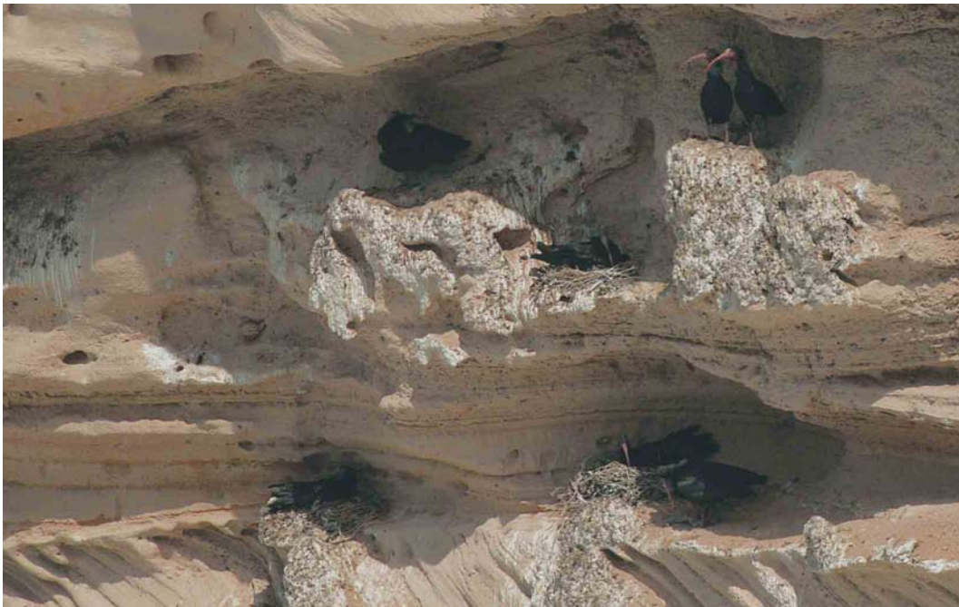
269 Northern Bald Ibises / Kaalkopibissen Geronticus eremita , Tamri, Agadir, Morocco, 20 March 2004 ( Arnoud B van den Berg ) 270 Moroccan Shag / Marokkaanse Kuifaalscholver Phalacrocorax aristotelis riggenbachi , Tamri, Morocco, 2 April 2004 ( Arnoud B van den Berg ) 271 Pharaoh Eagle Owl / Woestijnoehoe Bubo ascalaphus desertorum , male, Imiter, Boumalne de Dades, Morocco, 23 March 2004 ( Arnoud B van den Berg )