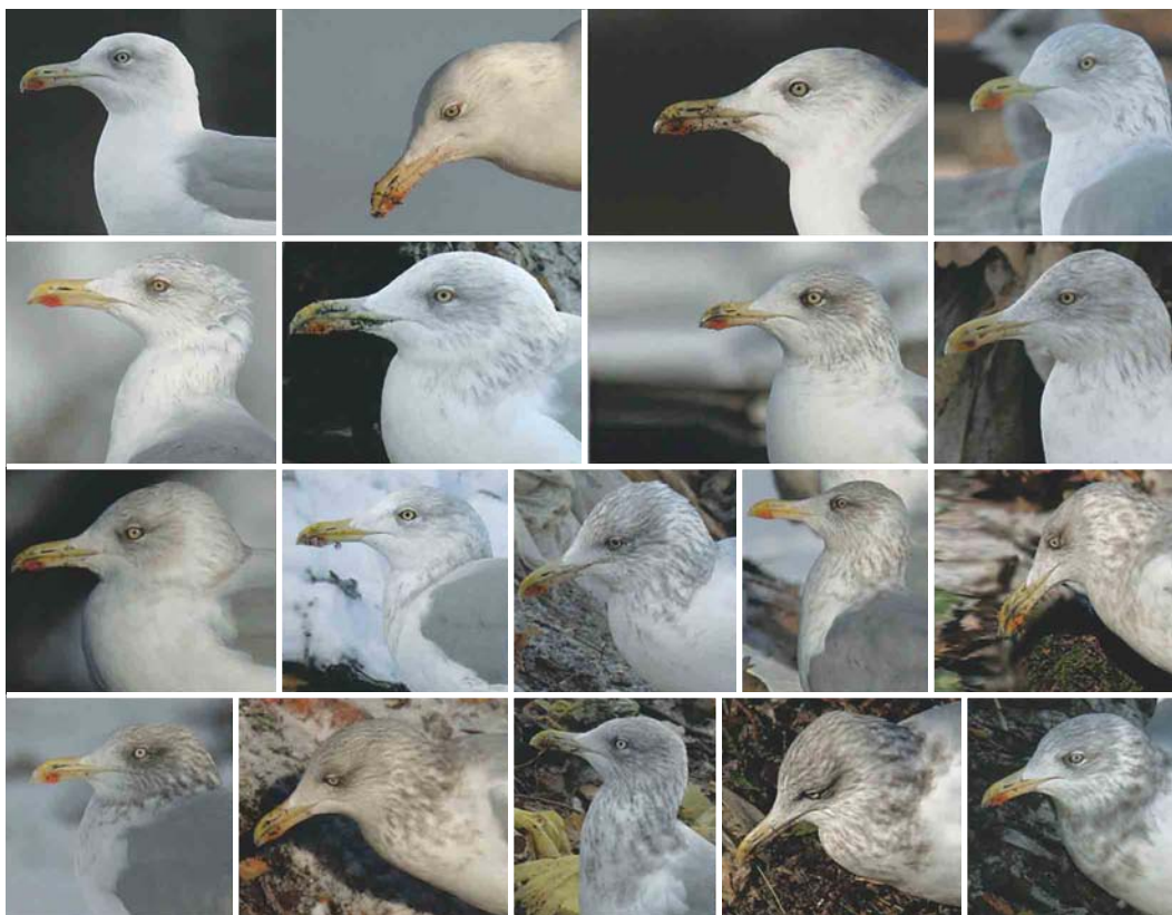
COMPOSITE 2 Head patterns of Eastern Baltic Herring Gull / Oostelijke Baltische Zilvermeeuw Larus argentatus , Tampere, Finland, 26 October 2003. The variation in autumn/winter head streaking is very extensive, with birds at the paler end being (almost) white-headed, and those at the darker end showing very dense streaks and blotches that reach well down onto the breast. At the darker end in particular, there is much overlap with smithsonianus . Note also the bill pattern, which tends to be a little more yellowish throughout than in many smithsonianus , with on average a slightly larger orange or red gonys spot.

ed by ringing recoveries. For this paper, 85 adult Eastern Baltic Herring Gulls were studied, from video sequences taken in southern Finland and photographs from Belarus, Estonia, Latvia and Poland.