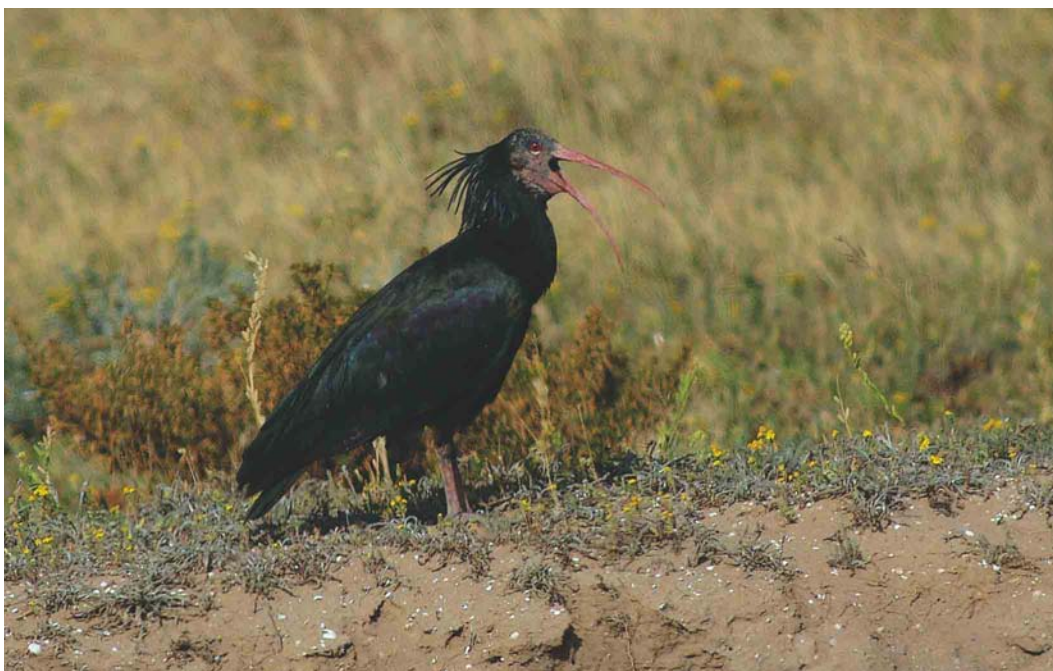
267 Northern Bald Ibis / Kaalkopibis Geronticus eremita , Tamri, Agadir, Morocco, 20 March 2004