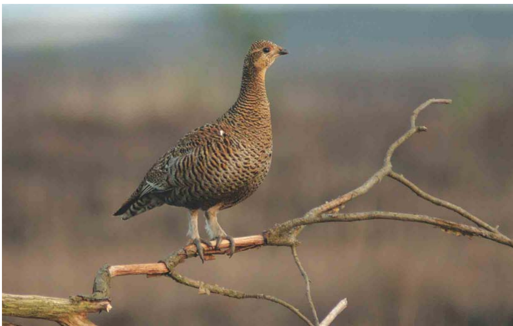
288 Korhoen / Black Grouse Tetrao tetrix , vrouwtje, Holterberg, Overijssel, 2 april 2004