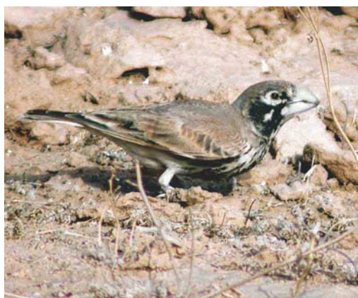
263 Greater Crested Tern / Grote Kuifstern Sterna bergii , Eilat, Israel, 4 March 2004 ( James P Smith ) 264 Thayer's Gull / Thayers Meeuw Larus thayeri , first-winter, Eskifjörður, Iceland, 3 April 2004 ( Yann Kolbeinnsson ) 265 Sudan Golden Sparrow / Bruinruggoudmus Passer luteus , male, Cansado-Nouadhibou, Mauritania, 26 March 2004 ( Kris De Rouck ) 266 Thick-billed Lark / Diksnavelleeuwerik Ramphocoris clotbey , Biq'at Uvda, Israel, 29 March 2004 ( Marnix Jonker )

Agadir, Morocco, up to 49 possible nests were counted in late March, with a maximum total of 197 individuals present in the area. The entire Moroccan population now stands at 368 individuals, all in the Agadir region. In 2003, 1314 nesting pairs of Eurasian Spoonbill Platalea leucorodia were counted in the Netherlands (considerably less than the 1586 in 2002), with maxima of 207 on Vlieland, Friesland, and 193 both on Terschelling, Friesland, and Texel, Noord-Holland.