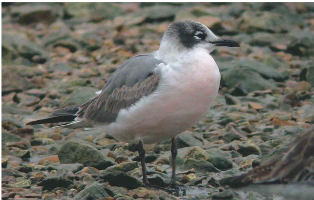
257 Franklin's Gull / Franklins Meeuw Larus pipixcan , first-winter, Radipole Lake, Dorset, England, 1 April 2004