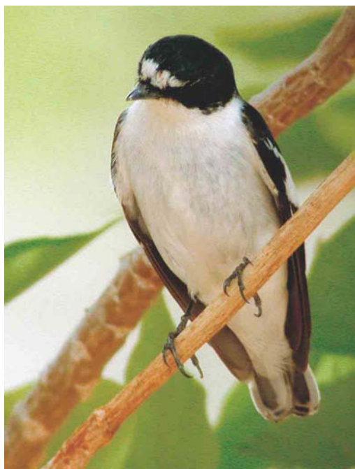
273 Bonelli's Eagle / Havikarend Hieraetus fasciatus , immature, with Western Marsh Harrier / Bruine Kiekendief Circus aeruginosus , Oostende-Zandvoorde, West-Vlaanderen, Belgium, 26 April 2004 274 Semi-collared Flycatcher / Balkanvliegenvanger Ficedula semitorquata , male, Lotan, Israel, 30 March 2004 275 Alpine Accentor / Alpenheggenmus Prunella collaris , Blåvand Ringing Station, Vestjylland, Denmark, 11 May 2004