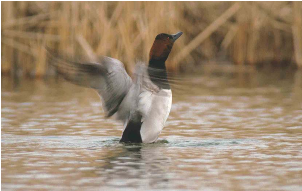
250 Grote Tafeleend / Canvasback Aythya valisineria , adult mannetje, Castricum aan Zee, Noord-Holland, 10 januari 2003 (Marten van Dijk)