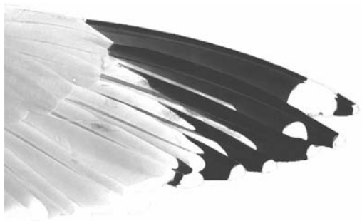
FIGURE 2a Newfoundland American Herring Gull / Amerikaanse Zilvermeeuw Larus smithsonianus , upperwing of adult (Peter Adriaens)