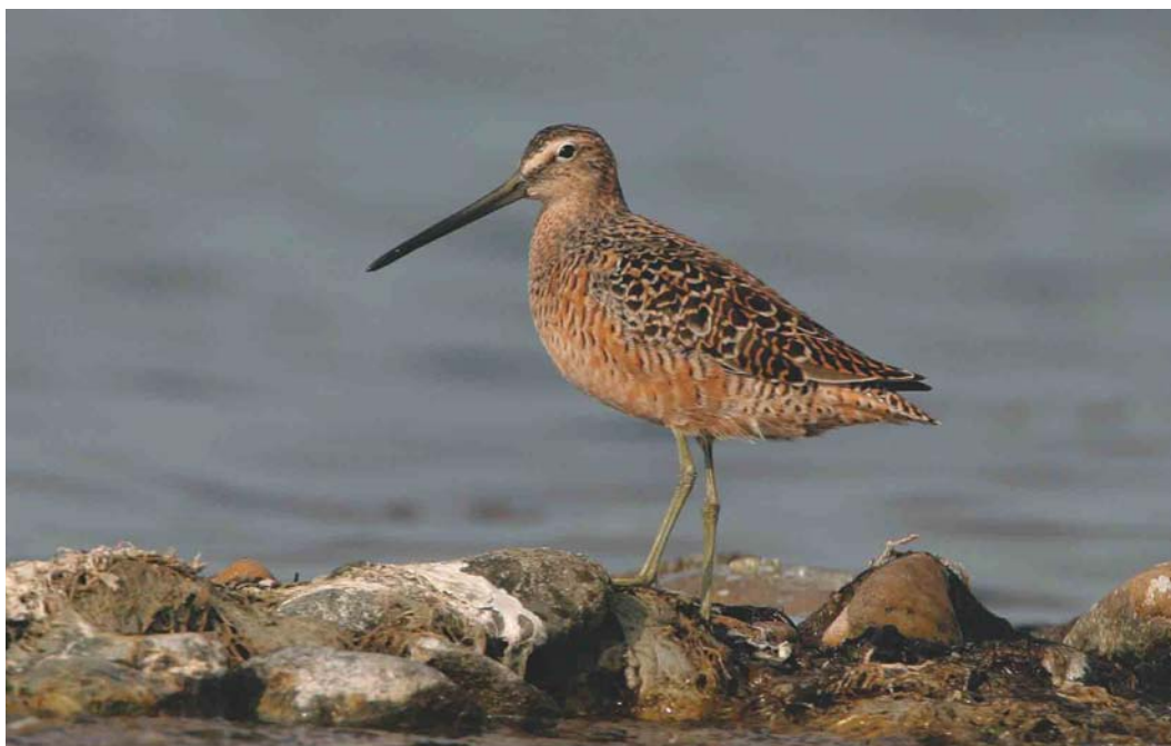
284 Grote Griijze Snip / Long-billed Dowitcher Limnodromus scolopaceus , eerstejaars, Veerse Meer, Oud-Sabbinge, Zeeland, 24 april 2004