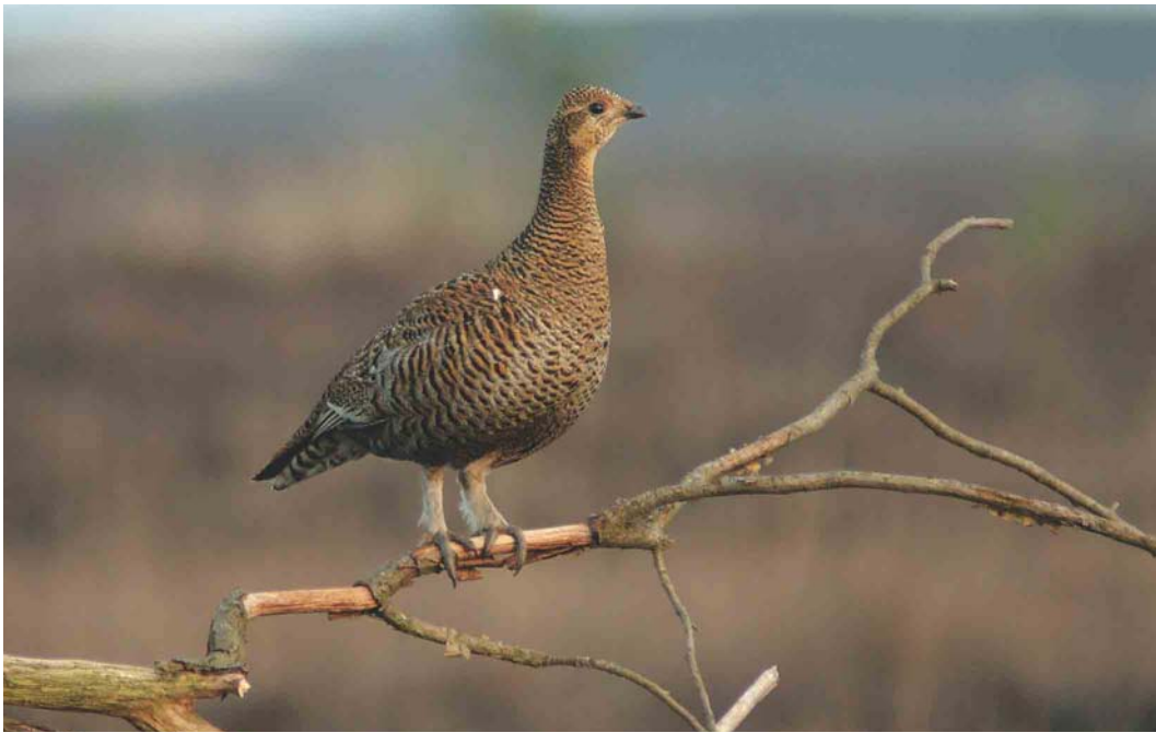
288 Korhoen / Black Grouse Tetrao tetrix , vrouwtje, Holterberg, Overijssel, 2 april 2004