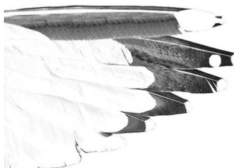
FIGURE 4b European Herring Gull / Zilvermeeuw Larus argentatus argenteus , underwing of adult

spring) show this colour. In argenteus , any yellow tinge to the legs often coincides with the development of a brighter yellow bill and pure white head in February-March, indicating that this yellow colour is a signal in breeding birds, and therefore not very likely to occur in smithsonianus vagrants. In Europe, a distinct yellowish tinge on the legs should be considered a sign that the bird is not a smithsonianus .