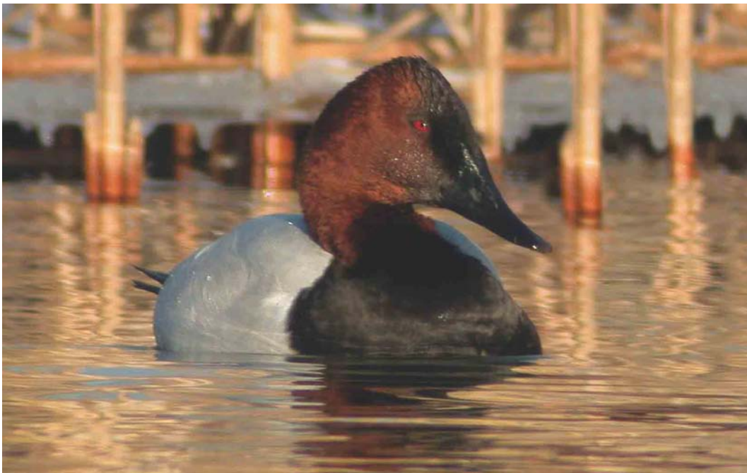
251 Grote Tafeleend / Canvasback Aythya valisineria , adult mannetje, Castricum aan Zee, Noord-Holland, 10 januari 2003