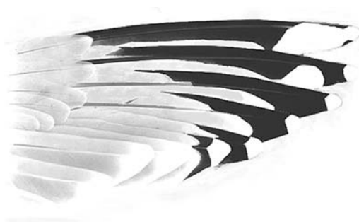
FIGURE 1a Newfoundland American Herring Gull / Amerikaanse Zilvermeeuw Larus smithsonianus , upperwing of adult