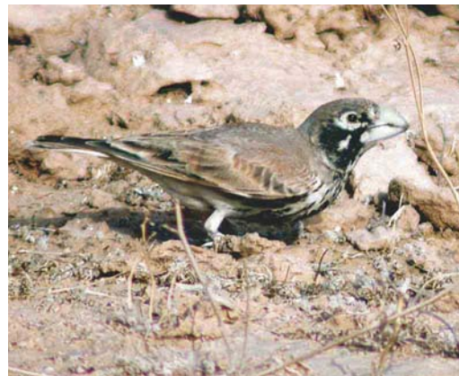
263 Greater Crested Tern / Grote Kuifstern Sterna bergii , Eilat, Israel, 4 March 2004 ( James P Smith ) 264 Thayer's Gull / Thayers Meeuw Larus thayeri , first-winter, Eskifjörður, Iceland, 3 April 2004 ( Yann Kolbeinnsson ) 265 Sudan Golden Sparrow / Bruinruggoudmus Passer luteus , male, Cansado-Nouadhibou, Mauritania, 26 March 2004 ( Kris De Rouck ) 266 Thick-billed Lark / Diksnavelleeuwerik Ramphocoris clotbey , Biq'at Uvda, Israel, 29 March 2004 ( Marnix Jonker )

Agadir, Morocco, up to 49 possible nests were counted in late March, with a maximum total of 197 individuals present in the area. The entire Moroccan population now stands at 368 individuals, all in the Agadir region. In 2003, 1314 nesting pairs of Eurasian Spoonbill Platalea leucorodia were counted in the Netherlands (considerably less than the 1586 in 2002), with maxima of 207 on Vlieland, Friesland, and 193 both on Terschelling, Friesland, and Texel, Noord-Holland.