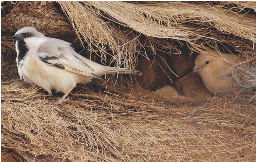
282 Desert Sparrows / Woestijnmussen Passer simplex , male (left) and female, Merzouga, Tafilalt, Morocco, 30 March 2004 ( Arnoud B van den Berg )