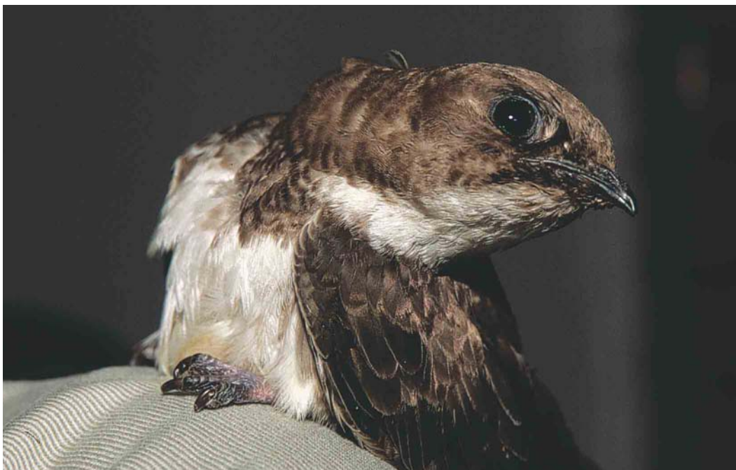
158 Alpengierzwaluw / Alpine Swift Apus melba , eerste-winter (ter verzorging gevangen te / taken into care at Wageningen, Gelderland, op 4 december 2002), Bennekom, Gelderland, 5 januari 2003

dus nog niet losgelaten worden. Het leek de Stichting Gierzwaluwenwerkgroep Nederland bovendien het beste om hem los te laten in Zwitserland en niet in Nederland. De vogel zou dan een hernieuwde start kunnen maken tussen soortgenoten en plaatselijk deskundige begeleiding krijgen alvorens te worden losgelaten. Op 20 mei 2003 kreeg de Stichting schriftelijke toestemming van het Ministerie van Landbouw, Natuur en Voedselkwaliteit (LNV) om de vogel naar Zwitserland te brengen. Op Hemelvaartsdag (29 mei) 2003 was het eindelijk zover dat de inmiddels 'Melba' gedoopte vogel naar Baden nabij Zürich, Zwitserland, kon worden vervoerd. Het verenkleed verkeerde echter in een dusdanig slechte staat dat hij nog niet in staat was normaal uit te vliegen. Vooral de staart die gedurende een half jaar veelvuldig in aanraking was gekomen met de ondergrond van het aquarium waarin de vogel werd gehouden vertoonde ernstige slijtage. In Zwitserland werd besloten de vogel nieuwe staartpennen te geven door middel van een staartpentransplantatie. Hierbij worden de gesleten staartpennen afgeknipt en niet gesleten pennen van een dode Alpengierzwaluw van een