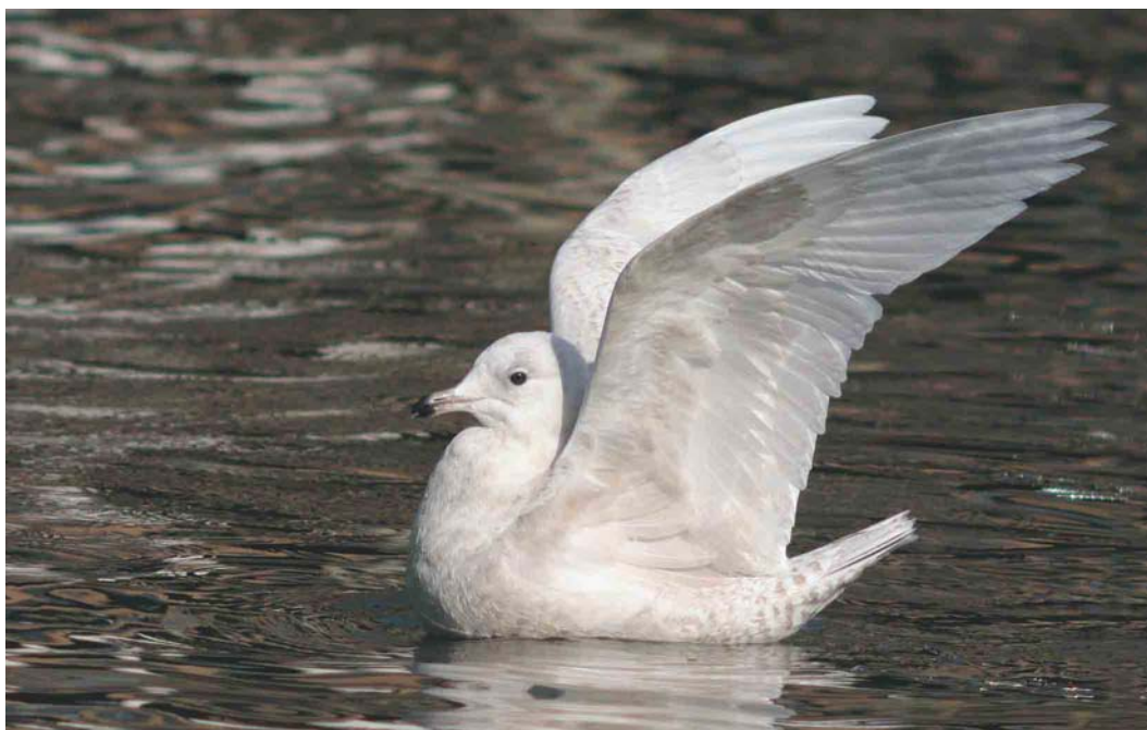
214 Kleine Burgemeester / Iceland Gull Larus glaucooides , eerste-winter, Rotterdam, Zuid-Holland, 1 maart 2004 (Chris van Rijswijk)