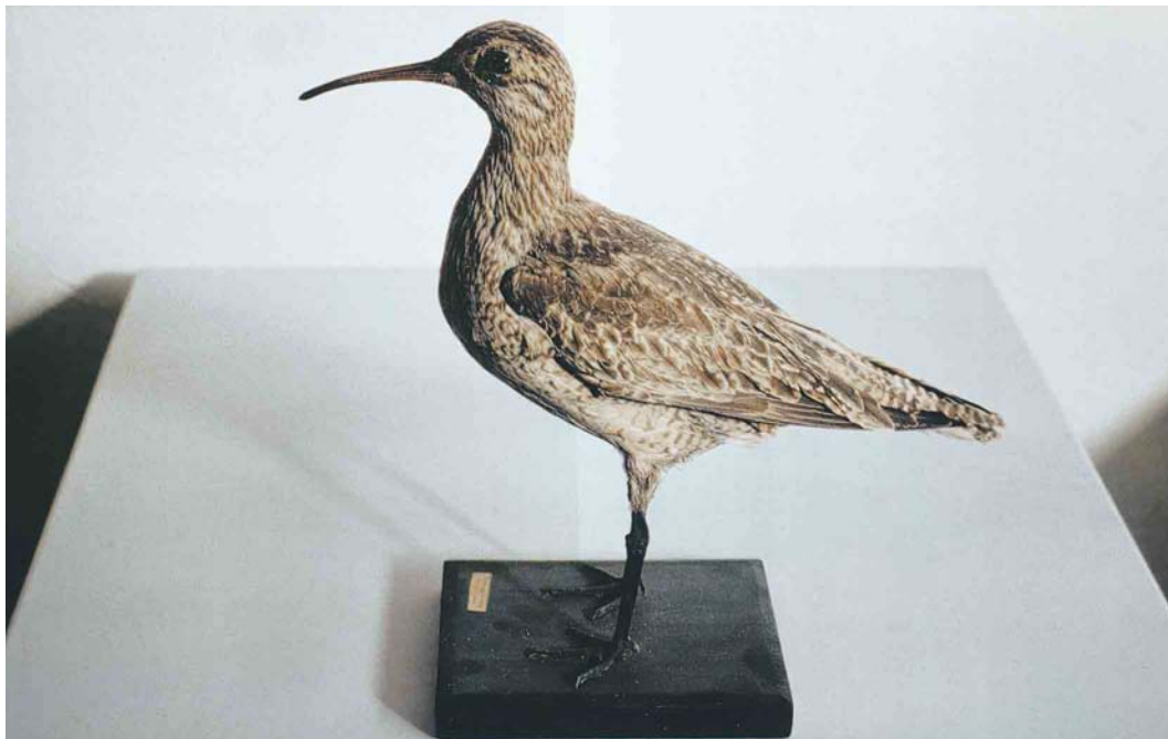
178 Eskimo Curlew / Eskimowulp Numenius borealis (shot on Tresco, Scilly, England, on 10 September 1887), Isles of Scilly Museum, St Mary's, Scilly, England, October 1992 (Paul Knolle). Reproduced with permission from the Isles of Scilly Museum.

to cross (if they arrive from the mainland at all). It is also interesting to note how rare some species in Scilly are compared with their presence in or around the North Sea. Compare, for instance, Velvet Scoter Melanitta fusca (11 records, involving 17 birds) with Surf Scoter (nine records), Marsh Sandpiper Tringa stagnatilis (one record) with the Nearctic yellowlegs (16 in total: five Greater Yellowlegs T. melanoleuca , nine Lesser Yellowlegs T. flavipes and two unidentified yellowlegs) and Lesser Grey Shrike L. minor (seven records, none since 1976) with Great Grey Shrike (eight records, only one since 1978). And what to think of only 17 records (involving 19 birds) of Great Crested Grebe Podiceps cristatus and only five records (involving seven birds) of Eurasian Jay Garrulus glandarius ? The latter examples illustrate the true rarity of some of the 'common' European species rather than a lack of observer's awareness, because few islands will be so intensively covered as Scilly, at least during the migration months in autumn. It is this kind of reading and browsing that makes The birds of the Isles of Scilly a fascinating book for many birders. My feeling is that the most important information could have been presented in a more compact, more richly illustrated and yet less expensive way but that may be as much a reflection of my own preferences as a criticism of this book. ENNO B EBELS