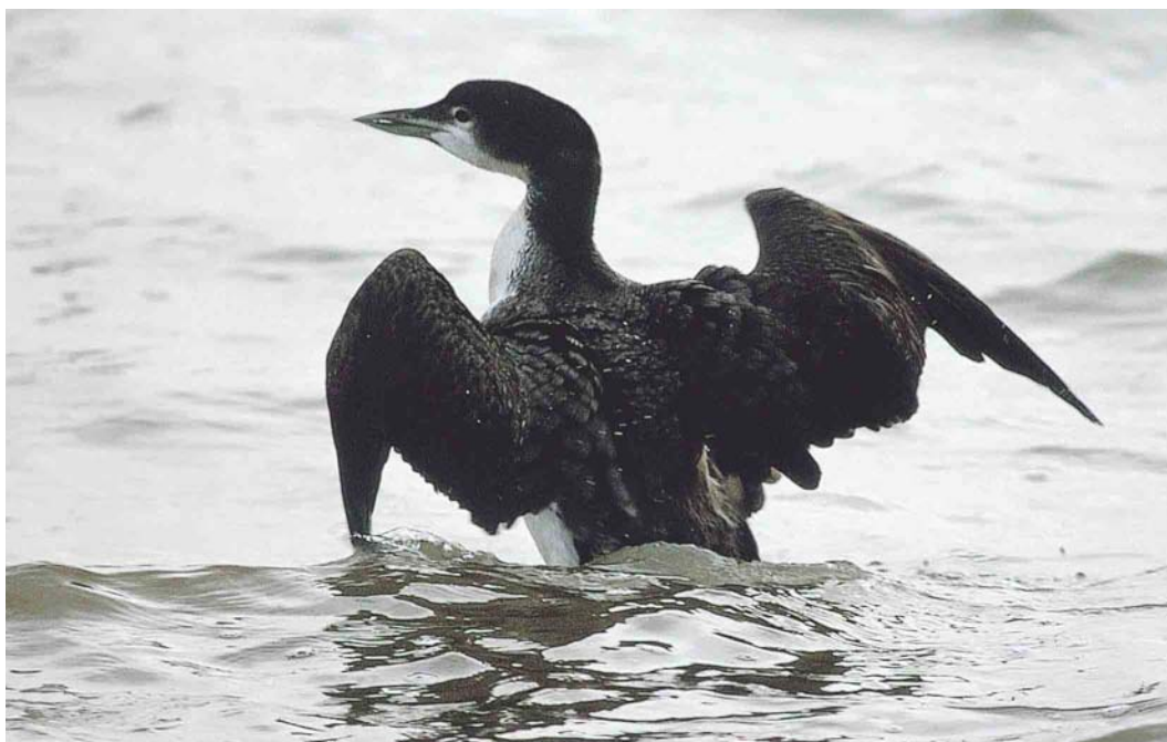
202 Ijsduiker / Great Northern Loon Gavia immer , Oostvoorne, Zuid-Holland, 23 januari 2004