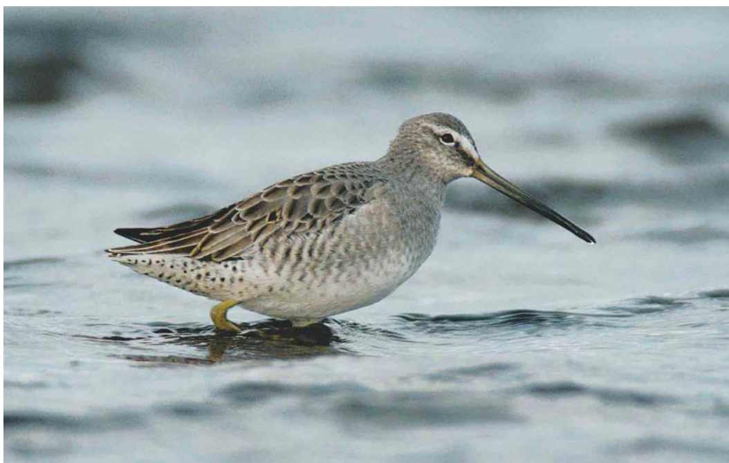
215 Grote Grijze Snip / Long-billed Dowitcher Limnodromus scolopaceus , eerstejaars, Veerse Meer, Oud-Sabbinge, Zeeland, 8 maart 2004 (Marten van Dijk)