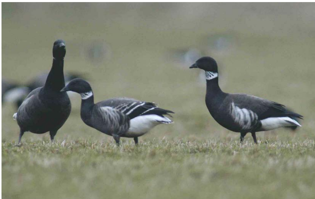
203 Zwarte Rotganzen / Black Brants Branta nigricans , adult (rechts) en juveniel, met Rotgans / Dark-bellied Brent Goose B bernicla (links), Yerseke, Zeeland, 1 februari 2004