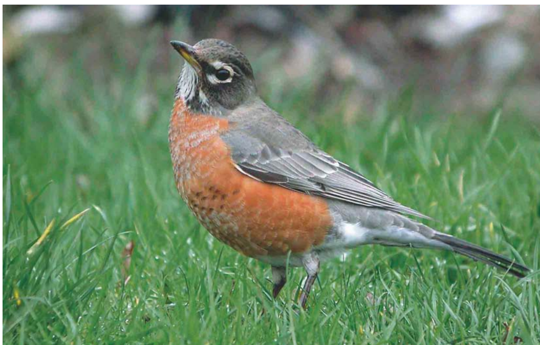
199 American Robin / Roodborstlijster Turdus migratorius , Grimsby, Lincolnshire, England, February 2004