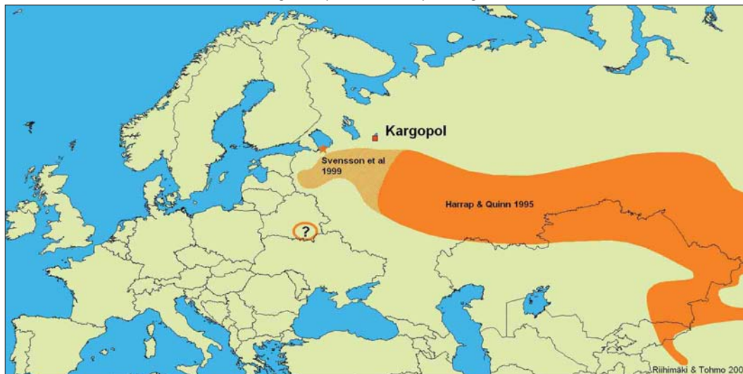
FIGURE 1 Breeding range of Azure Tit / Azuurmees Parus cyanus , after Harrap & Quinn (1995a) and Svensson et al (1999). The breeding attempt on the Novaja Ladoga is marked with *.

The total number of bird species recorded during the Kargopol expedition in 2003 was 168 (106 in 2002). Of these, 37 are included on the Annex of the European Union's Bird Directive. Almost all of the species recorded occur in Scandinavia and central Europe as well but their occurrence and numbers differ. Species common in Finland, such as Great Spotted Woodpecker D major , Goldcrest Regulus regulus , Crested Tit P cristatus , Willow Tit P montanus and Coal Tit P ater were very uncommon. Species uncommon or rare in other European countries were recorded at many sites: Great Snipe Gallinago media , Terek Sandpiper Xenus cinereus , White-backed Woodpecker D leucotos and Citrine Wagtail Motacilla citreola . The team found out that for many species even the most recent distribution maps were inaccurate. At least the following species either breed or occur regularly in the Kargopol area and this should be taken into account when new distribution maps are made: Gadwall Anas strepera , Great Bittern Botaurus stellaris , Grey Heron Ardea cinerea , Pallid Harrier Circus macrourus , Montagu's Harrier C pygargus , Common Quail Coturnix coturnix (which is nowadays rather