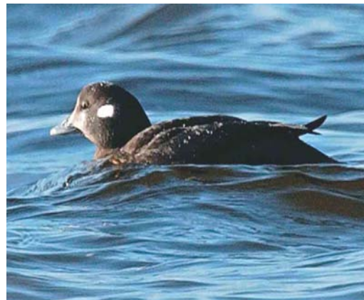
192 Siberian Rubythroat / Roodkeelnachtegaal Luscinia calliope , first-winter female, Rabat, Malta, 25 January 2004 193 Cape Verde Buzzard / Kaapverdische Buizerd Buteo (buteo) bannermanni , São Jorge dos Orgãos, Santiago, Cape Verde Islands, 11 March 2004 194 American Coot / Amerikaanse Meerkoet Fulica americana (left) with Eurasian Coot / Meerkoet F atra , Lagoa das Furnas, São Miguel, Azores, 14 February 2004 195 Harlequin Duck / Harlekijnend Histrionicus histrionicus , female, Lewis, Western Isles, Scotland, 20 February 2004

at nearby Choggia, Veneto). In Nord, France, an adult Ross's Gull Rhodostethia rosea was sighted for 20 min at Jetée du Clipon, Dunkerque, on 8 February. In Ireland, Forster's Terns Sterna forsteri occurred at Nimmo's Pier, Galway, from 26 November 2003 into March and at Rosslare, Wexford, (again) from 8 February. In Northern Ireland, an adult stayed at Strangford Lough, Down, Northern Ireland, from 8 February. The first Brown Noddy Anous stolidus in winter for the UAE was at Ra's Dibba on 23 February.