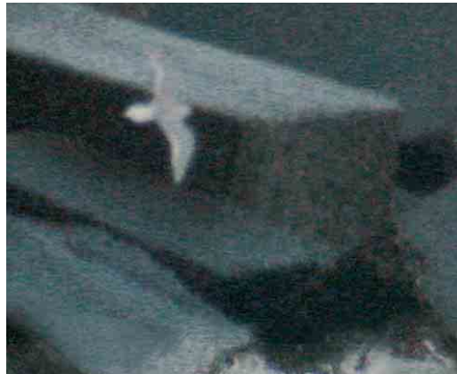
188 Ring-billed Gull / Ringsnavelmeeuw Larus delawarensis , adult, Venezia, Veneto, Italy, 22 February 2004 189 Pallas's Gull / Reuzenzwartkopmeeuw Larus ichthyaetus , adult, Mietkow reservoir, Wrocław, Silesia, Poland, 26 February 2004 190-191 Ross's Gull / Ross' Meeuw Rhodostethia rosea , adult, Jetée du Clipon, Dunkerque, Nord, France, 8 February 2004

reported in late February. On at least 13-21 January, a Slender-billed Gull L. genei was present at Castro Marim, Algarve, Portugal, where this species is still a rarity. The fifth Iceland Gull L. glaucoides for Morocco was a third-winter at Aghroud, north of Agadir, on 11 January. In the Azores, a first-winter was present at the landfill site on Terceira on 18 February. If accepted, an adult Thayer's Gull L. thayeri at Sandgerði on 10 March will be the first for Iceland. After the first at Nimmo's Pier, Galway, Ireland, on 24 January (Dutch Birding 26: 35, plate 86, 2004), the number of reports of American Herring Gulls L. smithsonianus increased, as is usual for February-March in recent years. These included a total of up to 11 for the Azores (up to three on São Miguel on 11-13 February) and up to eight on Terceira on 14-18 February). If accepted, a third-winter at the Reykjanes peninsula from 7 March will be the fifth for Iceland; this individual was followed by three first-winters