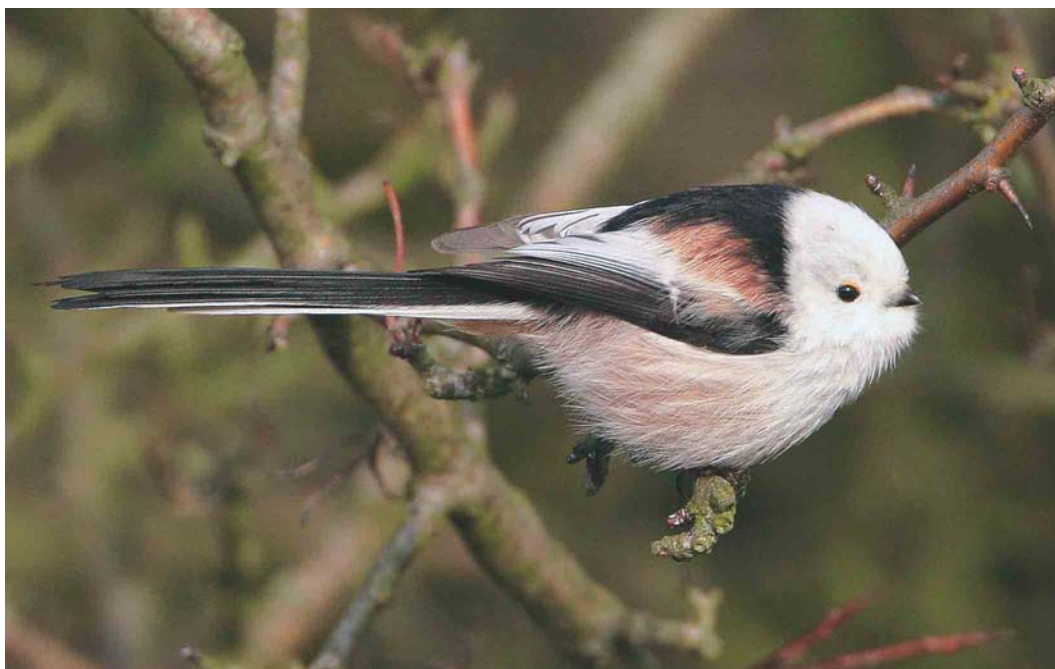
198 White-headed Long-tailed Tit / Witkopstaartmees Aegithalos caudatus caudatus , Westleton Heath, Suffolk, England, 22 February 2004 ( Bill Baston )