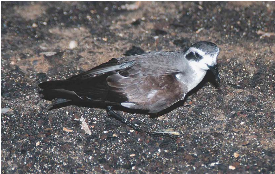
182 White-faced Storm-petrel / Bont Stormvogeltje Pelagodroma marina , Branco, Cape Verde Islands, 14 February 2004 (Arnoud B van den Berg)