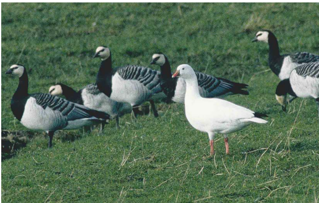
164 Ross' Gans / Ross's Goose Anser rossii , Anjumerkolken, Friesland, 26 februari 2000 ( Lucien Davids )