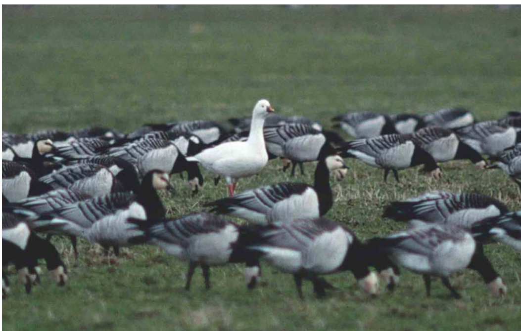
165 Ross' Gans / Ross's Goose Anser rossii , Anjumerkolken, Friesland, 2 maart 2000