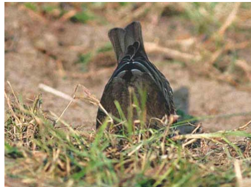
Mystery photograph IV (October)

for falcons Falco (15%) or swifts Apus (3%). Indeed, both are long winged but miss out on some characters. Juvenile falcons show more pale fringes on the scapulars. Dark-plumaged adult falcons, like Eleonora's Falcon F eleonora and Sooty Falcon F concolor , the most mentioned falcons, would be slimmer and would show a longer tail. In addition, the bill of the bird is just visible and shows a pointed tip. Swifts can be eliminated by the rather erect posture, quite unlike the clumsy crouching swifts. Furthermore, swifts have even longer and more pointed wings.