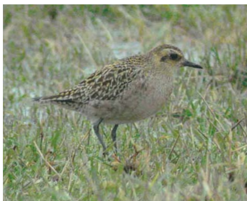
208 Vermoedelijke Toendraslechtsvalk / presumed Tundra Peregrine Falcon Falco peregrinus calidus , eerstejaars, Veerse Meer, Zeeland, 15 januari 2004 (Pim A Wolf) 209 Humes Bladkoning / Hume's Leaf Warbler Phylloscopus humei , Grou, Friesland, 4 januari 2004 (Bas van den Boogaard) 210 Amerikaanse Goudplevier / American Golden Plover Pluvialis dominica , Grijskerke, Zeeland, 12 januari 2004 (Pim A Wolf) 211 Aziatische Goudplevier / Pacific Golden Plover Pluvialis fulva , Grijskerke, Zeeland, 31 januari 2004 (Pim A Wolf)

KRAANVOGEL TOT ALKEN Eind februari werden weer twee Kraanvogels Grus grus gezien in de omgeving van het Fochteloërveen, Drenthe/Friesland. Eén exemplaar was op 21 februari aanwezig ten zuiden van de Lepelaarsplassen, Flevoland. Een Amerikaanse Goudplevier Pluvialis dominica die op 12 januari werd ontdekt bij Grijskerke, Zeeland, werd daar onregelmatig gezien tot 12 februari. Op dezelfde plek werd op 14 januari aan de hand van video-opnames een Aziatische Goudplevier P. fulva ontmaskerd, die eveneens onregelmatig werd gezien tot 21 februari; slechts een enkele keer werden beide dwaalgasten tegelijkertijd waargenomen in de grote groep Goudplevieren P. apricaria . De eerste-winter Grote Grijsze Snip Limnodromus scolopaceus van het Veerse Meer bleef daar tot in maart. Een Regenwulp Numenius phaeopus werd op 22 februari opgemerkt bij Yerseke. Rosse Franjepoten Phalaropus