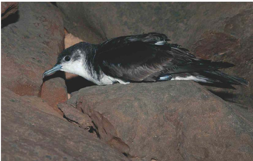
183 Cape Verde Little Shearwater / Kaapverdische Kleine Pijlstormvogel Puffinus (assimilis) boydi , Raso, Cape Verde Islands, 14 February 2004