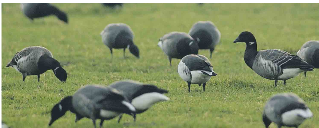
172 Witbuikrotgans / Pale-bellied Brent Goose Branta hrota , adult mannetje (links), Rotganzen / Dark-bellied Brent Geese B bernicla , en twee hybriden Witbuikrotgans x Rotgans / Pale-bellied Brent Goose x Dark-bellied Brent Goose, eerstejaars (rechts), Wagejot, Texel, Noord-Holland, 30 december 2003 (René Pop) 173 Witbuikrotgans / Pale-bellied Brent Goose Branta hrota , adult mannetje (rechts), Rotganzen / Dark-bellied Brent Geese B bernicla , en hybride Witbuikrotgans x Rotgans / Pale-bellied Brent Goose x Dark-bellied Brent Goose (midden), Wagejot, Texel, Noord-Holland, 30 december 2003 (René Pop) 174 Witbuikrotgans / Pale-bellied Brent Goose Branta hrota , adult mannetje (midden), Rotganzen / Dark-bellied Brent Geese B bernicla , en twee hybriden Witbuikrotgans x Rotgans / Pale-bellied Brent Goose x Dark-bellied Brent Goose, eerstejaars (rechts en links), Wagejot, Texel, Noord-Holland, 30 december 2003 (René Pop)

september tot mei in Nederland. Tijdens de vermenging in de wintergebieden kunnen gemengde paren gevormd worden.