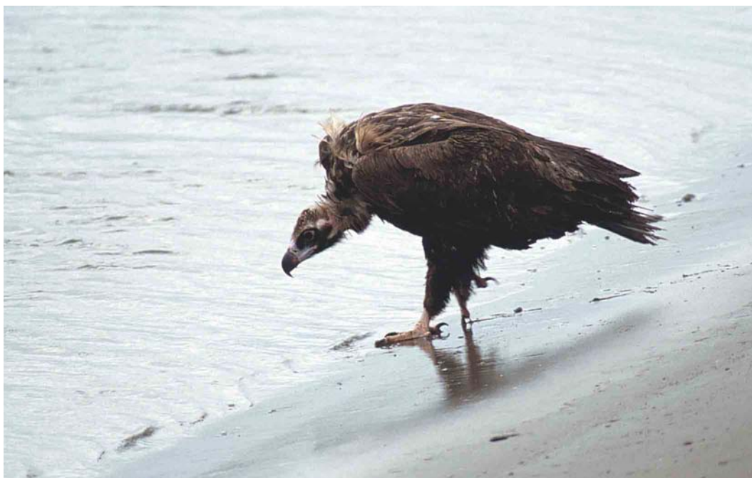
150-151 Monniksgier / Eurasian Black Vulture Aegypius monachus , onvolwassen, Maasvlakte, Zuid-Holland, 15 augustus 2000