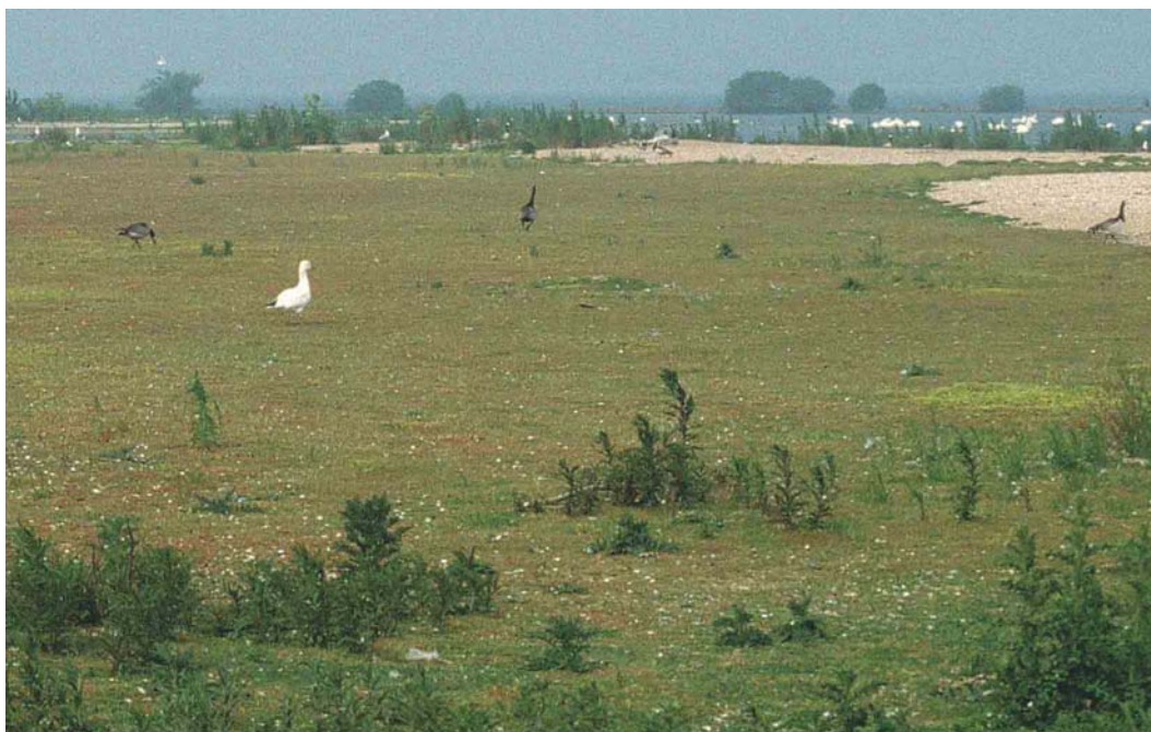
171 Ross' Gans / Ross's Goose Anser rossii , nabij nest, Slijkplaat, Haringvliet, Zuid-Holland, 2 juni 2003 (Peter L Meininger)

Ross' Gans. Op beide data was de vogel alleen: er was geen sprake van een 'wakend' mannetje Brandgans in de omgeving en ook als de vogel opvloog bleef deze solitair rondjes vliegen. Er waren dus geen aanwijzingen dat de vogel was gepaard met een Brandgans of voor de aanwezigheid van een tweede Ross' Gans. Op 18 juni leek het nest met de vijf eieren verlaten en werd de Ross' Gans niet meer aangetroffen. Ook tijdens het laatste bezoek op 8 juli was er geen spoor van de Ross' Gans, terwijl de meeste eieren nu gepredeerd waren. Het feit dat de vogel daadwerkelijk broedend op het nest werd gezien, alsmede de relatief kleine eieren, duiden erop dat het hier om een broedpoging van een vrouwtje Ross' Gans ging. De vogel leek ongepaard en de eieren waren waarschijnlijk onbevruucht.