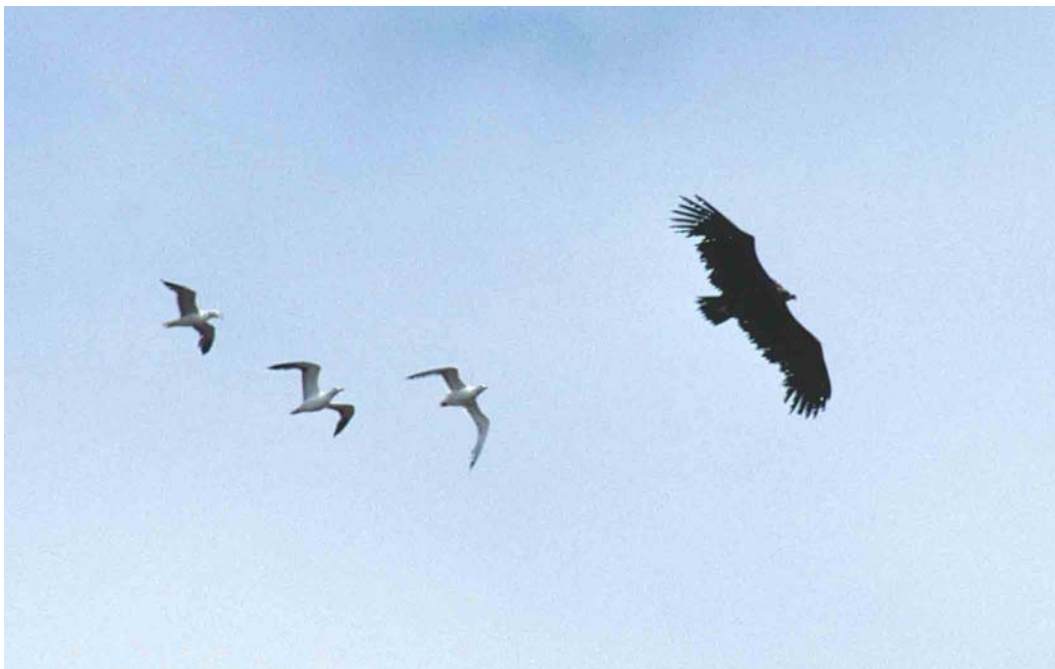
152-153 Monniksgier / Eurasian Black Vulture Aegypius monachus , onvolwassen, Maasvlakte, Zuid-Holland, 16 augustus 2000