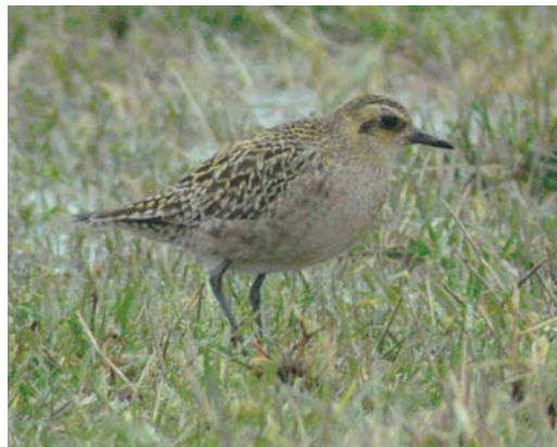
208 Vermoedelijke Toendraslechtsvalk / presumed Tundra Peregrine Falcon Falco peregrinus calidus , eerstejaars, Veerse Meer, Zeeland, 15 januari 2004 (Pim A Wolf) 209 Humes Bladkoning / Hume's Leaf Warbler Phylloscopus humei , Grou, Friesland, 4 januari 2004 (Bas van den Boogaard) 210 Amerikaanse Goudplevier / American Golden Plover Pluvialis dominica , Grijpskerke, Zeeland, 12 januari 2004 (Pim A Wolf) 211 Aziatische Goudplevier / Pacific Golden Plover Pluvialis fulva , Grijpskerke, Zeeland, 31 januari 2004 (Pim A Wolf)

KRAANVOGEL TOT ALKEN Eind februari werden weer twee Kraanvogels Grus grus gezien in de omgeving van het Fochteloërveen, Drenthe/Friesland. Eén exemplaar was op 21 februari aanwezig ten zuiden van de Lepelaarsplassen, Flevoland. Een Amerikaanse Goudplevier Pluvialis dominica die op 12 januari werd ontdekt bij Grijpskerke, Zeeland, werd daar onregelmatig gezien tot 12 februari. Op dezelfde plek werd op 14 januari aan de hand van video-opnames een Aziatische Goudplevier P. fulva ontmaskerd, die eveneens onregelmatig werd gezien tot 21 februari; slechts een enkele keer werden beide dwaalgasten tegelijkertijd waargenomen in de grote groep Goudplevieren P. apricaria . De eerste-winter Grote Grijs Snip Limnodromus scolopaceus van het Veerse Meer bleef daar tot in maart. Een Regenwulp Numenius phaeopus werd op 22 februari opgemerkt bij Yerseke. Rosse Franjepoten Phalaropus