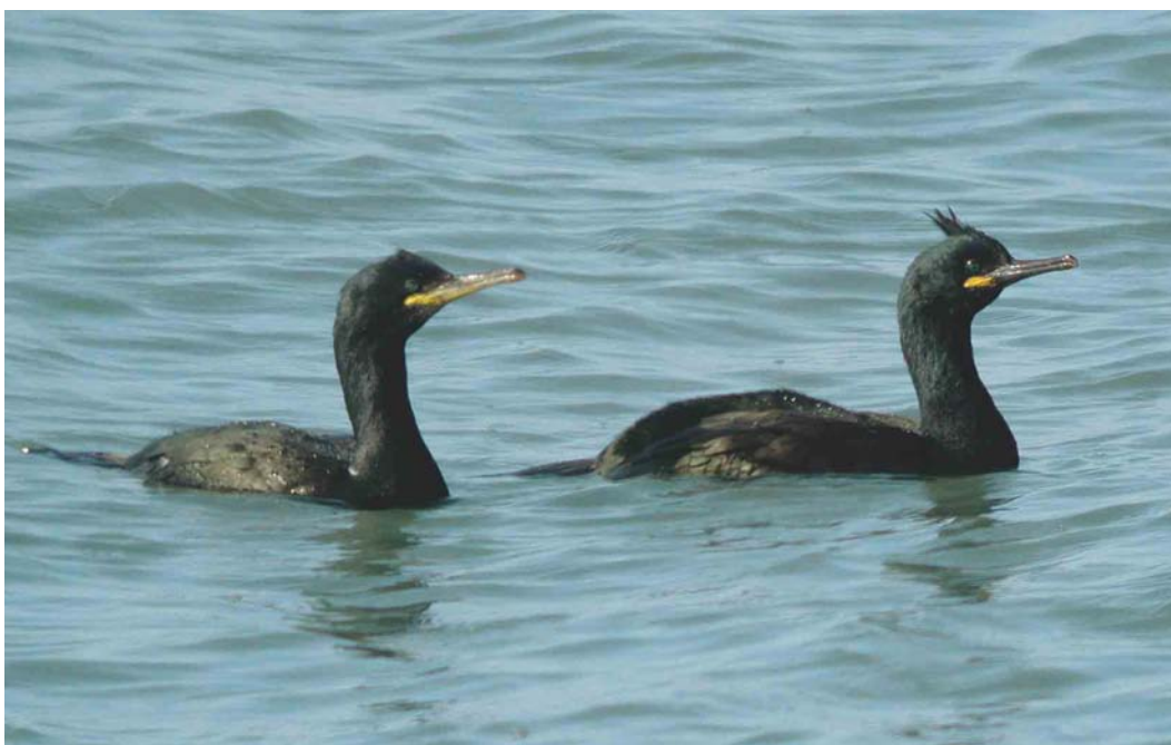
201 Kuifaalscholvers / European Shag Phalacrocorax aristotelis , adult (rechts) en tweede-zomer, Neeltje Jans, Zeeland, 1 maart 2004