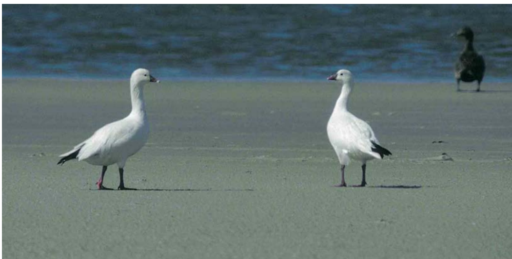
166 Ross' Ganzen / Ross's Geese Anser rossii , Rottumeroog, Groningen, 15 juni 1994. Deze twee vogels worden als ontsnapt beschouwd / these birds are considered escapes.

the Netherlands, after the first in November-December 1985. After two blank years, two Ross's Geese were seen at various sites from late 1998 until at least early 2004; both birds were seen together only once, in January 2000. These birds have been accepted as the fourth and fifth for the Netherlands. In addition, several reports have not been submitted or have been rejected because of known or suspected captive origin. Birds have mostly been associating with Barnacle Geese Branta leucopsis . This paper gives a detailed overview of all Dutch records (see table 1) and discusses the identification and status. Although the likelihood of escapes is considerable, the Dutch rarities committee (CDNA) considers Ross's Goose a possible vagrant and therefore regards records of unringed birds not showing unusual behaviour or other indications of captive origin acceptable.