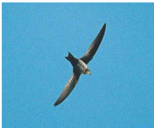
156-157 Alpengierzwaluw / Alpine Swift Apus melba , eerste-winter, Wageningen, Gelderland, november 2002

BOVENDELEN Kop, mantel en rug middelbruin, stuit en bovenstaartdekveren iets lichter grijsbruin. Veren met lichte zoom; schacht en subterminale rand donkerder bruin (ankerpatroon vormend).