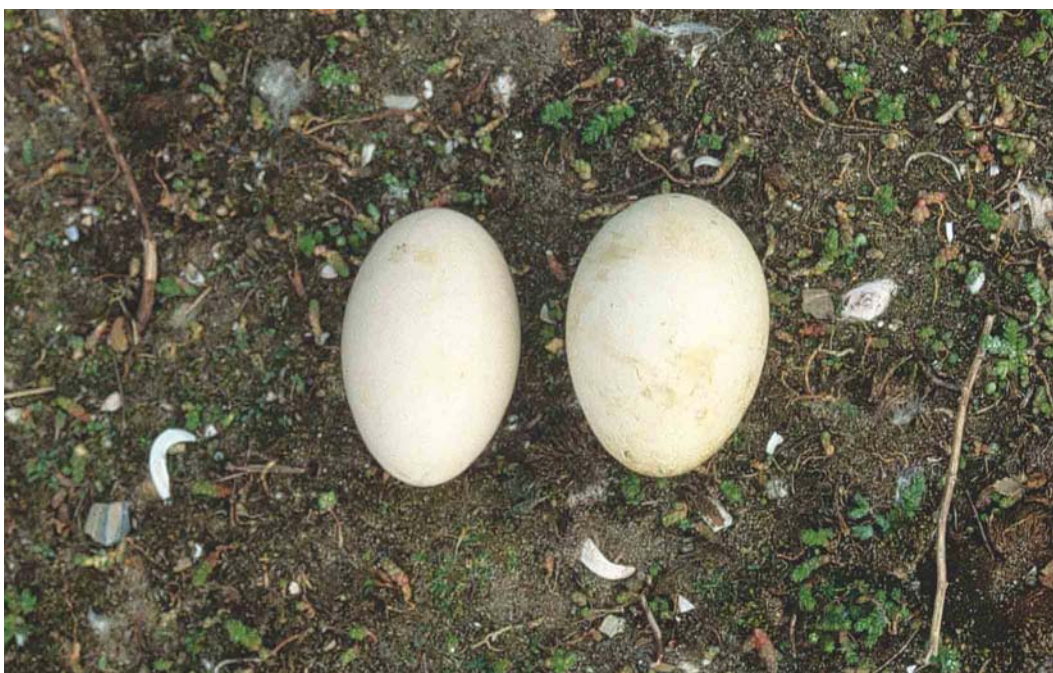
170 Eieren van Ross' Gans / Ross's Goose Anser rossii (links) en Brandgans / Barnacle Goose B leucopsis (rechts), Slijkplaat, Haringvliet, Zuid-Holland, 2 juni 2003 (Peter L Meiningen)