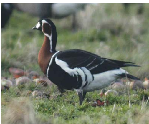
204 Zwarte Rotganzen / Black Brants Branta nigricans , adult (rechts) en juveniel, Yerseke, Zeeland, 1 februari 2004 (Marten van Dijk) 205 Ross' Gans / Ross's Goose Anser rossii , Yerseke, Zeeland, 8 maart 2004 (Marten van Dijk) 206 Brilzee-eend / Surf Scoter Melanitta perspicillata , eerste-winter mannetje, Brouwersdam, Zeeland, 27 januari 2004 (Pim A Wolf) 207 Roodhalsgans / Red-breasted Goose Branta ruficollis , juveniel, Yerseke, Zeeland, 24 januari 2004 (Marten van Dijk)

bij Den Oever, Noord-Holland. Er werden weinig Kleine Zilverreigers Egretta garzetta doorgegeven. Bewijzen voor hun aanwezigheid zijn slaapplaatstellingen van 13 op 3 januari op de Schelphoek bij Serooskerke, Zeeland, en acht op 4 februari bij het Veerse Bos, Zeeland. Grote Zilverreigers Casmerodius albus waren talrijker. Her en der werden groepen van wel 20 gezien en een slaapplaatstelling op 20 februari bij de Nieuwkoopse Plassen, Zuid-Holland, leverde 50 exemplaren op. Naar schatting is de Nederlandse winterpopulatie inmiddels de 300 genaderd (of reeds overstegen). Rode Wouwen Milvus milvus vlogen op 3 januari ten westen van Breda, Noord-Brabant, op 20 februari bij Burgh-Haamstede, Zeeland, op 25 februari langs de Praamweg, Flevoland, en op 29 februari bij Gendringen, Gelderland. Gedurende langere tijd ver-