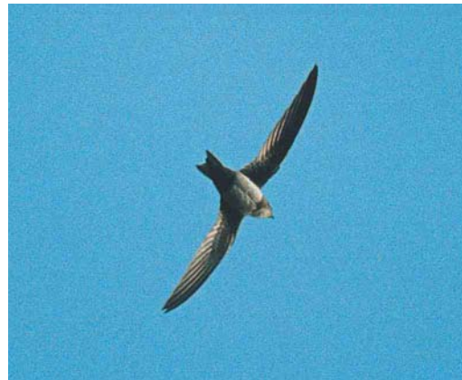
156-157 Alpengierzwaluw / Alpine Swift Apus melba , eerste-winter, Wageningen, Gelderland, november 2002

BOVENDELEN Kop, mantel en rug middelbruin, stuit en bovenstaartdekveren iets lichter grijsbruin. Veren met lichte zoom; schacht en subterminale rand donkerder bruin (ankerpatroon vormend).