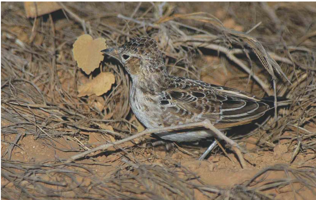
197 Raso Lark / Razoleeuwerik Alauda razae , juvenile, Raso, Cape Verde Islands, 13 February 2004