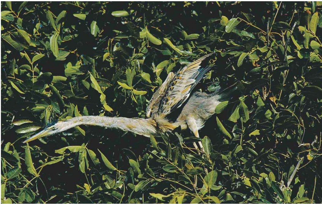
196 Bourne's Heron / Kaapverdise Purperreiger Ardea bournei , immature, Santiago, Cape Verde Islands, 10 March 2004