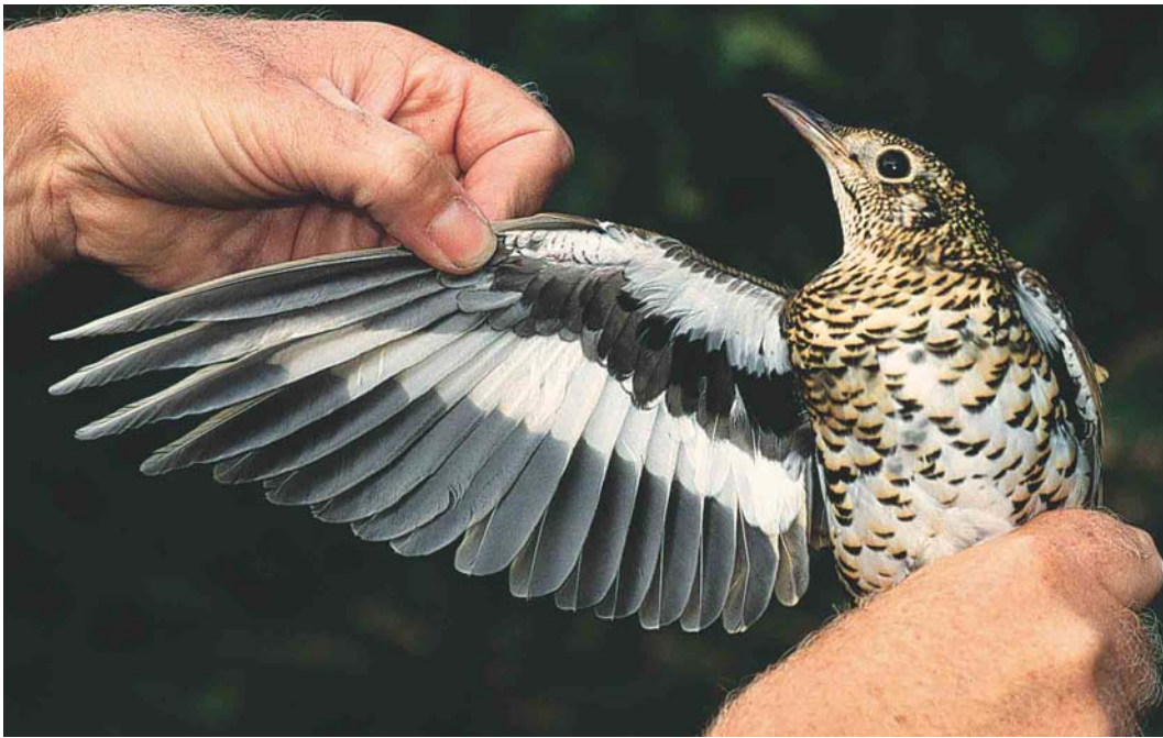
497 Goudlijster / White's Thrush Zosterops lateralis , Korverskooi, Texel, Noord-Holland, 10 oktober 2003