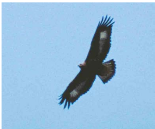
410 Golden Eagle / Steenarend Aquila chrysaetos , juvenile, Norg, Drenthe, 11 March 2002

Fochteloërveen, Drenthe/Friesland, and Hoge Veluwe, Gelderland, prove to be very attractive sites for this species. At Hoge Veluwe, there were records in 1996 (two) and 1997 (one), involving at least two birds, while at Fochteloërveen the species was recorded in 2001 (two)