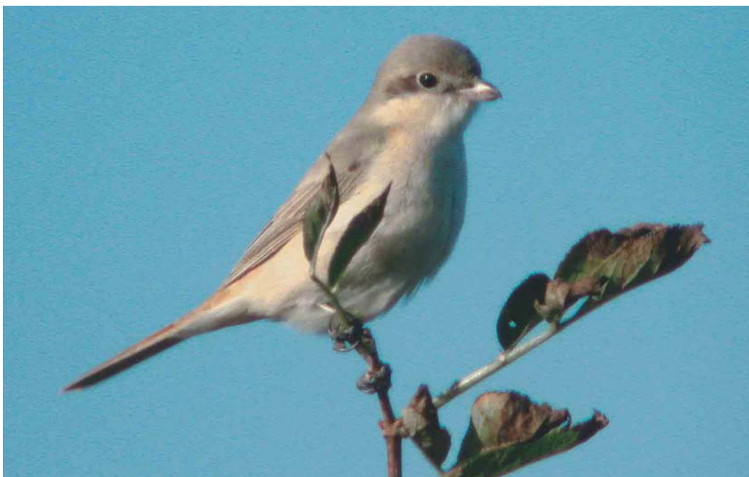
495 Daurische Klauwier / Daurian Shrike Lanius isabellinus , Texel, Noord-Holland, 25 september 2003