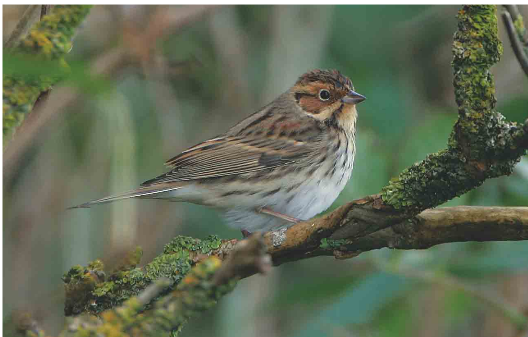
502 Dwerggors / Little Bunting Emberiza pusilla , Texel, Noord-Holland, 5 oktober 2003 (Bas van den Boogaard)