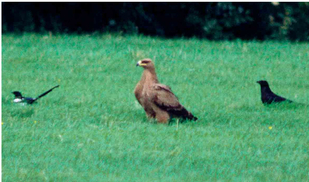
412 Steppe Eagle / Stepparend Aquila nipalensis , immature, with Eurasian Magpie / Ekster Pica pica and Carrion Crow / Zwarte Kraai Corvus corone , Verdeek, Noord-Holland, 31 May 1998