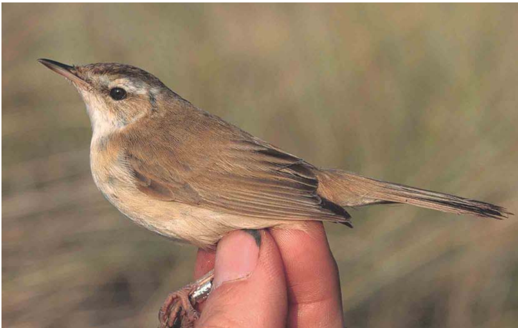
498 Veldrietzanger / Paddyfield Warbler Acrocephalus paludicola , adult, Castricum, Noord-Holland, 2 oktober 2003 (Arnold Wijker)