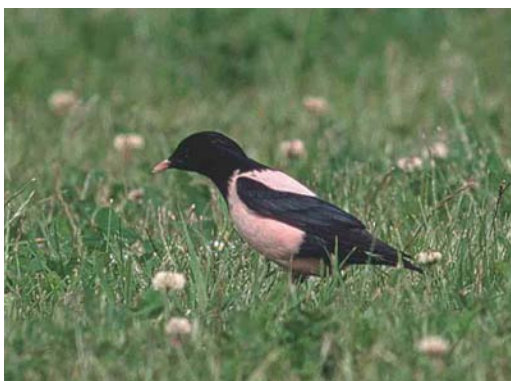
436 Roze Spreeuw / Rose-coloured Starling Sturnus roseus , adult, Eemshaven, Groningen, 14 juni 2002 (Eric Koops)