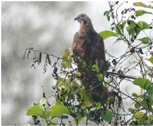
441 Crested Honey Buzzard / Aziatische Wespendiff Pernis ptilorhyncus , adult male, Goa, India, March 2002

dered by a dark line, can be seen. Sometimes, as in this bird, a central throat-line is present, too. A feature that supports the sexing as a male is the grey head with a dark eye (females show a pale iris). The blue cere supports the ageing as an adult.