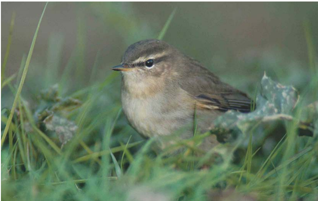
500 Bruine Boszanger / Dusky Warbler Phylloscopus fuscatus , Maasvlakte, Zuid-Holland, 24 oktober 2003 (Marten van Dijk)