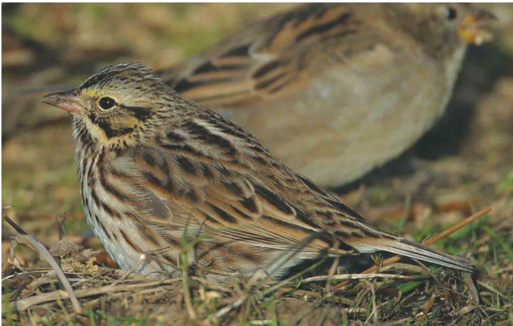
484 Savannah Sparrow / Savannahgors Passerculus sandwichensis , Fair Isle, Shetland, Scotland, October 2003