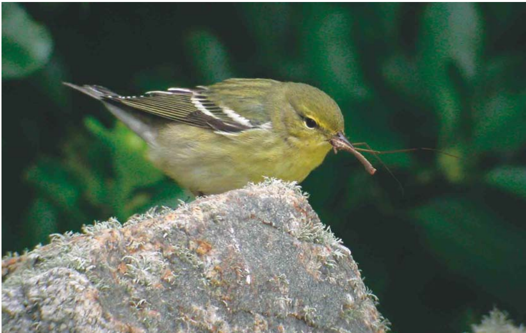
476 Blackpoll Warbler / Zwartkopzanger Dendroica striata , Ouessant, Finistère, France, October 2003