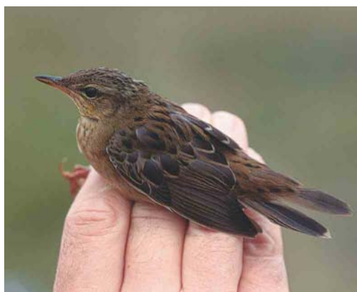
454 White-headed Duck / Witkopeend Oxyura leucocephala , first-winter, Rieselfelder Münster, Nordrhein-Westfalen, Germany, 24 September 2003 455 Steppe Eagle / Stepparend Aquila nipalensis , Falsterbo, Skåne, Sweden, 13 October 2003 456 American Golden Plover / Amerikaanse Goudplevier Pluvialis dominica , Swords Estuary, Dublin, Ireland, 19 September 2003 457 American Golden Plover / Amerikaanse Goudplevier Pluvialis dominica , Sandwick, Shetland, Scotland, September 2003 458 Short-billed Dowitcher / Kleine Grijsze Snip Limnodromus griseus , Terceira, Azores, 26 October 2003 459 Pallas's Grasshopper Warbler / Siberische Sprinkhaanzanger Locustella certhiola , Castricum, Noord-Holland, Netherlands, 12 September 2003