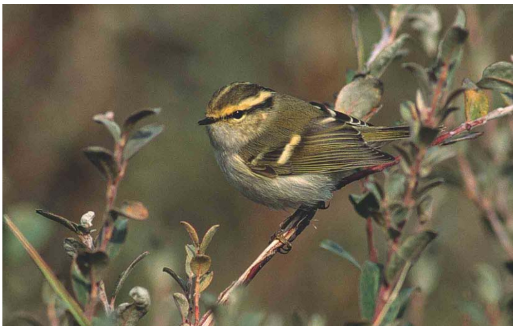
501 Pallas' Boszanger / Pallas's Leaf Warbler Phylloscopus proregulus , De Cocksdorp, Texel, Noord-Holland, 13 oktober 2003 (Eric Koops)