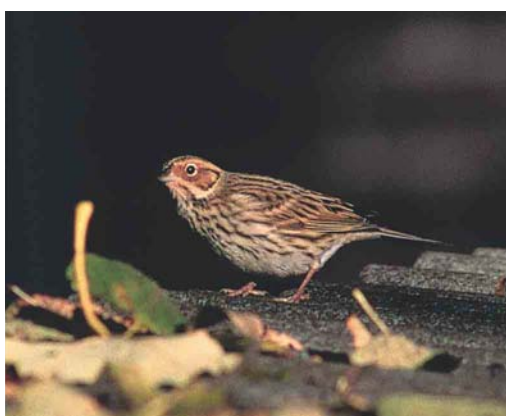
503 Struikrietzanger / Blyth's Reed Warbler Acrocephalus dumetorum , Stortemelk, Vlieland, Friesland, 30 september 2003 504 Provençaalse Grasmus / Dartford Warbler Sylvia undata , Texel, Noord-Holland, 13 oktober 2003 505 Veldrietzanger / Paddyfield Warbler Acrocephalus paludicola , Groene Glop, Schiermonnikoog, Friesland, 6 september 2003 506 Humes Bladkoning / Hume's Leaf Warbler Phylloscopus humei , Kroonspolders, Vlieland, Friesland, 22 oktober 2003 507 Groenlandse Witstuitbarmsijs / Hornemann's Redpoll Carduelis hornemanni hornemanni , Huisduinen, Noord-Holland, 15 oktober 2003 508 Dwerggors / Little Bunting Emberiza pusilla , Groningen, Groningen, 26 oktober 2003