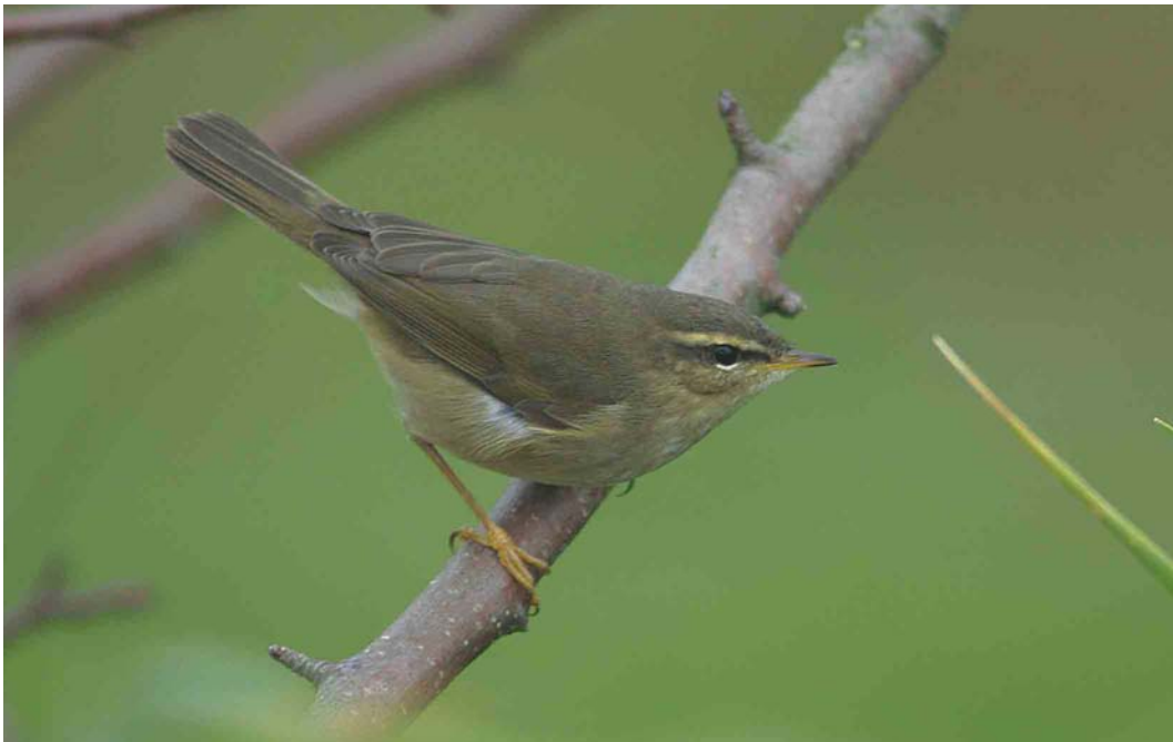
499 Bruine Boszanger / Dusky Warbler Phylloscopus fuscatus , Driel, Gelderland, 26 oktober 2003 (Patrick Palmen)