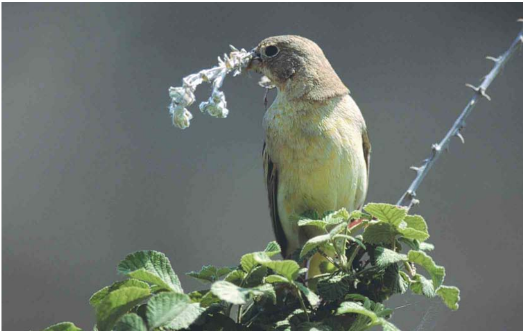
440 Black-headed Bunting / Zwartkopgors Emberiza melanocephala , female, Lesvos, Greece, April 2001

Red-headed these are more buffish. The feathers of the mystery bird are a few months old and most are buffish, but note that the median coverts show almost white fringes, which is again in favour for Black-headed. In all plumages, there is a slight difference between both species in primary projection. In Red-headed, this is c 60%, with four to five visible primary tips. In Black-headed, the primary projection is c 70%, with five to six visible primary tips. Although it is hard to judge from the mystery photograph, there are five and maybe even six visible primary tips, indicating Black-headed. The absence of white in the tail supports the identification as Black-headed, which probably never shows white in the tail, while Red-headed may show some white, albeit rarely.