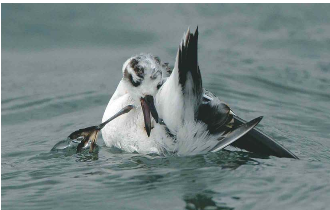
494 Rosse Franjepoot / Red Phalarope Phalaropus fulicarius , Brouwersdam, Zeeland, 11 oktober 2003 ( Bas van den Boogaard )