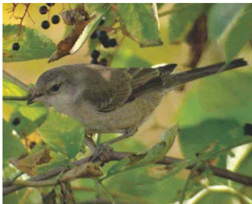
518 Sperwergrasmus / Barred Warbler Sylvia nisoria , Heist, West-Vlaanderen, 16 september 2003

7 september over Kortrijk, West-Vlaanderen; op 11 september werden er drie waargenomen in Tienen, Vlaams-Brabant, op 22 september één in Gentbrugge, Oost-Vlaanderen, en op 25 september acht in Turnhout, Antwerpen. De laatste Zwarte Ooievaars Ciconia nigra werden gezien in Lier op 6 september (juвениel); in Torgny, Luxembourg, op 7 september; in Chaumont-Gistoux, Brabant-Wallon, zes op 13 september; en in Knokke op 13 september. Op 20 oktober pleisterde een groep van 18 Ooievaars C. ciconia in Berendrecht, Antwerpen.