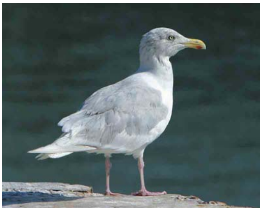
517 Grote Burgemeester / Glaucous Gull Larus hyperboreus , Oostende, West-Vlaanderen, 18 september 2003