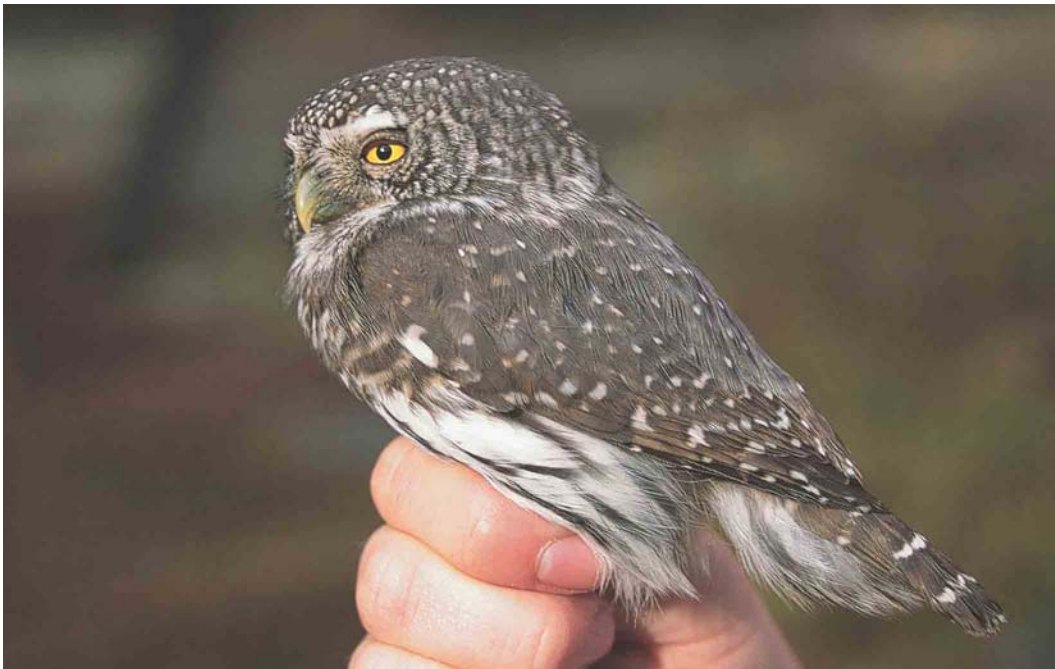
446 Eurasian Pygmy Owl / Dwerguil Glaucidium passerinum , Sükajoki, Finland, 1 October 2003