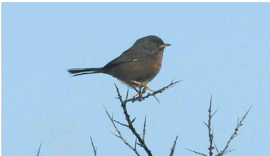
520 Provençaalse Grasmus / Dartford Warbler Sylvia undata , Texel, Noord-Holland, 13 oktober 2003

gesneld. In totaal c 50 vogelaars hebben de vogel tot in de middag kunnen bekijken, met als bonus een roepende Bladkoning Phylloscopus inornatus over de duinen waar de grasmus verbleef en twee Pallas' Boszangers P proregulus in de bosjes langs het wandelpad. De grasmus verbleef na de ontdekking meestal in enkele lage bosjes in de duinen maar liet zich later in de middag steeds minder frequent zien en uiteindelijk bleek een zoekactie zelfs negatief. Enkele dagen later, op 17 oktober, werd echter door Kees Roselaar wederom een Provençaalse Grasmus gezien in de Tuintjes, waarbij aangenomen mag worden dat dit hetzelfde exemplaar betrof. Het stiekeme gedrag van deze soort maakt het voorstelbaar dat een exemplaar dagenlang zoek is, zelfs op een door vogelaars veel bezochte locatie.