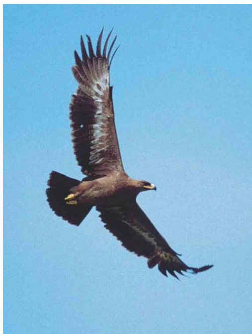
411 Steppe Eagle / Stepparend Aquila nipalensis , immature, Verdeek, Noord-Holland, 31 May 1998

This juvenile was only the third to be twitchable after the long-staying individuals in 1978-79 and 1980-81.