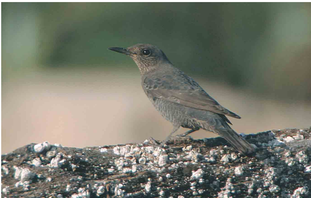
496 Blauwe Rotslijster / Blue Rock Thrush Monticola solitarius , Westkapelle, Zeeland, 20 september 2003 (Bas van den Boogaard)