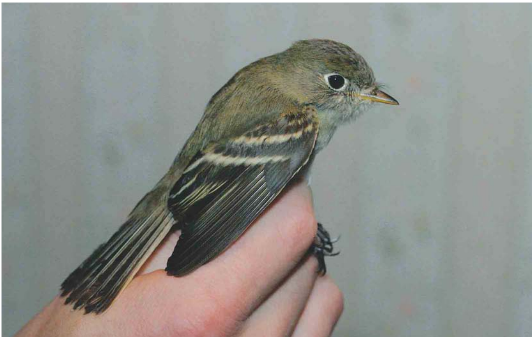
461 Least Flycatcher / Kleine Feetiran Empidonax minimus , Stokkseyri, Iceland, 6 October 2003 (Jóhann Óli Hilmarsson)