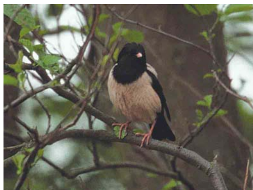
437 Roze Spreeuw / Rose-coloured Starling Sturnus roseus , adult, Lies, Terschelling, Friesland, 3 juni 2002

plaatsing in noordwestelijke richting die vaak pas aan kusten stopte. In dat licht bezien is de eerste waarneming van een Roze Spreeuw voor Zuid-Korea, een juveniele op het eiland Eocheong op 1 september 2002, opmerkelijk (Moores 2002) en een aanwijzing dat dispersie in meerdere richtingen plaats kan vinden.