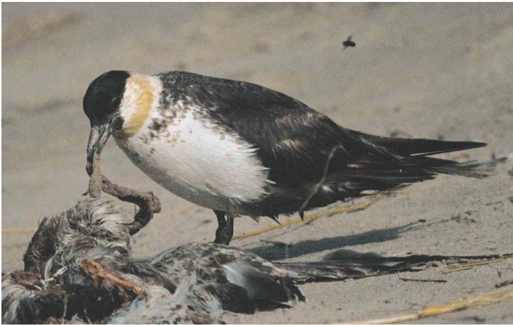
493 Middelste Jager / Pomarine Jaeger Stercorarius pomarinus , Brouwersdam, Zeeland, 10 oktober 2003 ( Vincent van der Spek )