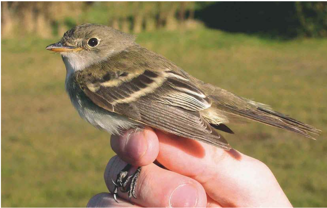
460 Alder Flycatcher / Elzenfeetiran Empidonax alnorum , Kverkin, Eyjafjöll, Iceland, 10 October 2003