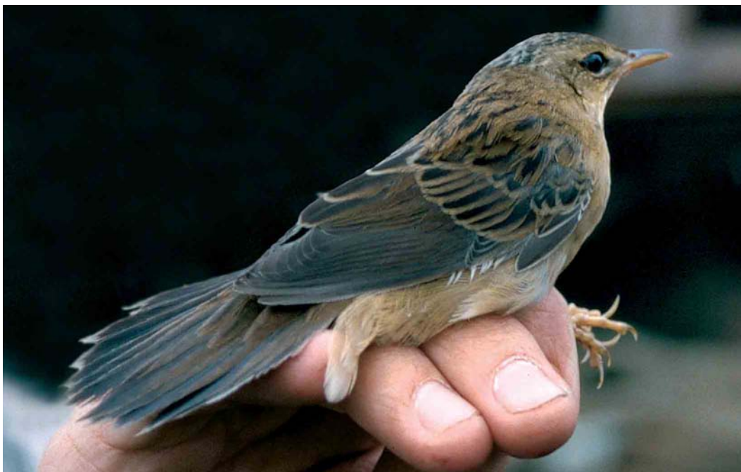
427 Pallas's Grasshopper Warbler / Siberische Sprinkhaanzanger Locustella certhiola , first-winter, Castricum, Noord-Holland, 21 September 2002 (Rienk Slings)