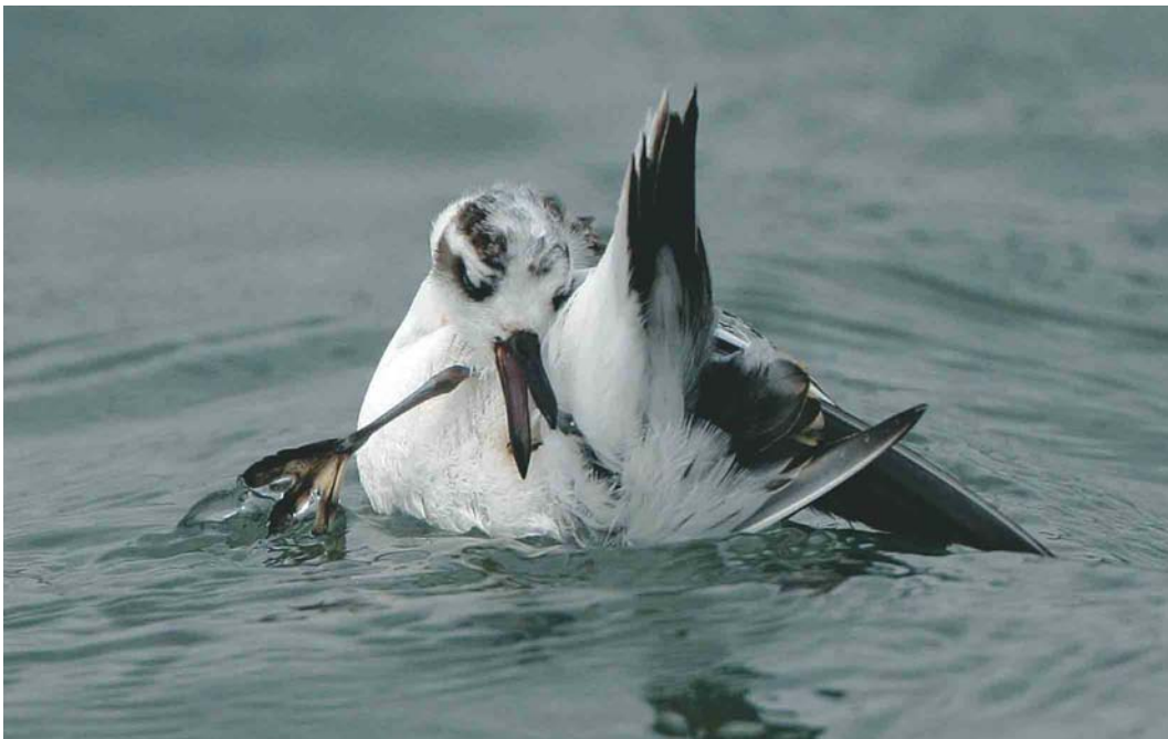
494 Rosse Franjepoot / Red Phalarope Phalaropus fulicarius , Brouwersdam, Zeeland, 11 oktober 2003