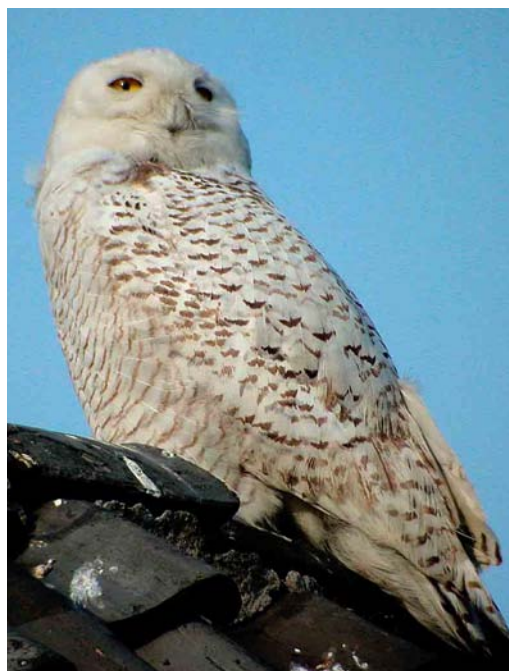
422-423 Snowy Owl / Sneeuwuil Nyctea scandiaca , first-winter male, Hippolytushoef, Noord-Holland, 19 April 2002