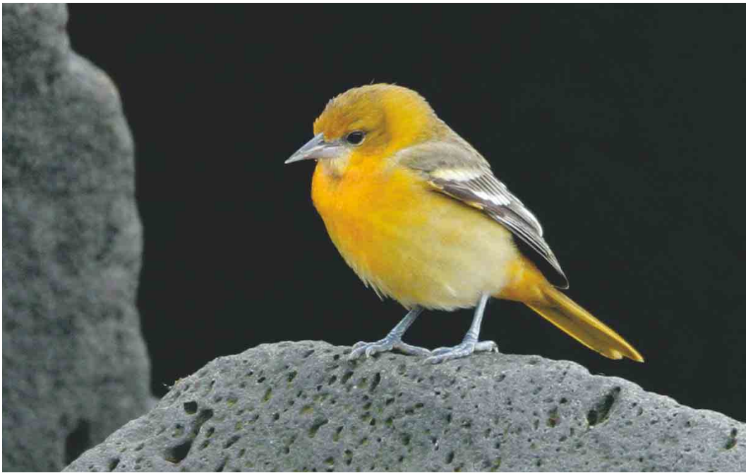
483 Baltimore Oriole / Baltimoretroepiaal Icterus galbula , first-year male, Eyrarbakki, Iceland, 8 October 2003 (Daniél Bergmann)