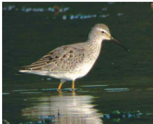
448 American Wigeon / Amerikaanse Smient Mareca americana , female or first-winter, Sete Cidades, Lagoa Azul, São Miguel, Azores, 31 October 2003 ( Kris De Rouck ) 449 Greenland White-fronted Goose / Groenlandse Kolgans Anser albifrons flavirostris , Ouessant, Finistère, France, 12 October 2003 ( Kris de Rouck ) 450 Cory's Shearwater / Kuhls Pijlstormvogel Calonectris borealis , Gdansk, Poland, 20 August 2003 ( P Zielinski ) 451 Crab Plovers / Krabplevieren Dromas ardeola , Hamata mangroves, Egypt, 17 September 2003 ( Kris De Rouck ) 452 Wilson's Phalarope / Grote Franjepoot Phalaropus tricolor , Kilcoole, Wicklow, Ireland, 3 October 2003 ( Paul Kelly ) 453 Stilt Sandpiper / Steltstrandloper Micropalama himantopus , Burnham Wood Lagoon, Dingle, Kerry, Ireland, 17 September 2003 ( Michael O'Keefe )