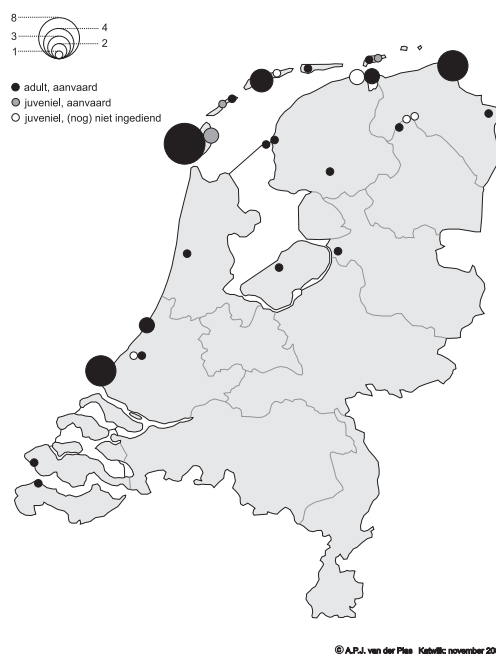
FIGUUR 1 Verspreiding van Roze Spreeuwen Sturnus roseus in Nederland in 2002 / Distribution of Rose-coloured Starlings in the Netherlands in 2002

schieters' vanuit de wintergebieden, zowel adulte als eerste-zomer vogels; 2 in juli en augustus vindt dispersie plaats vanuit de (Oost-Europese) broedgebieden; hierbij gaat het om adulte en juveniele vogels; 3 van eind augustus tot en met september (soms oktober) trekken de vogels naar de overwinteringsgebieden; waarnemingen in West-Europa hebben dan meestal betrekking op juveniele vogels. Deze dispersie en trek vinden overigens gescheiden per leeftijdsgroep plaats, waarbij de adulte beduidend eerder wegtrekken dan de juveniele (Feare & Craig 1999). Figuur 2 geeft het verloop van de invasie in de periode juni-oktober 2002 per decade weer. Hieruit blijkt dat het patroon voor een belangrijk deel overeenkomt met bovengenoemde fasen, al lag de nadruk in 2002 duidelijk op de eerste decade van juni. Vier waarnemingen hadden betrekking op meer dan één adult(-type) vogel: drie keer werden twee adulte of eerste-zomers samen waargenomen, alle in de eerste dagen van de invasie: twee in de Eemshaven, Groningen, op 3 juni, twee op Texel, Noord-Holland, op 3 juni en twee op de Maasvlakte, Zuid-Holland, op 8 juni. Daarnaast werden van 9 tot 11 september in Lauwersoog, Groningen, twee adult-type en twee juveniele