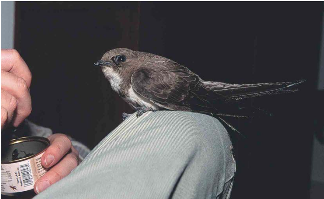
425 Alpine Swift / Alpengierzwaluw Apus melba , first-winter (taken into care at Wageningen, Gelderland, on 4 December 2002), Bennekom, Gelderland, 5 January 2003