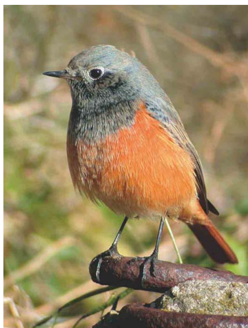
511 Roze Spreeuw / Rose-coloured Starling Sturnus roseus , juveniel, met Spreeuwen / Common Starlings S vulgaris , IJmuiden, Noord-Holland, 17 september 2003 (Marten van Dijl) 512 Oosterse Zwarte Roodstaart / Eastern Black Redstart Phoenicurus ochruros phoenicuroides , eerstejaars mannetje, IJmuiden, Noord-Holland, 23 oktober 2003 (Leo J R Boon/Cursorius) 513 Roze Spreeuw / Rose-coloured Starling Sturnus roseus , juveniel, 't Horntje, Texel, Noord-Holland, 16 oktober 2003 (Ben Gaxiola)