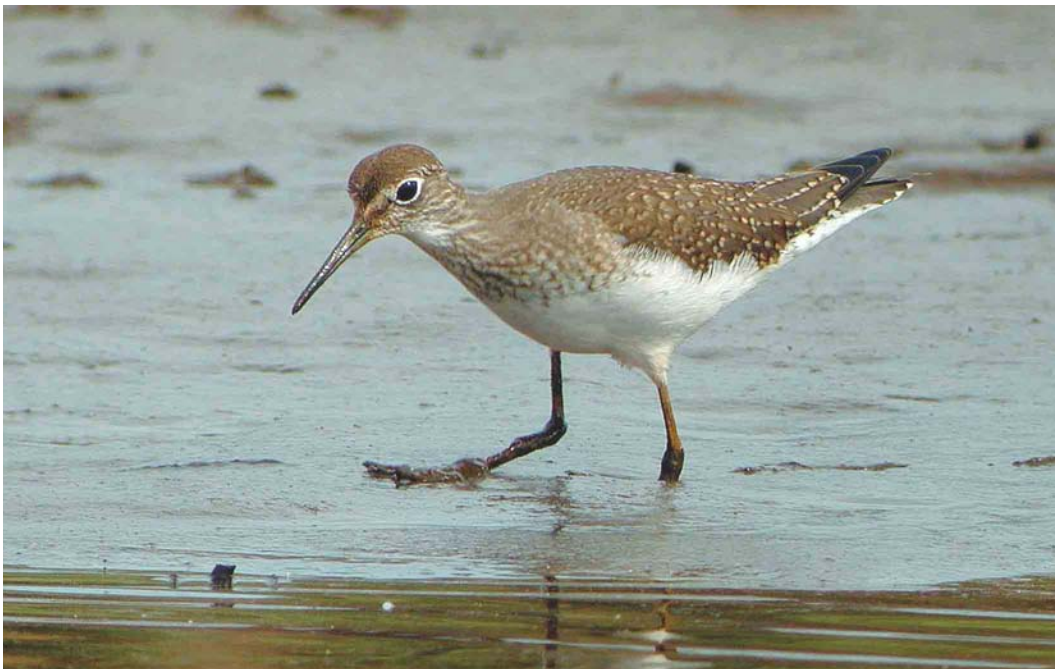
444 Solitary Sandpiper / Amerikaanse Bosruiter Tringa solitaria , Ouessant, Finistère, France, September 2003 (Aurélien Audevard)