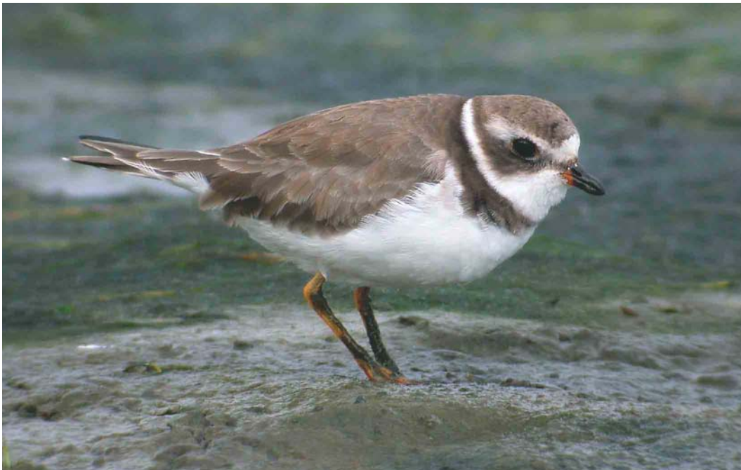
443 Semipalmated Plover / Amerikaanse Bontbekplevier Charadrius semipalmatus , Terceira, Azores, 27 October 2003 (Kris De Rouck)