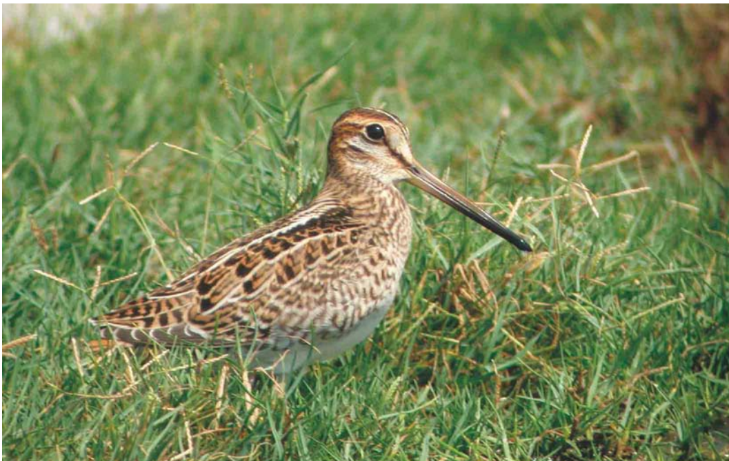
447 Probable Pintail Snipe / waarschijnlijke Stekelstaartsnip Gallinago stenura , Kfar Ruppim, Israel, September 2003 (James P Smith)