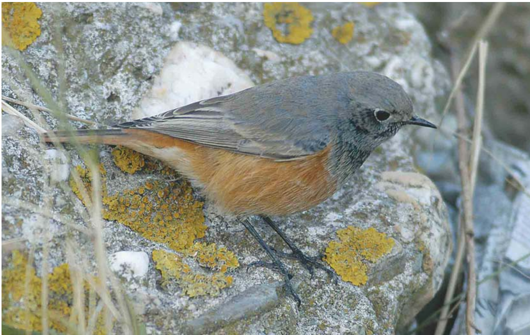
488 Eastern Black Redstart / Oosterse Zwarte Roodstaart Phoenicurus ochruros phoenicuroides , first-year male, IJmuiden, Noord-Holland, Netherlands, 23 October 2003