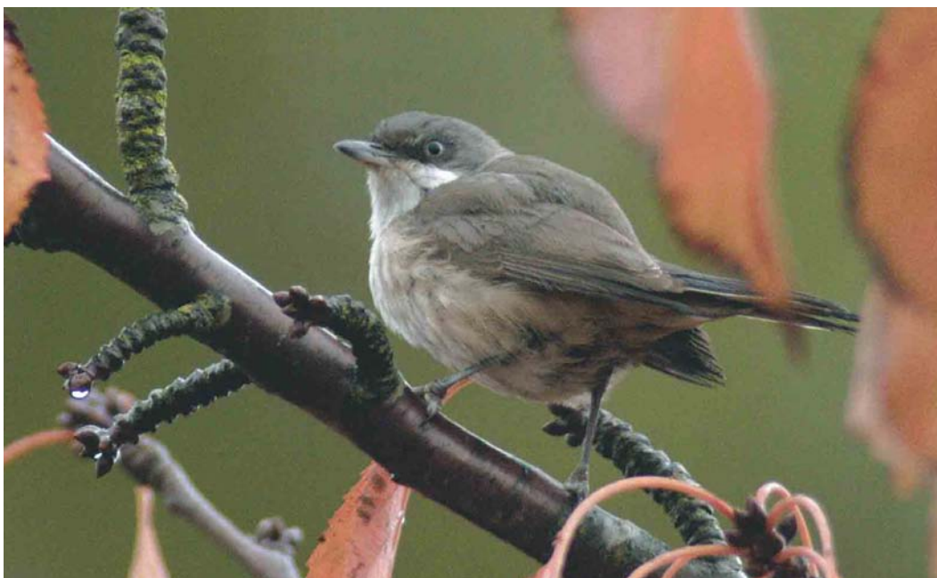
522 Vermoedelijke Westelijke Orpheusgrasmus / presumed Western Orphean Warbler Sylvia hortensis , Middelburg, Zeeland, 30 oktober 2003

mannetje gevangen. Dit exemplaar overleefde nog drie weken in een kooi, waarna het werd opgezet. Op basis van de in 1913 gepubliceerde foto lijkt het om een Westelijke Orpheusgrasmus te gaan. In Brittannië zijn zes gevallen bekend: één in mei, één in juli en vier tussen 20 september en 22 oktober, waarvan slechts één twitchbaar (op Scilly, Engeland, in oktober 1981). In Duitsland werd op 1 september 1964 een adult vrouwtje gevangen op Helgoland, Schleswig-Holstein, en werden opmerkelijk genoeg van 19 juli tot 13 augustus 2003 twee zingende mannetjes Westelijke Orpheusgrasmus waargenomen in Baden-Württemberg (Dutch Birding 25: 343, 2003).