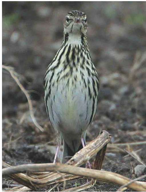
462 Alder Flycatcher / Elzenfeetiran Empidonax alnorum , Kverkin, Eyjafjöll, Iceland, 10 October 2003 463-464 Pechora Pipit / Petsjorapieper Anthus gustavi , Fair Isle, Shetland, Scotland, October 2003