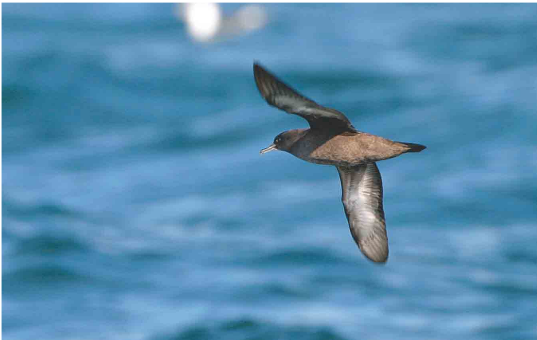
492 Grauwe Pijlstormvogel / Sooty Shearwater Puffinus griseus , Noordzee ten noorden van Ameland, Continentaal Plat, 21 september 2003