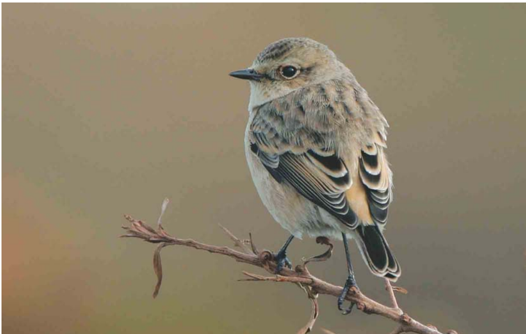
469 Siberian Stonechat / Aziatische Roodborstapuit Saxicola maura , Helgoland, Schleswig-Holstein, Germany, 17 October 2003