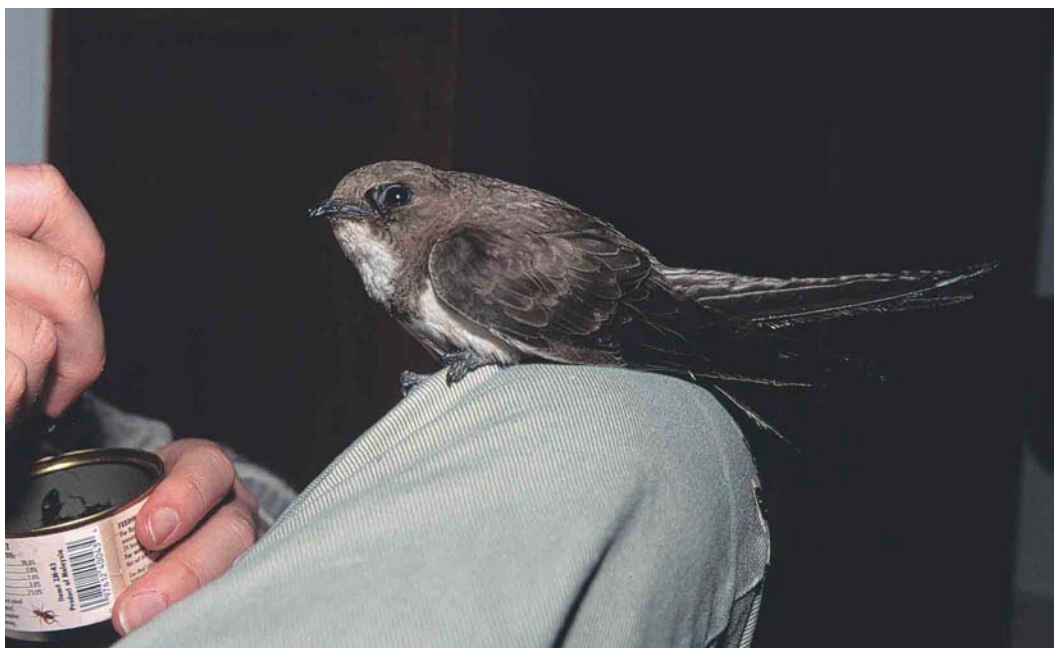
425 Alpine Swift / Alpengierzwaluw Apus melba , first-winter (taken into care at Wageningen, Gelderland, on 4 December 2002), Bennekom, Gelderland, 5 January 2003 (Marten van Dijl)