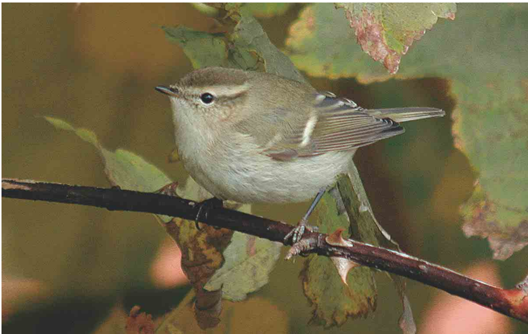
489 Hume's Leaf Warbler / Humes Bladkoning Phylloscopus humei , Gibraltar Point, Lincolnshire, England, 26 October 2003 ( Graham Catley )