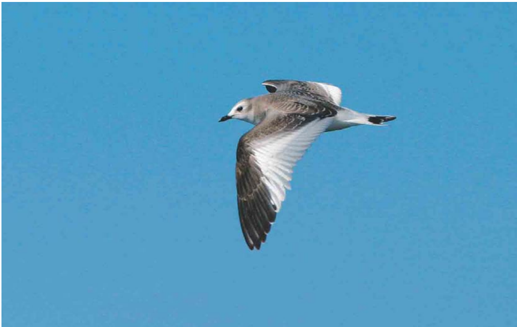
491 Vorkstaartmeeuw / Sabine's Gull Larus sabini , juveniel, Noordzee ten noorden van Ameland, Continentaal Plat, 21 september 2003 ( Bas van den Boogaard )