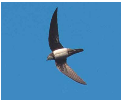
424 Alpine Swift / Alpengierzwaluw Apus melba , first-winter, Wageningen, Gelderland, 17 November 2002

The autumn bird was released near Zürich in Switzerland in June 2003. It was only the second ever staying longer than a few hours. The first 'long-staying' bird was on 28-29 October 1987. A report on 7 September at Ooltgensplaat, Zeeland, is still in circulation, while a report on 20 September on Terschelling, Friesland, has not (yet) been submitted (cf van Dongen et al 2002).