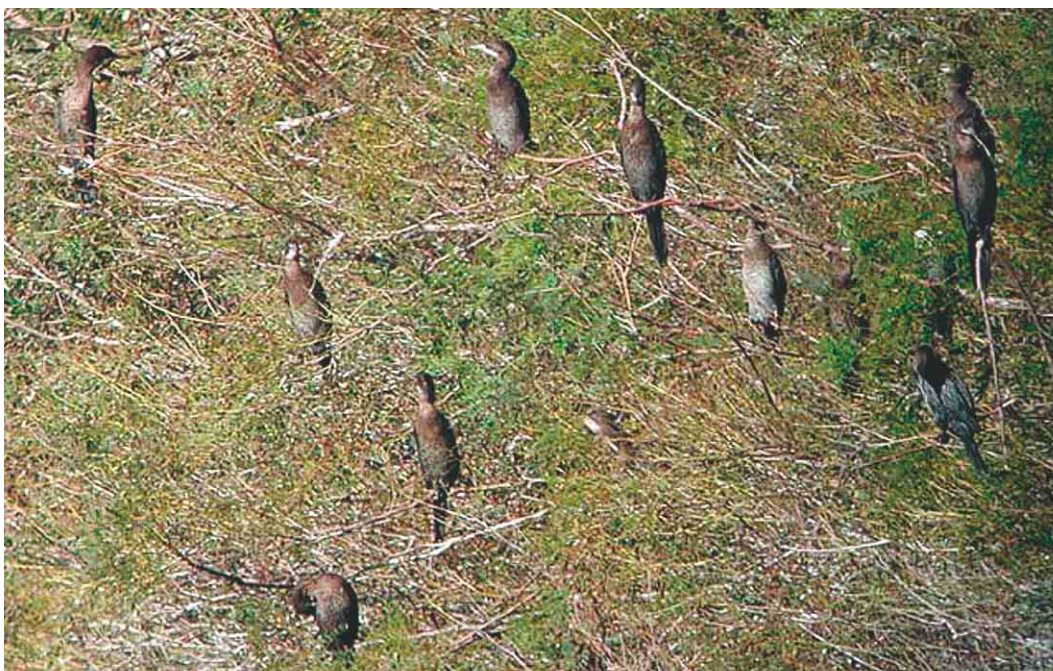
445 Pygmy Cormorants / Dwergaalscholvers Microcarbo pygmeus , Po delta, Italy, 29 September 2003

ber and 30 October, respectively. Between 15 August and 11 October, five Cory's Shearwaters Calonectris borealis were seen off southern Sweden. The first for Estonia was at Rista on 18 August. The third for Poland stayed for two hours at c 75 m distance at the Wisla river mouth, Bay of Gdansk, on 20 August. On 7-11 October, there were six sightings off north-western Germany. On 8 October, one was seen off Texel, Noord-Holland, the Netherlands. The first Sooty Shearwater Puffinus griseus for Switzerland was flying over Bodensee at Triboltingen on 8 October and was mostly seen on the German side of the lake. A record 1400 Pygmy Cormorants Microcarbo pygmeus were counted at a single nocturnal roost in the Po delta in the northern inner lagoons south of Venice, Italy, on 25 September (there are also one or two roosts north of Venice). The first successful breeding of Sacred Ibis Threskiornis aethiopicus for the Netherlands occurred in Utrecht this summer (semi-wild populations have been established in France since 1991). Three individuals of a group of 10 juvenile Eurasian Spoonbills Platalea leucorodia on Corvo, Azores, from 8 October had been colour-ringed in the Netherlands in 2003 on 18 May (female) and 7 June (male) on Schiermonnikoog, Friesland, and on 13 June (female) at Markiezaat, Noord-Brabant; on 10 October, the flock had moved to Flores where five were found dead on 20 October (including the colour-ringed male).