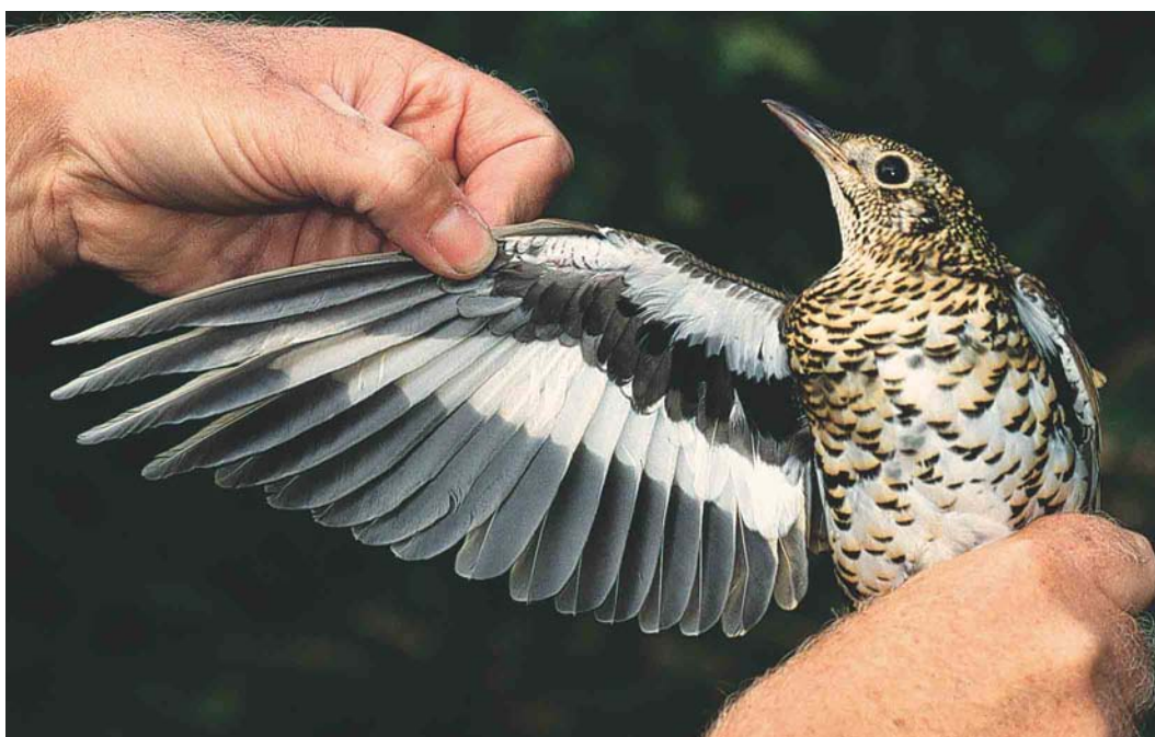
497 Goudlijster / White's Thrush Zosterops lateralis , Korverskooi, Texel, Noord-Holland, 10 oktober 2003 (Arend Wassink)