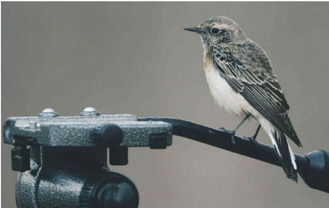
468 Pied Wheatear / Bonte Tapuit Oenanthe pleschanka , Helgoland, Schleswig-Holstein, Germany, 19 October 2003 ( Bas van den Boogaard )