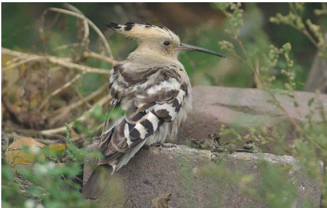
510 Hop / Eurasian Hoopoe Upupa epops , De Cocksdorp, Texel, Noord-Holland, 28 september 2003