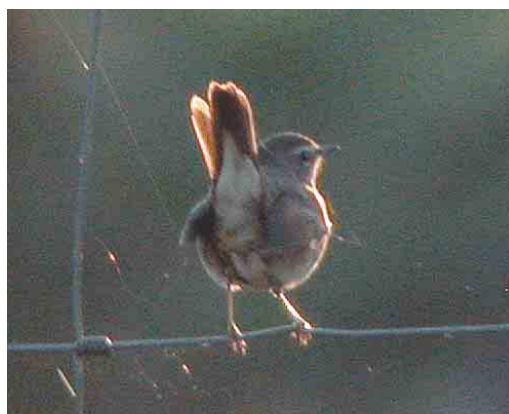
470 Booted Warbler / Kleine Spotvogel Acrocephalus caligatus , Tory Island, Donegal, Ireland, 27 September 2003 (Paul Kelly) 471 Steppe Grey Shrike / Steppeklapekster Lanius pallidirostris , Kfar Ruppim, Israel, 3 October 2003 (James P Smith) 472 Cedar Waxwing / Cederpestvogel Bombycilla cedrorum , Heimaey island, Vestmannaeyjar, Iceland, 8 October 2003 (Yann Kolbeinsson) 473 Common Yellowthroat / Maskerzanger Geothlypis trichas , Loop Head, Clare, Ireland, 4 October 2003 (Paul Kelly) 474 Siberian Rubythroat / Roodkeelnachtegaal Luscinia calliope , Fair Isle, Shetland, Scotland, October 2003 (Hugh Harrop/Shetland Wildlife) 475 Siberian Rubythroat / Roodkeelnachtegaal Luscinia calliope , Fair Isle, Shetland, Scotland, 17 October 2003 (Chris Batty)