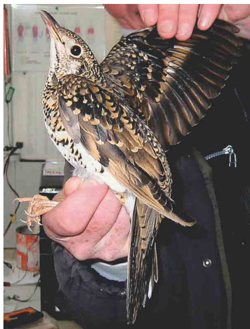
465 Taiga Flycatcher / Taigavliegenvanger Ficedula albicilla , first-year, Dales Lea, Shetland, Scotland, October 2003 466 White's Thrush / Goudlijster Zoothera aurea , Korverskooi, Texel, Noord-Holland, Netherlands, 10 October 2003 467 Grey-cheeked Thrush / Grijswangdwerglijster Catharus minimus (right), with Song Thrush / Zanglijster Turdus philomelos , Tresco, Scilly, England, October 2003