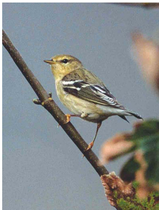
478 Black-throated Blue Warbler / Blauwe Zwartkeelzanger Dendroica caerulescens , adult female, Heimaey, Vestmannaeyjar, Iceland, 17 October 2003 ( Daniél Bergmann ) 479 Blackpoll Warbler / Zwartkopzanger Dendroica striata , Ouessant, Finistère, France, 14 October 2003 ( Arie Ouwerkerk ) 480 Black-throated Blue Warbler / Blauwe Zwartkeelzanger Dendroica caerulescens , adult female, Heimaey, Vestmannaeyjar, Iceland, 17 October 2003 ( Daniél Bergmann )