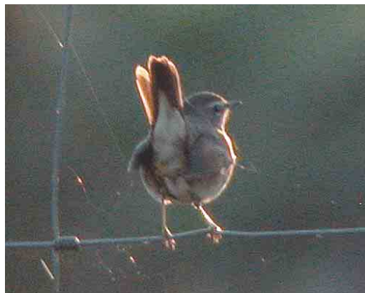
470 Booted Warbler / Kleine Spotvogel Acrocephalus caligatus , Tory Island, Donegal, Ireland, 27 September 2003 (Paul Kelly) 471 Steppe Grey Shrike / Steppeklapekster Lanius pallidirostris , Kfar Ruppim, Israel, 3 October 2003 (James P Smith) 472 Cedar Waxwing / Cederpestvogel Bombycilla cedrorum , Heimaey island, Vestmannaeyjar, Iceland, 8 October 2003 (Yann Kolbeinsson) 473 Common Yellowthroat / Maskerzanger Geothlypis trichas , Loop Head, Clare, Ireland, 4 October 2003 (Paul Kelly) 474 Siberian Rubythroat / Roodkeelnachtegaal Luscinia calliope , Fair Isle, Shetland, Scotland, October 2003 (Hugh Harrop/Shetland Wildlife) 475 Siberian Rubythroat / Roodkeelnachtegaal Luscinia calliope , Fair Isle, Shetland, Scotland, 17 October 2003 (Chris Batty)