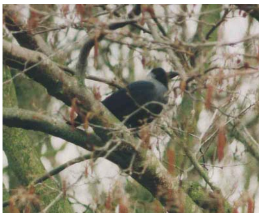
343 Huiskraai / House Crow Corvus splendens , adult, Schiermonnikoog, Friesland, Netherlands, March 2000

birders to submit records to the CDNA may be decreasing, also because House Crows are often not regarded as 'true' vagrants that deserve full documentation. Although most reports of House Crows can be considered reliable, mistakes have been made and are always possible, making a cautious approach necessary. Moreover, if the breeding population in Hoek van Holland continues to grow, House Crow is likely to be deleted from the list of species considered by the CDNA.