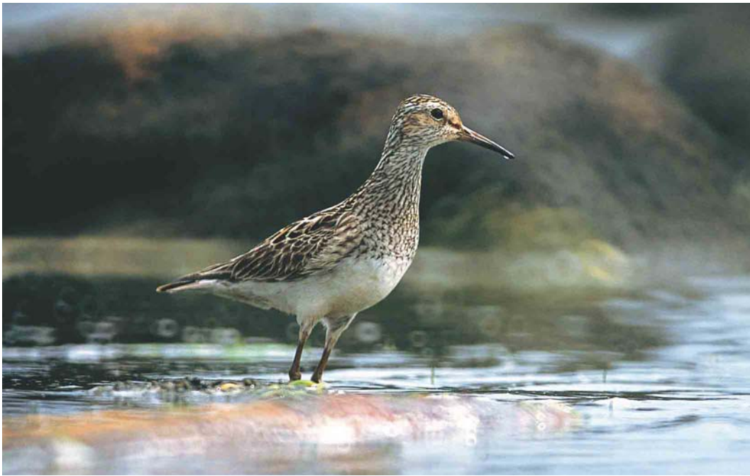
378 Pectoral Sandpiper / Gestreepte Strandloper Calidris melanotos , Tory Island, Donegal, Ireland, 12 July 2003