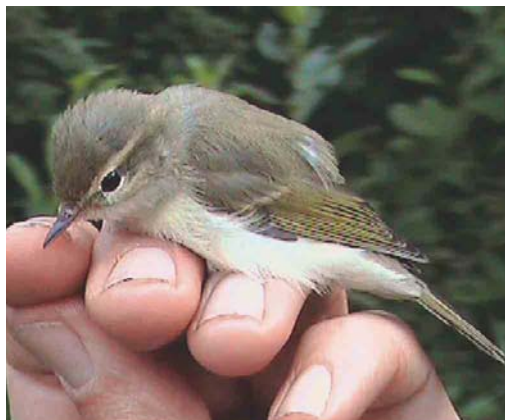
336 Grauwe Fitis / Greenish Warbler Phylloscopus trochiloides , juveniel, Groene Glop, Schiermonnikoog, Friesland, 29 juli 2003 (Enno B Ebels)

vogels meer gezien of gehoord, ondanks dagelijkse wandelingen tot en met 2 augustus.