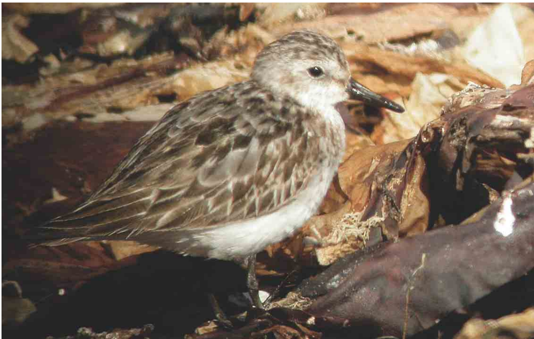
379 Semipalmated Sandpiper / Grijze Strandloper Calidris pusilla , adult, Fair Isle, Shetland, Scotland, August 2003 (Deryk Shaw)