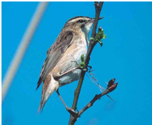
361 Sedge Warbler / Rietzanger Acrocephalus schoenobaenus , Rottemeren, Zuid-Holland, Netherlands, April 2003

VIII The answers received for mystery photograph VIII could be roughly divided into three different groups. The majority of the entrants opted for one of the pipits Anthus (44%). Second in popularity were the larks Alaudidae (42%). Another 14% of the entrants thought the mystery bird to be a finch or bunting. Indeed, the slightly forked tail and the raised crown-feathers shown by the mystery bird, seem to indicate the latter. In addition, some buntings like Cirl Bunting E cirillus and Corn Bunting E calandra , which were among the answers, show distinctly streaked mantle-feathers. On the other hand, the mystery bird clearly shows a very short primary projection. The tertials are very long and cover the primaries almost completely. This feature easily excludes all species of finches and buntings and also many species of larks. Only Greater Short-