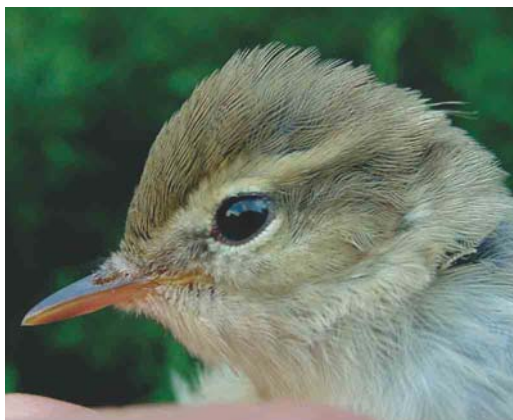
335 Grauwe Fitis / Greenish Warbler Phylloscopus trochiloides , juveniel, Groene Glop, Schiermonnikoog, Friesland, 29 juli 2003 (Henri Bouwmeester)