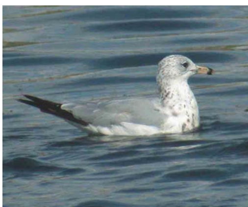
372 Grey-tailed Tattler / Griijze Ruiter Heteroscelus brevipes, Sebybadet, Öland, Sweden, 12 July 2003 373 Hudsonian Godwit / Rode Grutto Limosa haemastica, Väsby fjärd, Öland, Sweden, 19 June 2003 cf Dutch Birding 25: 263, 2003 374-375 Oriental Plover / Steppesplevier Charadrius veredus, adult, Ilmajoki Kahrakuusentie, Finland, 25 May 2003 cf Dutch Birding 25: 263, 2003 376 Great Snipe / Poelsnip Gallinago media, Kolansko blato, Pag island, Croatia, 1 May 2003 377 Ring-billed Gull / Ringsnavelmeeuw Larus delawarensis, Calais, Pas-de-Calais, France, 27 July 2003