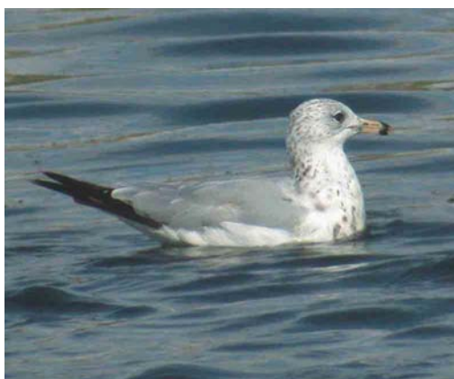
372 Grey-tailed Tattler / Grijsze Ruiter Heteroscelus brevipes, Sebybadet, Öland, Sweden, 12 July 2003 373 Hudsonian Godwit / Rode Grutto Limosa haemastica, Väsby fjärd, Öland, Sweden, 19 June 2003 cf Dutch Birding 25: 263, 2003 374-375 Oriental Plover / Steppesplevier Charadrius veredus, adult, Ilmajoki Kahrakuusentie, Finland, 25 May 2003 cf Dutch Birding 25: 263, 2003 376 Great Snipe / Poelsnip Gallinago media, Kolansko blato, Pag island, Croatia, 1 May 2003 377 Ring-billed Gull / Ringsnavelmeeuw Larus delawarensis, Calais, Pas-de-Calais, France, 27 July 2003