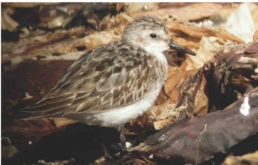
379 Semipalmated Sandpiper / Grijze Strandloper Calidris pusilla , adult, Fair Isle, Shetland, Scotland, August 2003