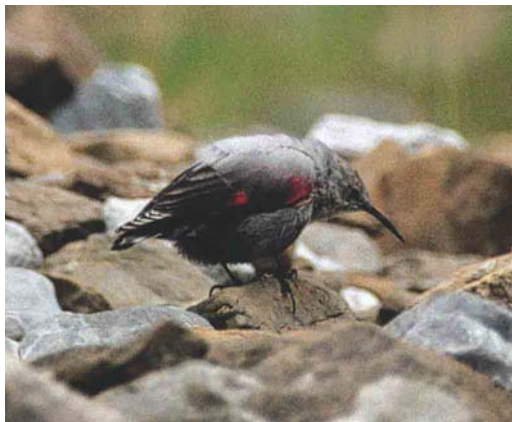
344-345 Wallcreeper / Rotskruiper Tichodroma muraria , first-winter, Cirque de Gavarnie, Gavarnie, Hautes-Pyrénées, France, 7 September 1995 ( Arnoud B van den Berg )

Wallcreeper's conspicuously crimson-coloured wings makes one wondering why the colour needs to be so radiant in such a poor environment as limestone-dolomite rock faces, where a dull or cryptically coloured bird might be expected. Another mystery is why a bird on a bare and steep rock face should draw attention to itself by its shimmering, continuously flicking wings; prominent restlessness is an unusual survival tactic,