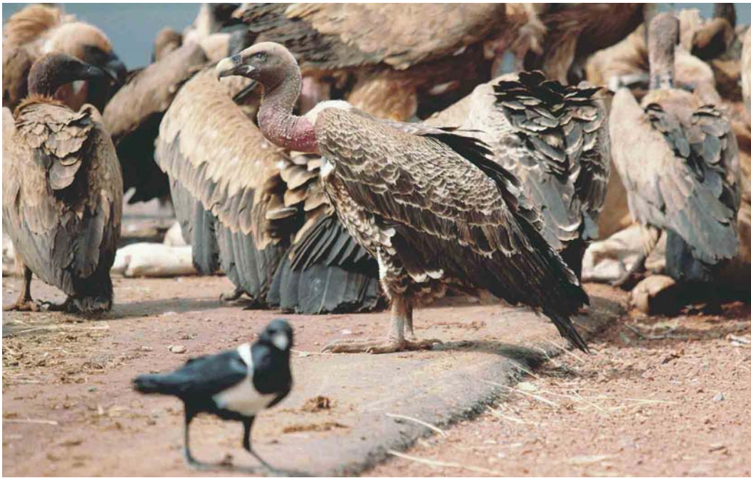
332 Rüppell's Griffon Vulture / Rüppells Gier Gyps rueppellii , subadult, with White-backed Vulture / Witruiggier G africanus and Eurasian Griffon Vultures / Vale Gieren G fulvus , between Diourbel and Kaolack, Senegal, 14 February 1999. Wintering Eurasian Griffon Vultures share wintering grounds with Rüppell's Griffon Vultures.

(SEO/Birdlife et al 1999). In 1999, the numbers of Eurasian Griffons actually crossing increased to 2649 and, in 2000, there were 4816 confirmed to take off for the African side of the Straits (SEO/Birdlife et al 2001). The autumn migration of Eurasian Griffons lasts from October to November, mainly during the third and fourth weeks of October, and this passage is more obvious than the spring one (Finlayson 1992, SEO/Birdlife et al 1999). The northward movement of Eurasian Griffons across the Straits has been much less documented than the southward passage, in common with that of other soaring birds, because coordinated counts along the entire length of the Straits have largely been confined to the southward passage period. Nevertheless, observations from Gibraltar itself, which have been made every year since 1964 (in addition to numerous earlier records) have established the following (Ernest Garcia in litt): 1 Eurasian Griffons only appear at Gibraltar during westerly winds, a situation which applies to other soaring birds as well; 2 the principal passage is quite late, concentrated in May