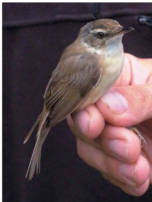
400 Veldrietzanger / Paddyfield Warbler Acrocephalus agricola , Bellem, Oost-Vlaanderen, 9 augustus 2003

UILEN TOT GORZEN De claim van een roepende Dwergooruil Otus scops bij Frahan-Poupehan, Luxembourg, op 27 juli kon door middel van een geluidsopname bevestigd worden. De Bijeneters Merops apiaster van Wachtebeke, Oost-Vlaanderen, produceerden dit jaar twee jongen; op 26 juli verlieten ze het nest. Tussen 24 en 31 augustus werden Draaihalzen Jynx torquilla waargenomen of geringd in de Gentse Kanaalzone, Oost-Vlaanderen; te Heist, West-Vlaanderen; op de Kalmthoutse Heide, Antwerpen; te Lier; en bij Oostmalle, Antwerpen. Waarnemingen van Duinpiepers Anthus campestris kwamen van het Groot Schietveld te Brecht (3 augustus); Heist (27 augustus); Nieuwpoort (24 augustus); Oostmalle (21 augustus); de bezinkingsputten van Tienen, Vlaams-Brabant (16 augustus); en de Uitkerkse Polders, West-Vlaanderen (twee op 24 augustus). Een Noordse Nachtegaal Luscinia luscinia werd op 18 augustus geringd te Hamme-Mille, Brabant-Wallon. Op 24 juli zong er een nieuwe Graszanger Cisticola juncidis bij Bredene, West-Vlaanderen. Langs de westkust bij Veurne, West-Vlaanderen, werden weer 10-tallen Waterrietzangers Acrocephalus paludicola geringd, vooral in augustus. De eerste Veldrietzanger A agricola