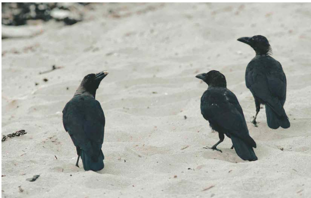
337 House Crows / Huis kraaien Corvus splendens , adult (left) with juveniles, Hoek van Holland, Zuid-Holland, Netherlands, 7 September 2003 (Marten van Dijk)