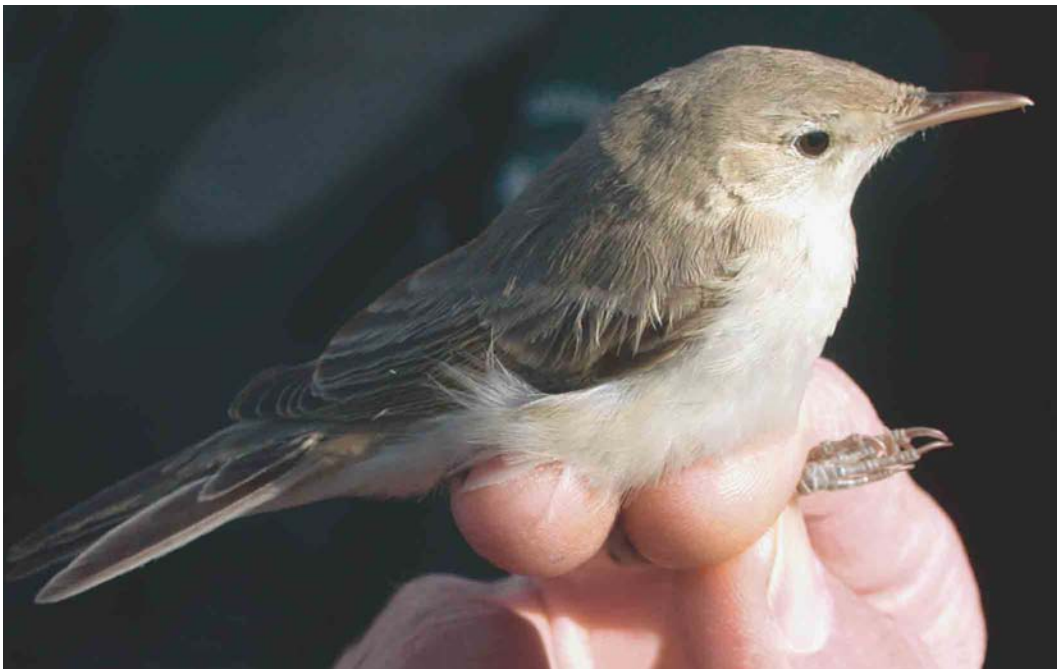
383 Eastern Olivaceous Warbler / Oostelijke Vale Spotvogel Acrocephalus pallidus elaeicus , Portland, Dorset, Engeland, 31 August 2003 (James Lidster)