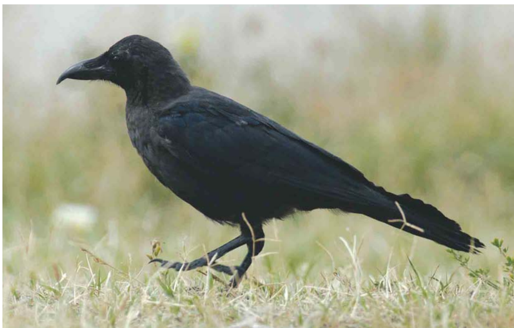
338 House Crow / Huis kraai Corvus splendens , juvenile, Hoek van Holland, Zuid-Holland, Netherlands, 7 September 2003 (Marten van Dijk)