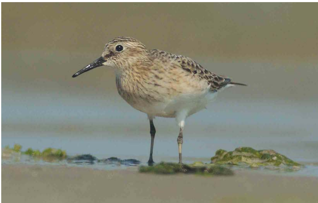
389 Bairds Strandloper / Baird's Sandpiper Calidris bairdii , adult, De Cocksdorp, Texel, Noord-Holland, 8 augustus 2003