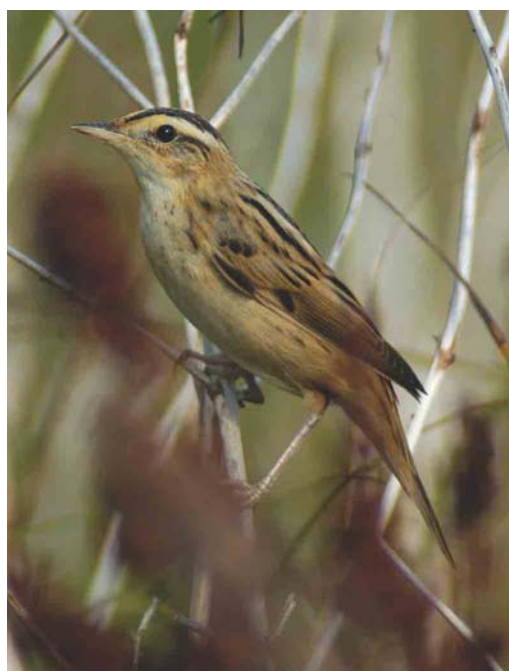
390 Ralreiger / Squacco Heron Ardeola ralloides , Oud-Alblas, Zuid-Holland, 9 juli 2003 ( Willem van Rijswijk ) 391 Waterrietzanger / Aquatic Warbler Acrocephalus paludicola , Bakkersdam, Noord-Holland, 12 augustus 2003 ( Marten van Dijk ) 392 Lachstern / Gull-billed Tern Gelocheidon nilotica , eerstejaars (links), met Kokmeeuw / Black-headed Gull Larus ridibundus en Kieviten / Northern Lapwings Vanellus vanellus , Burgervlotbrug, Noord-Holland, 12 augustus 2003 ( Marten van Dijk )