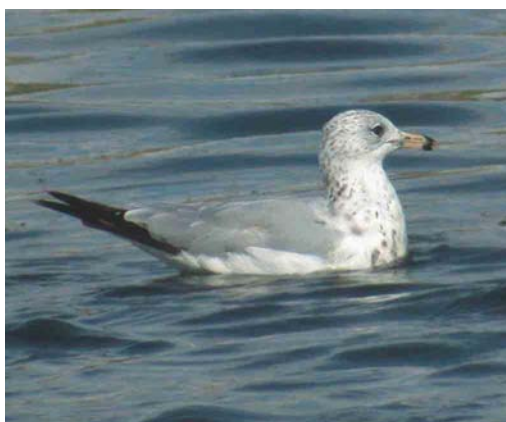
372 Grey-tailed Tattler / Grijze Ruiter Heteroscelus brevipes, Sebybadet, Öland, Sweden, 12 July 2003 373 Hudsonian Godwit / Rode Grutto Limosa haemastica, Väsby fjärd, Öland, Sweden, 19 June 2003 cf Dutch Birding 25: 263, 2003 374-375 Oriental Plover / Steppeplevier Charadrius veredus, adult, Ilmajoki Kahrakuusentie, Finland, 25 May 2003 cf Dutch Birding 25: 263, 2003 376 Great Snipe / Poelsnip Gallinago media, Kolansko blato, Pag island, Croatia, 1 May 2003 377 Ring-billed Gull / Ringsnavelmeeuw Larus delawarensis, Calais, Pas-de-Calais, France, 27 July 2003