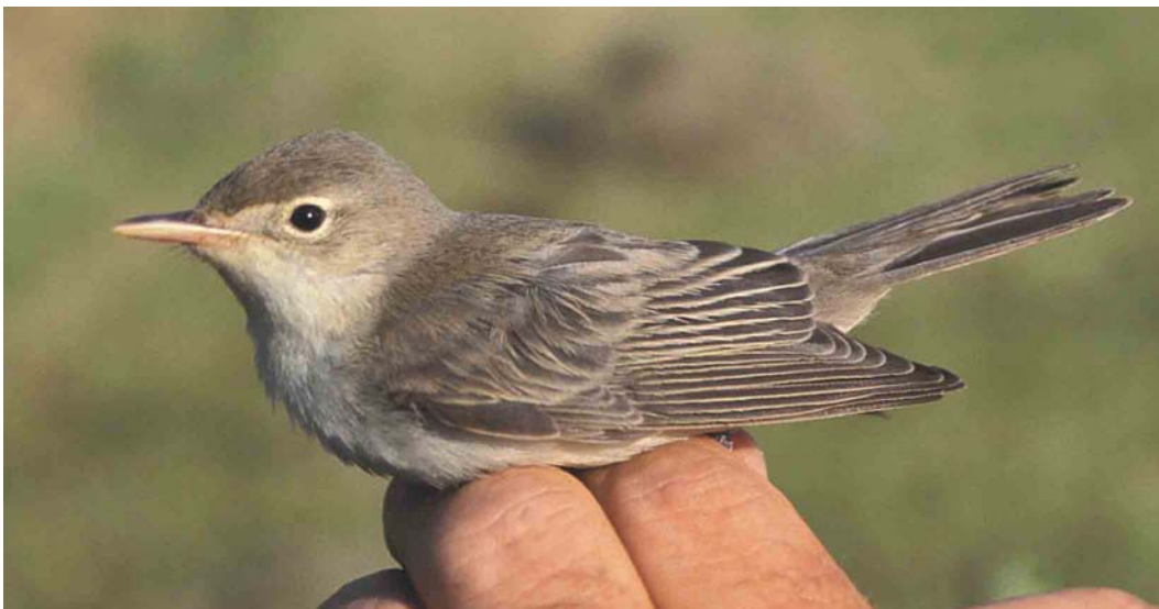
402 Spotvogel / Icterine Warbler Hippolais icterina , eerste-winter, Zandvoort, Noord-Holland, 17 augustus 2003

Spotvogel zonder groen en geel te Zandvoort Op 17 augustus 2003 ving Hans Vader in aanwezigheid van Lydekke van Citters, Marcel Schalkwijk en Piet Veel een bijzondere spotvogel Hippolais op de ringbaan van de Amsterdamse Waterleidingduinen te Zandvoort, Noord-Holland ( http://home.planet.nl/~schal443/Vinkenbaan/VinkenbaanAWduin.htm ). De platte, brede snavel (5.8 mm) en het postuur wezen op een spotvogel maar door het ontbreken van groen en geel in het kleed werden Spotvogel H ictarina en Orpheusspotvogel H polyglotta aanvankelijk buiten beschouwing gelaten. De vleugels hadden een (diverse keren nagemeten) lengte van 76 mm en daarop paste volgens de Identification guide to European passerines (Svensson 1992) verder alleen Grote Vale Spotvogel H languida . De overige biometri-