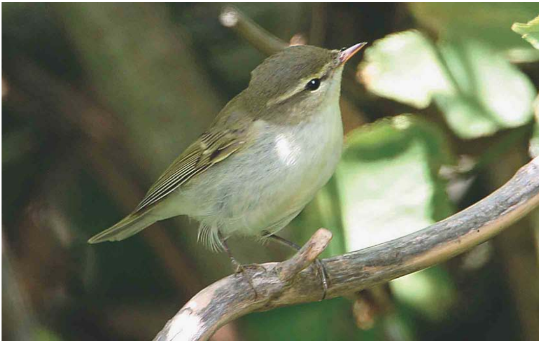
382 Greenish Warbler / Grauwe Fitis Phylloscopus trochiloides , Reculver, Kent, England, 30 August 2003