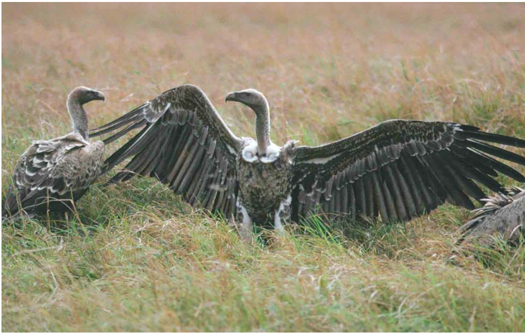
330-331 Rüppell's Griffon Vultures / Rüppells Gieren Gyps rueppellii , Kenya, August 1987 (Xavier Parellada). Note paler and more defined edges of wing-coverts in adults in comparison with similar-aged birds from Senegal (and Spain).