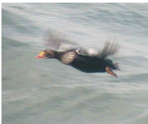
393-394 Steppeworkstaartplevier / Black-winged Pratincole Glareola nordmanni , Burgervlotbrug, Noord-Holland, 12 augustus 2003 395 Forsters Stern / Forster's Tern Sterna forsteri , eerste-zomer, met Visdief / Common Tern S. hirundo , Colijnsplaat, Zeeland, 18 juli 2003 396 Koningseider / King Eider Somateria spectabilis , mannetje eclips, Scheveningen, Zuid-Holland, 31 augustus 2003

vogel die in mei-juni bij Zeebrugge, West-Vlaanderen, België, werd gezien. Witwangsterns Chlidonias hybrida werden waargenomen op 19 juli (twee) in de Oostvaardersplassen, op 24 en 25 juli in de Ezuma-keeg, op 27 juli in de Eemshaven, op 7 augustus langs Westhoek en op 17 augustus in de Makkumer-zuidwaard. Slechts een 15-tal Witvleugelsterns C. leucopterus werd gemeld, voornamelijk in het IJsselmeergebied.