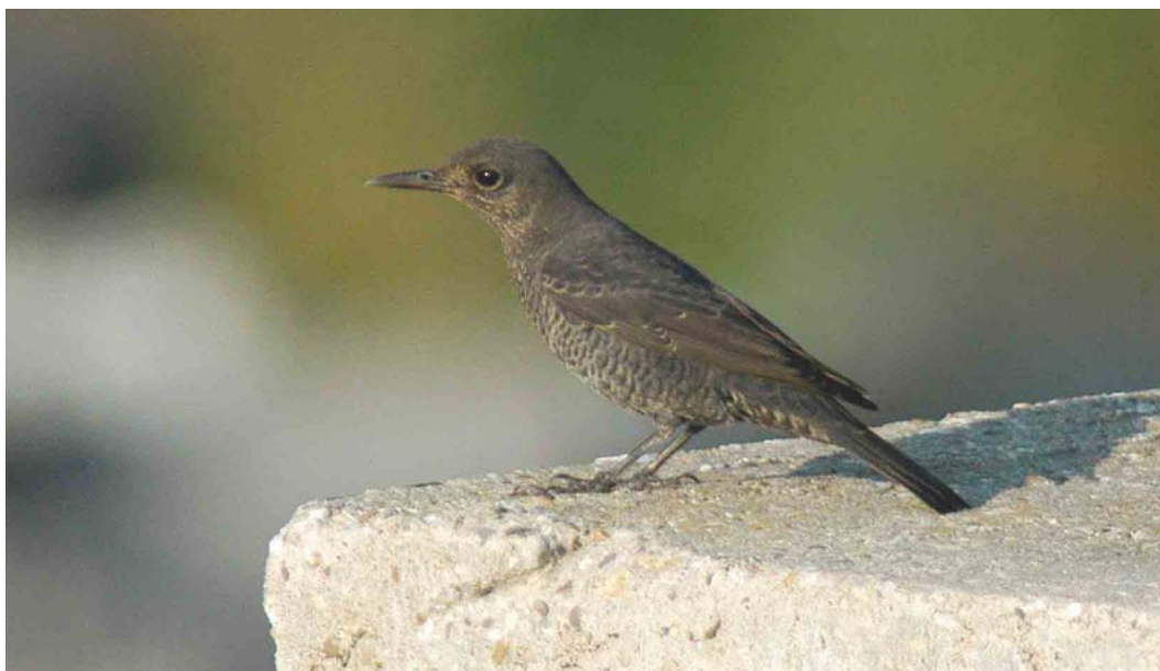
405 Blauwe Rotslijster / Blue Rock Thrush Monticola solitarius , Westkapelle, Zeeland, 20 september 2003 (Marten van Dijk)