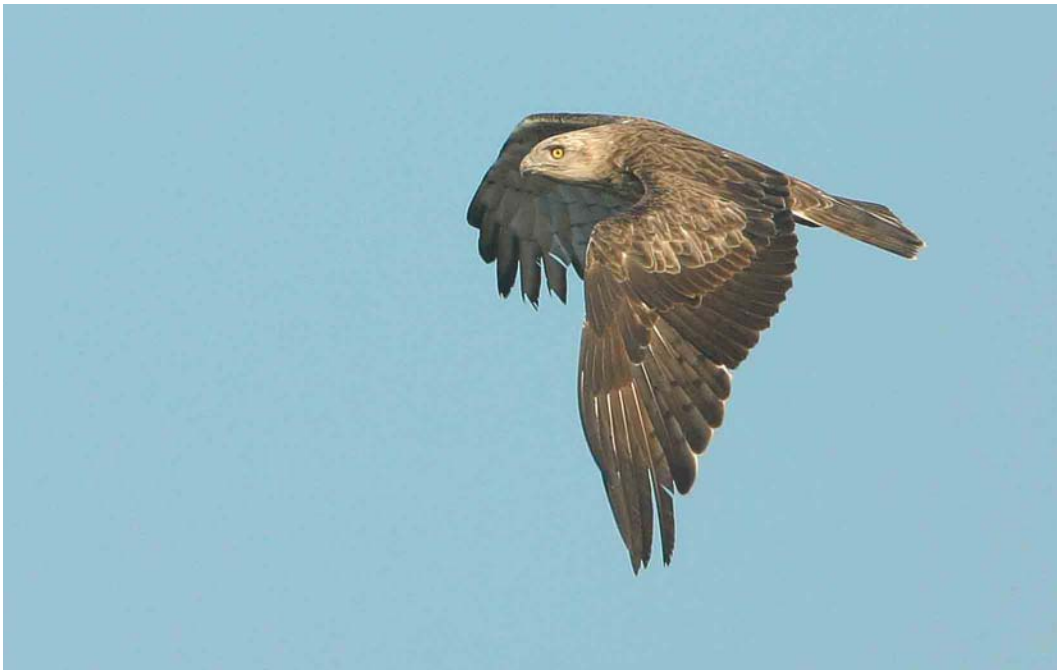
384-385 Slangenarend / Short-toed Eagle Circaetus gallicus , De Hamert, Limburg, 10 augustus 2003 (Ran Schols)