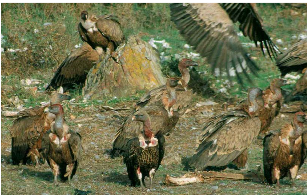
327 Rüppell's Griffon Vulture / Rüppells Gier Gyps rueppellii , immature (front centre), with Eurasian Griffon Vultures / Vale Gieren G fulvus , Tarifa, Cádiz, Spain, 4 October 2001 (Javier E Navarro)

its bad condition and brought to the Jerez Zoo on 28 May. It showed no signs of having been in captivity. It was marked with a radio-transmitter and PVC ring (plate 329) and released into the wild on 10 July 2003; it remained in the Cádiz area at least until early September 2003. This is the first proven case of a Rüppells Vulture apparently coming from Africa in a direct flight in an otherwise well covered area by local ornitholo-