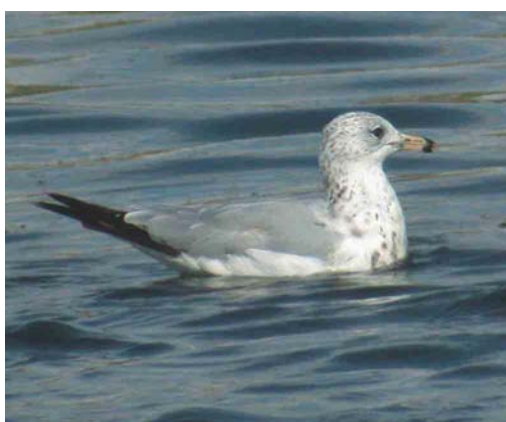
372 Grey-tailed Tattler / Grijsze Ruiter Heteroscelus brevipes, Sebybadet, Öland, Sweden, 12 July 2003 373 Hudsonian Godwit / Rode Grutto Limosa haemastica, Väsby fjärd, Öland, Sweden, 19 June 2003 cf Dutch Birding 25: 263, 2003 374-375 Oriental Plover / Steppeplevier Charadrius veredus, adult, Ilmajoki Kahrakuusentie, Finland, 25 May 2003 cf Dutch Birding 25: 263, 2003 376 Great Snipe / Poelsnip Gallinago media, Kolansko blato, Pag island, Croatia, 1 May 2003 377 Ring-billed Gull / Ringsnavelmeeuw Larus delawarensis, Calais, Pas-de-Calais, France, 27 July 2003