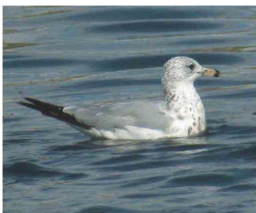
372 Grey-tailed Tattler / Grijze Ruiter Heteroscelus brevipes, Sebybadet, Öland, Sweden, 12 July 2003 373 Hudsonian Godwit / Rode Grutto Limosa haemastica, Väsby fjärd, Öland, Sweden, 19 June 2003 cf Dutch Birding 25: 263, 2003 374-375 Oriental Plover / Steppeplevier Charadrius veredus, adult, Ilmajoki Kahrakuusentie, Finland, 25 May 2003 cf Dutch Birding 25: 263, 2003 376 Great Snipe / Poelsnip Gallinago media, Kolansko blato, Pag island, Croatia, 1 May 2003 377 Ring-billed Gull / Ringsnavelmeeuw Larus delawarensis, Calais, Pas-de-Calais, France, 27 July 2003