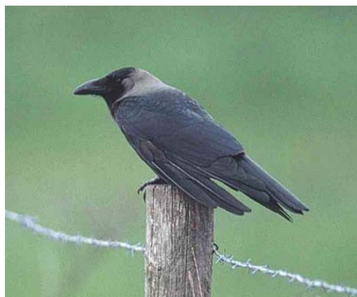
342 House Crow / Huiskraai Crow Corvus splendens , adult, Renesse, Zeeland, Netherlands, May 2001 (Marten van Dijl)