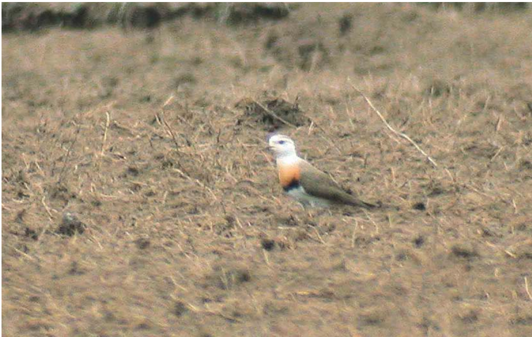
380 Oriental Plover / Steppeplevier Charadrius veredus , adult, Ilmajoki Kahrakuusentie, Finland, 25 May 2003 cf Dutch Birding 25: 263, 2003