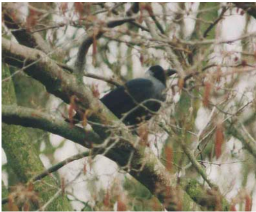
343 Huiskraai / House Crow Corvus splendens , adult, Schiermonnikoog, Friesland, Netherlands, March 2000

birders to submit records to the CDNA may be decreasing, also because House Crows are often not regarded as 'true' vagrants that deserve full documentation. Although most reports of House Crows can be considered reliable, mistakes have been made and are always possible, making a cautious approach necessary. Moreover, if the breeding population in Hoek van Holland continues to grow, House Crow is likely to be deleted from the list of species considered by the CDNA.