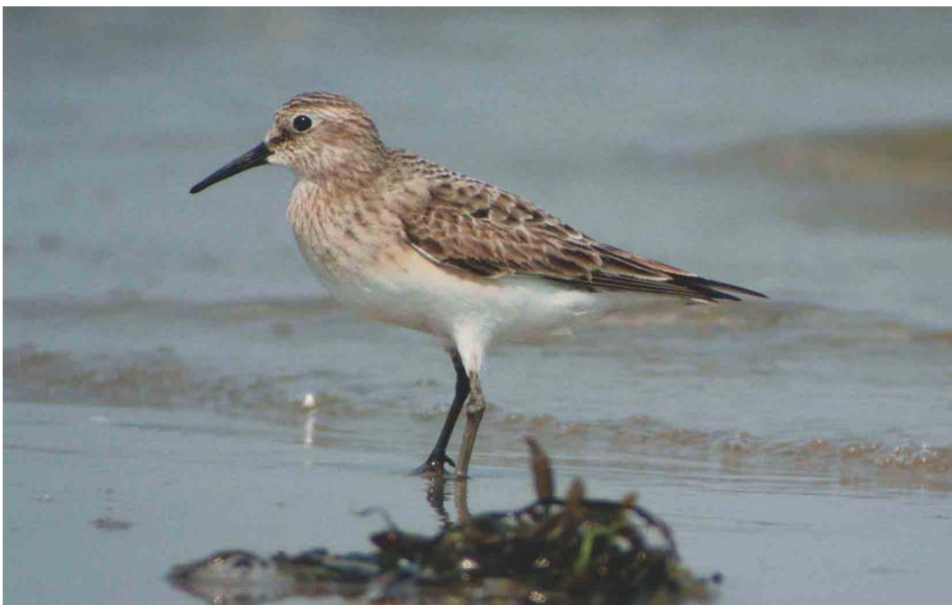
381 Baird's Sandpiper / Bairds Strandloper Calidris bairdii , adult, De Cocksdorp, Texel, Noord-Holland, Netherlands, 8 August 2003 ( Phil Koken )