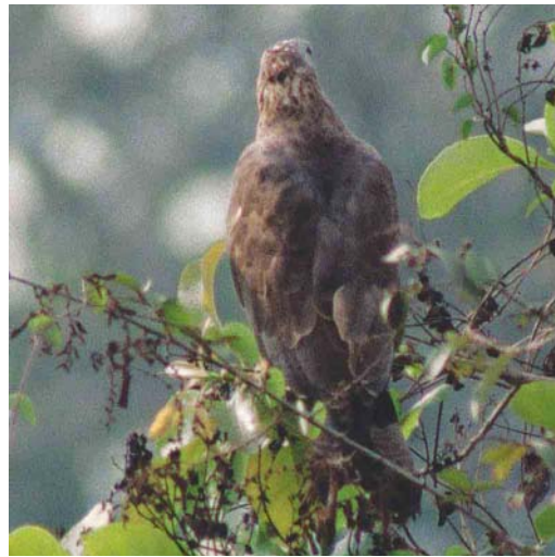
Mystery photograph X (March)

by Nils van Duivendijk at Petten, Noord-Holland, the Netherlands, in July 1999. Plate 362 shows another photograph of the same bird. This mystery bird was correctly identified by 30% of the entrants. The most frequently mentioned incorrect answers included Tree Pipit (10%), Rock Pipit (4%), Greater Short-toed Lark (9%) and Oriental Skylark (9%).