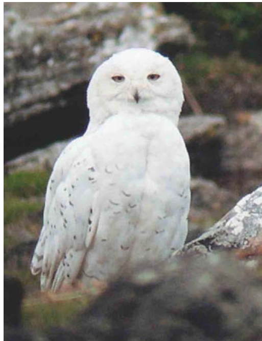
363 Masked Booby / Maskergent Sula dactylatra , Bay of Biscay, Spain, 3 September 2003 364 Snowy Owl / Sneeuwuil Nyctea scandiaca , male, North Uist, Western Isles, Scotland, 16 August 2003 365 Elegant Tern / Sierlijke Stern Sterna elegans , subadult, Pointe de l'Imperlay, Corsept, Loire-Atlantique, France, 31 August 2003