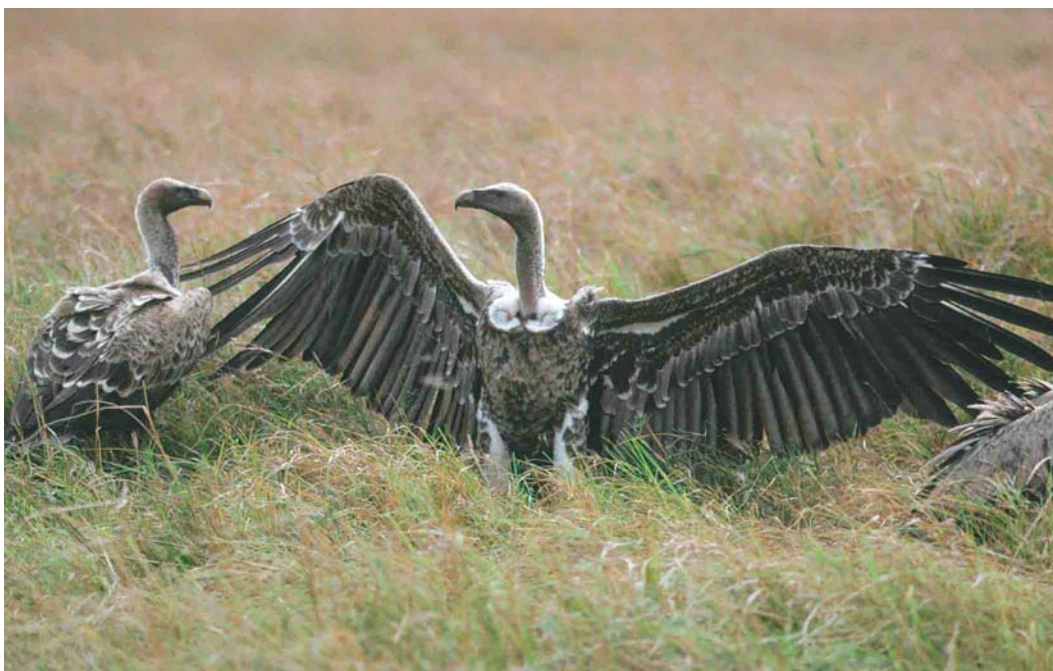
330-331 Rüppell's Griffon Vultures / Rüppells Gieren Gyps rueppellii , Kenya, August 1987 (Xavier Parellada). Note paler and more defined edges of wing-coverts in adults in comparison with similar-aged birds from Senegal (and Spain).