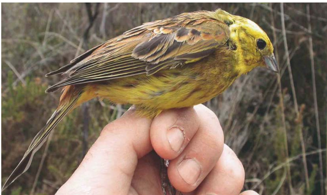
358 Yellowhammer / Geelgors Emberiza citrinella , adult male, Lussac-les-Châteaux, Vienne, France, 2 May 2003. Most males captured on this site showed a more or less obvious rufous malar stripe and an obvious olive band on the upper chest but no bird other than the hybrid in plate 347-349 displayed any rufous on the forehead or along the sub-moustachial stripes as well as a complete and extensive rufous chest band.

ment border to the ear-coverts. Most of these criteria fit the bird captured at Lussac-les-Châteaux very well. In pale-morph hybrids, such as those reported in Aye & Schweizer (2003), the sub-moustachial area is rufous to a varying degree, the throat is white or rufous and the ground colour of the head is usually pure white but may be pale yellow (Byers et al 1995). Our bird was quite similar to such birds but with a pale yellow head and deep yellow lower breast. Maybe more interestingly, its prolonged presence late in the spring and its physiological reproductive state (protruding cloaca) suggest that this hybrid was perhaps part of the local breeding population, in central western France, a few 1000s km away from populations where hybrids are known to breed (Panov et al 2003). Could this bird have emigrated from the secondary contact zone of Yellowhammer and Pine Bunting to France, or did any Pine Bunting ever breed in France, leaving some genes in this population at least? Perhaps this bird (or one of its parents or ancestors) found its way to central western France after having wintered in the Camargue, France,