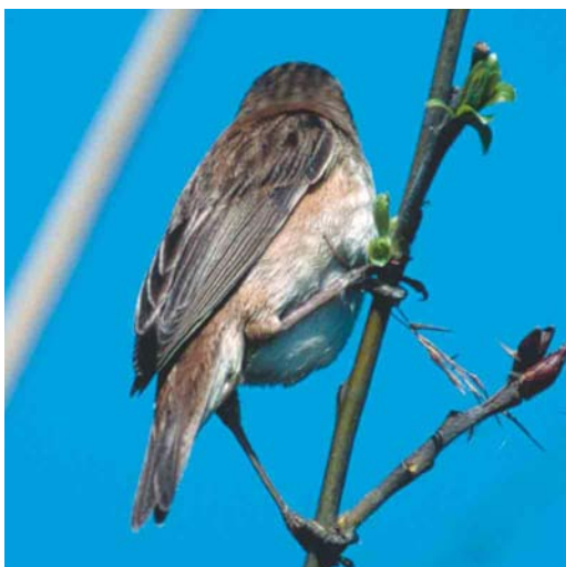
Mystery photograph VII (April)