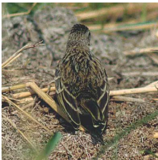
Mystery photograph VIII (July)

only one species shows a very neat and narrow black tail-band, dark outer webs of the inner primaries (resulting in the absence of an obvious pale window), largely unmarked underwings and rump, a pale shade of grey on its mantle and dark grey legs as in the mystery photograph. This is Audouin's Gull L audouinii and, in addition to these plumage characters, the long-winged appearance supports this identification.