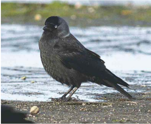
243 Probable Nordic Jackdaw / Noordse Kauw Corvus monedula monedula , Lauwersoog, Groningen, Netherlands, 29 November 2000. Uniformly coloured bird with faint silvery collar. Such birds could very well originate from the intergradation zone between Common Jackdaw C m spermologus and monedula , sometimes referred to as C m 'turrium' .

eastern Europe towards the west (Glutz von Blotzheim & Bauer 1991). Furthermore, there are individuals possessing no patch or collar or just a vague one. This is more often the case in monedula than in soemmerringii , and these are relatively often females (Voous 1960, Voipio 1969). In southern Finland, the average size of the white patch in the foreneck increases from south-west to north-east and, especially, east. The average size of this patch in the easternmost Finnish