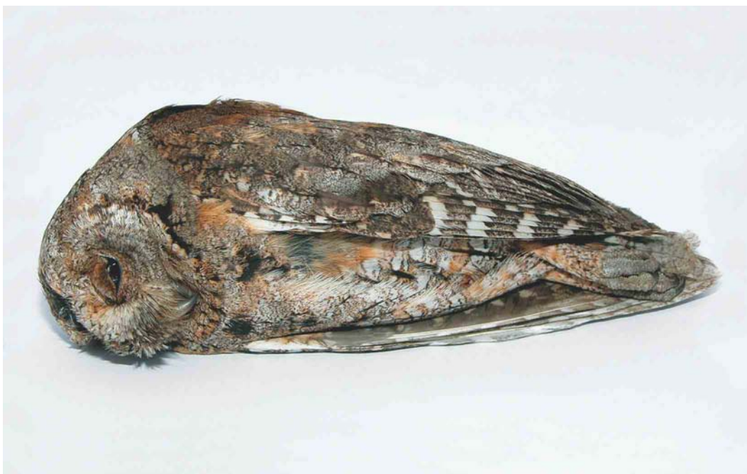
299 Dwergooruil / European Scops Owl Otus scops , Warns, Friesland, 8 mei 2003 ( Ep van Hijum )