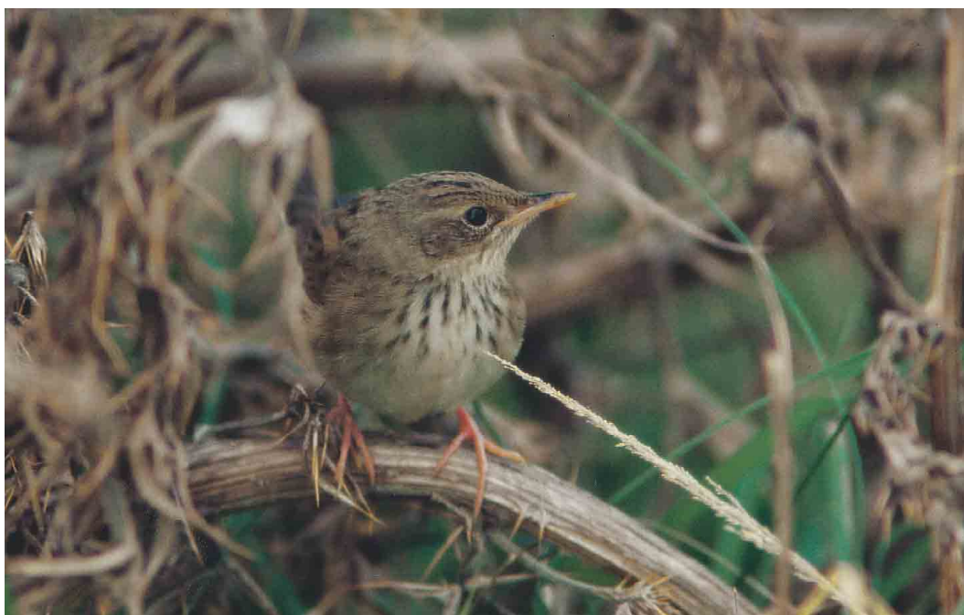
254 Kleine Sprinkhaanzanger / Lanceolated Warbler Locustella lanceolata , Zeebrugge, West-Vlaanderen, 7 oktober 1996