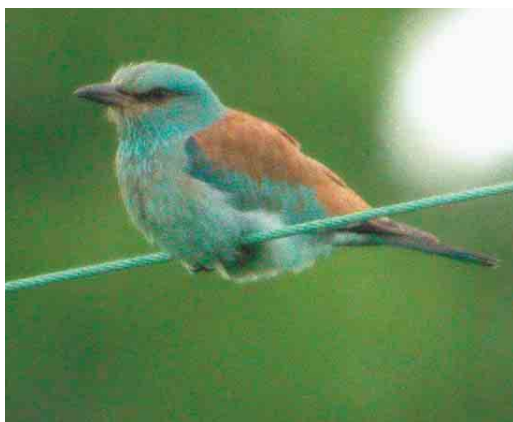
319 Scharrelaar / European Roller Coracias garrulus , Frenois, Luxembourg, 25 mei 2003