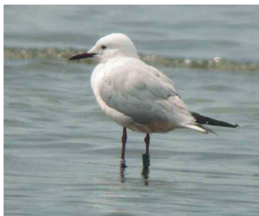
279 Sabine's Gull / Vorkstaartmeeuw Larus sabini , Lowestoft, Suffolk, England, 12 June 2003