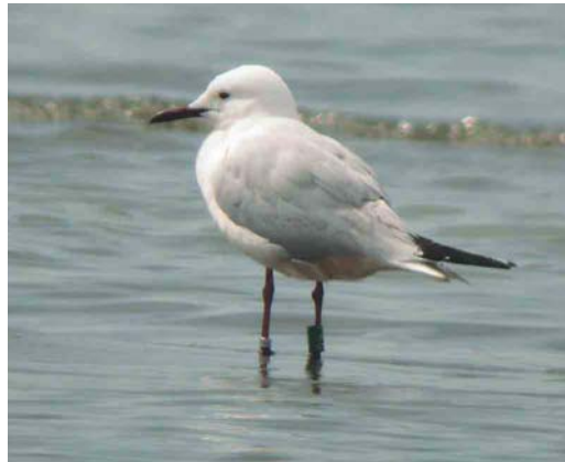
279 Sabine's Gull / Vorkstaartmeeuw Larus sabini , Lowestoft, Suffolk, England, 12 June 2003 ( Robin Chittenden ) 280 Franklin's Gull / Franklins Meeuw Larus pipixcan , adult-summer, Ein Evrona, Israel, 3 June 2003 ( James P Smith ) 281 Slender-billed Gull / Dunbekmeeuw Larus genei , Chablais de Cudrefin, Vaud, Switzerland, 24 May 2003 ( Adrian Jordi )

White Storks Ciconia ciconia at De Wijk, Drenthe, on 3-19 June, predated upon the storks' chicks, eating them on the nests. A second- or third-year Rüppell's Griffon Vulture G rueppellii first flying north at Straits of Gibraltar on 26 May was found exhausted at Tarifa, Andalusia, Spain, on 29 May and taken into care at Jerez zoo, from where it was released on 10 July. In Egypt, a record gathering of more than 50 Lappet-faced Vultures Torgos tracheliotus was noted at Bir Shalatein on 14 May. A record number of Pallid Harriers Circus macrourus visited Britain this spring, with five in May and four in June. In Denmark, the spring total was 19 (until late May). In central Italy, a female Levant Sparrowhawk Accipiter brevipes was ringed at Monte Brisighella on 11 May. Upon re-examination of the specimen of the only Steppe Buzzard Buteo buteo vulpinus accepted for Britain, a bird shot at Everleigh, Wiltshire, England, in September 1864, it was concluded that it was impossible to exclude an 'intergrade, or