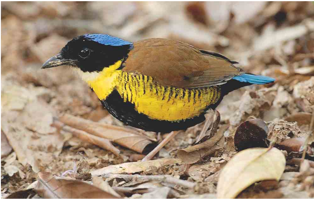
266 Gurney's Pitta / Gurneys Pitta Pitta gurneyi , male, Khao Nor Chuchi, Khao Pra-Bang Khram reserve, Thailand, 4 April 2003 (Kanit Khanikul)