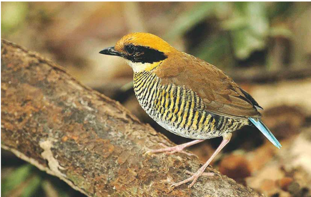
267 Gurney's Pitta / Gurneys Pitta Pitta gurneyi , female, Khao Nor Chuchi, Khao Pra-Bang Khram reserve, Thailand, 4 April 2003 (Kanit Khanikul)