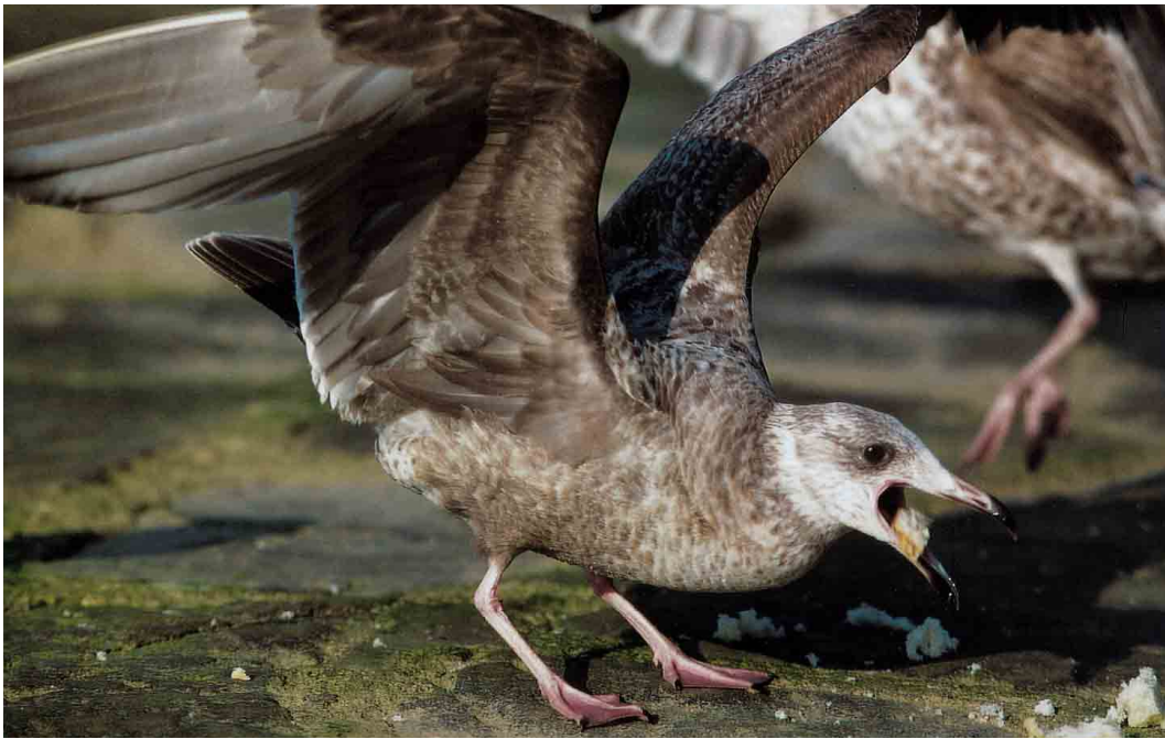
260-261 American Herring Gull / Amerikaanse Zilvermeeuw Larus smithsonianus , first-winter, Afurada, Porto, Portugal, 1 April 2001. Note clouded brown underparts continuing as shawl on hindneck and uniformly dark brown underwing-coverts and axillaries.