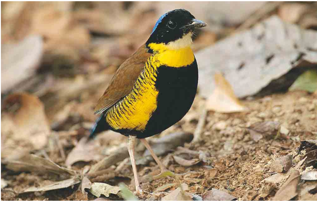
268 Gurney's Pitta / Gurneys Pitta Pitta gurneyi , male, Khao Nor Chuchi, Khao Pra-Bang Khram reserve, Thailand, 4 April 2003 (Kanit Khanikul)