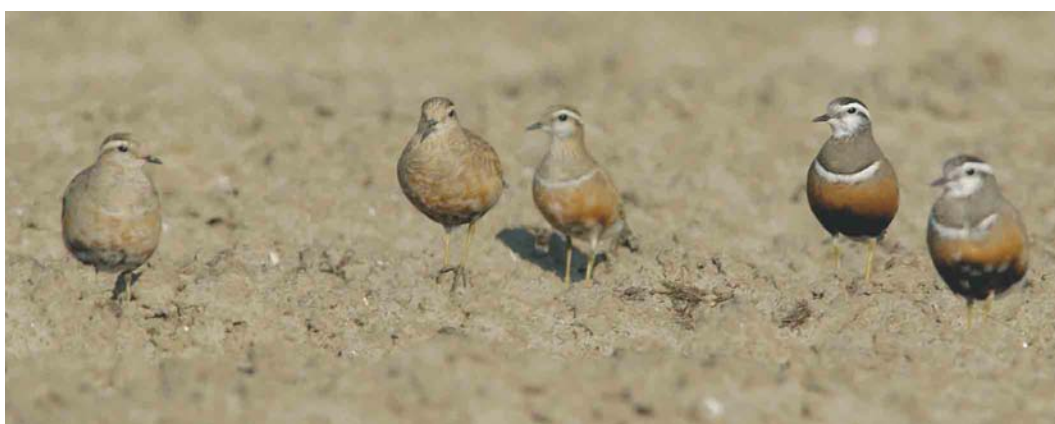
303 Slangenarend / Short-toed Eagle Circaetus gallicus , Fochteloërveen, Drenthe, 13 juni 2003 304 Dwergarend / Booted Eagle Hieraetus pennatus , lichte vorm, Opheusden, Gelderland, 19 juni 2003 305 Terekruiter / Terek Sandpiper Xenus cinereus , Makkum, Friesland, 14 mei 2003 306 Terekruiter / Terek Sandpiper Xenus cinereus , Scherpenissepolder, Zeeland, 10 mei 2003 307 Morinelplevieren / Eurasian Dotterels Charadrius morinellus , Texel, Noord-Holland, 10 mei 2003