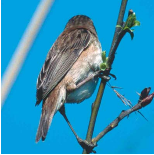
Mystery photograph VII (April)