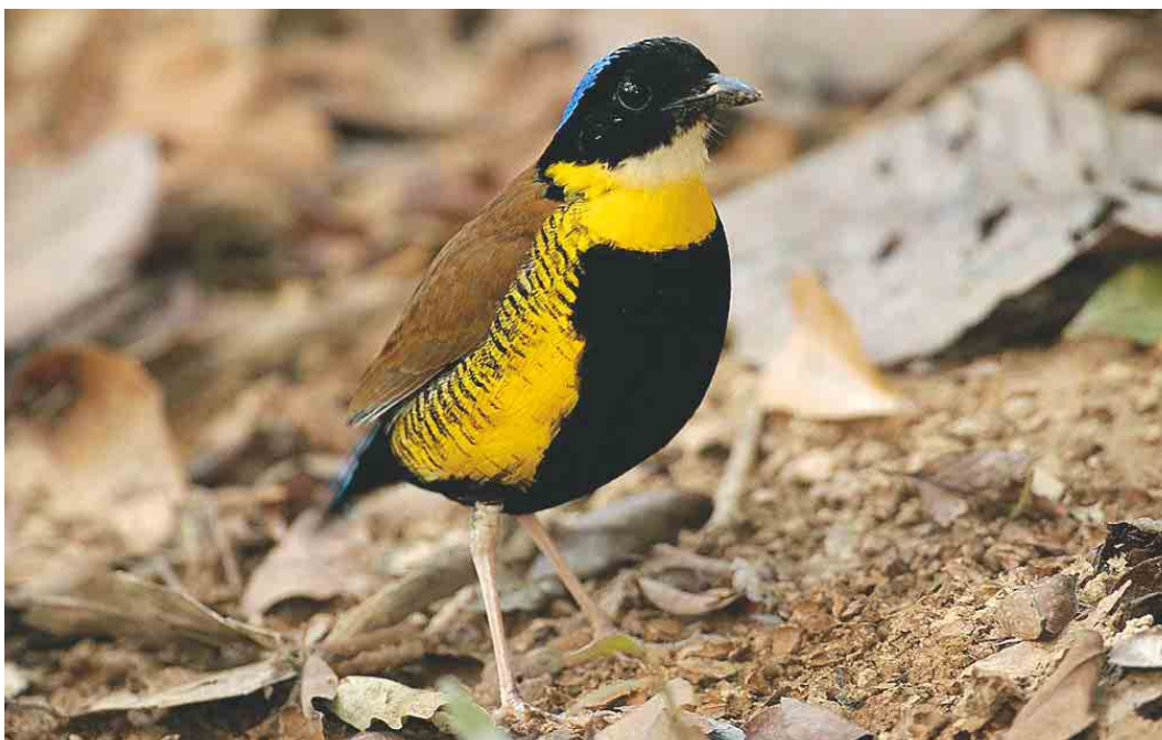
268 Gurney's Pitta / Gurneys Pitta Pitta gurneyi , male, Khao Nor Chuchi, Khao Pra-Bang Khram reserve, Thailand, 4 April 2003 (Kanit Khanikul)