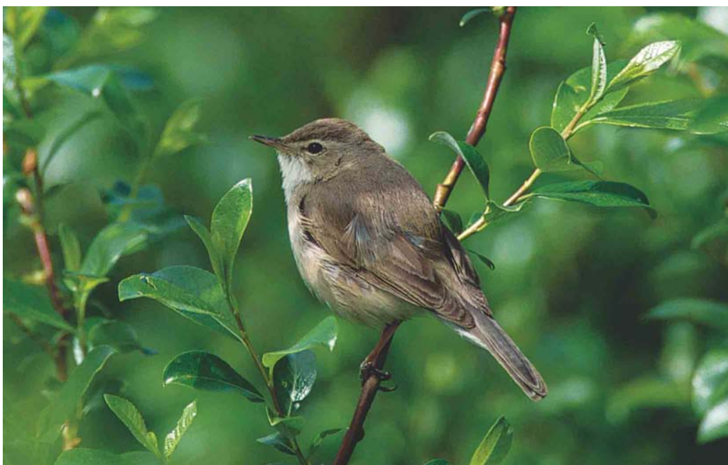
284 Booted Warbler / Kleine Spotvogel Acrocephalus caligatus , Värtsilä, Finland, 11 June 2003