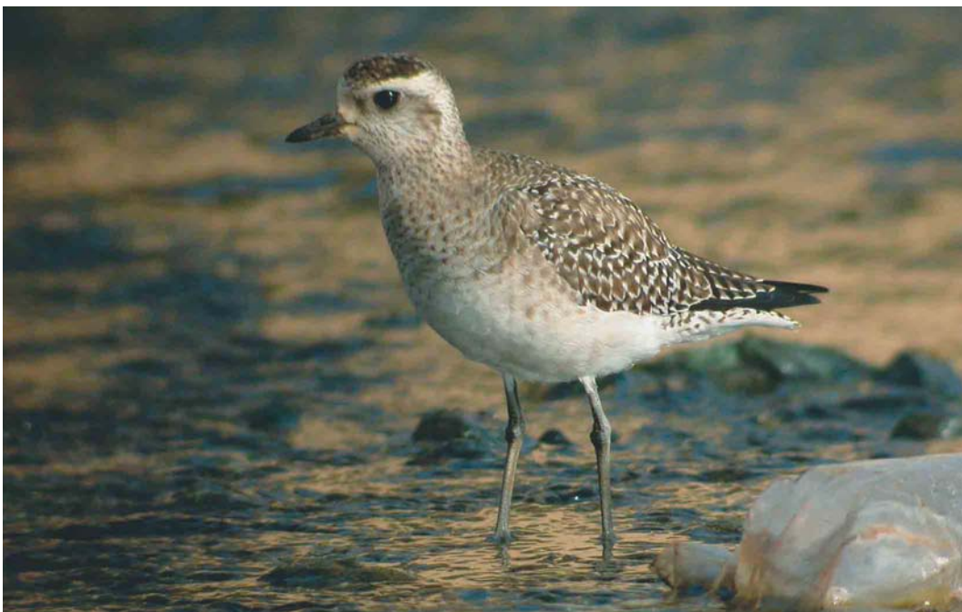
275 American Golden Plover / Amerikaanse Goudplevier Pluvialis dominica , Praia, Santiago, Cape Verde Islands, 12 April 2003 (Nico Geiregat)