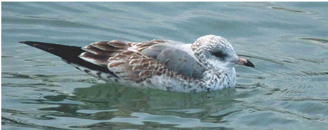
270 Mew Gull / Stormmeeuw Larus canus , Romanshorn, Bodensee, Switzerland, 13 January 2003

Another important difference can be found on the greater coverts. In first-winter Ring-billed