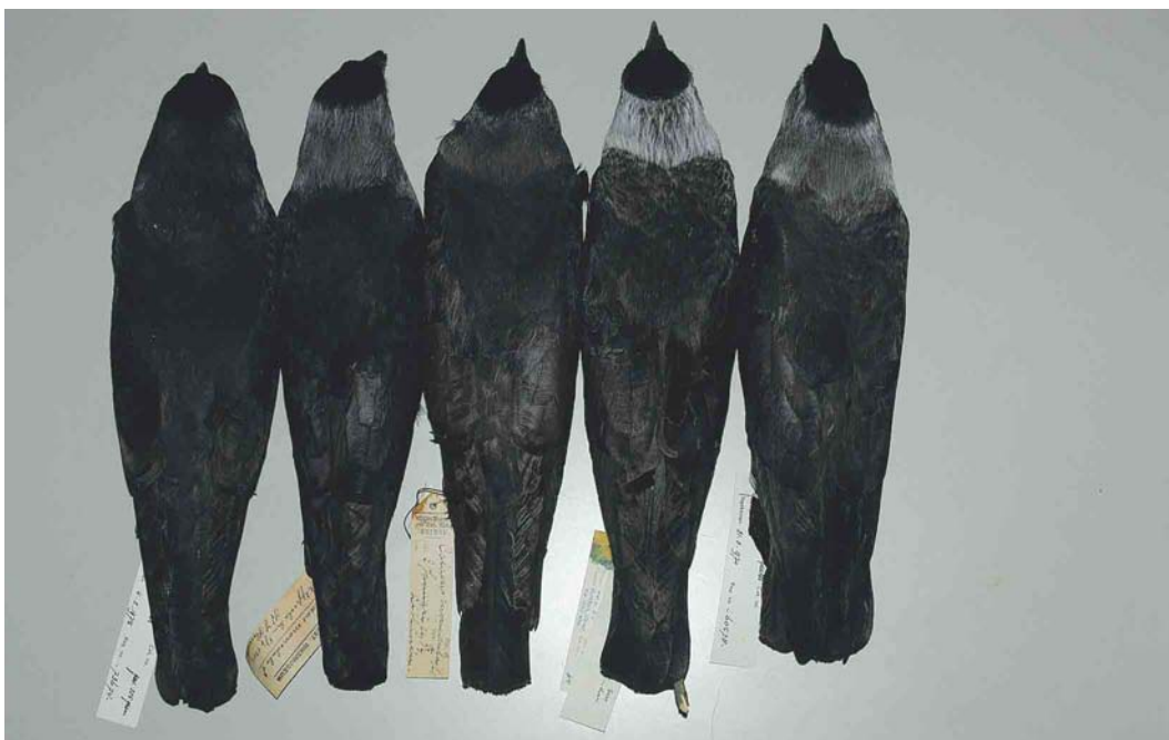
234-235 Western Jackdaws / Kauwen Corvus monedula , specimens at National Museum of Natural History, Leiden, Netherlands, 9 July 2003. From left to right: Tiel, Gelderland, Netherlands, 7 February 1975 ( C m spermologus ); Uppsala, Uppland, Sweden, 5 April 1915 ( C m monedula ); Lithuania, 2 April 1914 (western C m soemmerringii or C m monedula ); Burdur, Turkey, 14 April 1960 ( C m soemmerringii ); and Erp, Noord-Brabant, Netherlands, 18 February 1949 (presumed C m soemmerringii ).