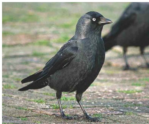
245 Common Jackdaw / Kauw Corvus monedula spermologus , Lauwersoog, Groningen, Netherlands, 7 December 2000

The variation within both western and (south-) eastern populations of soemmerringii is not fully understood. It is also unclear where both populations meet. The eastern and south-eastern populations have dark underparts (with variable pale fringes in worn plumage), mantle and scapulars as in spermologus and often quite broad and long white collars (cf Cramp & Perrins 1994). The western populations, however, seem less marked in this respect, with more dark-grey underparts resembling most monedula . The shape and whiteness of the collar seems to be less varied than in monedula but especially females and first-winter birds can strongly recall