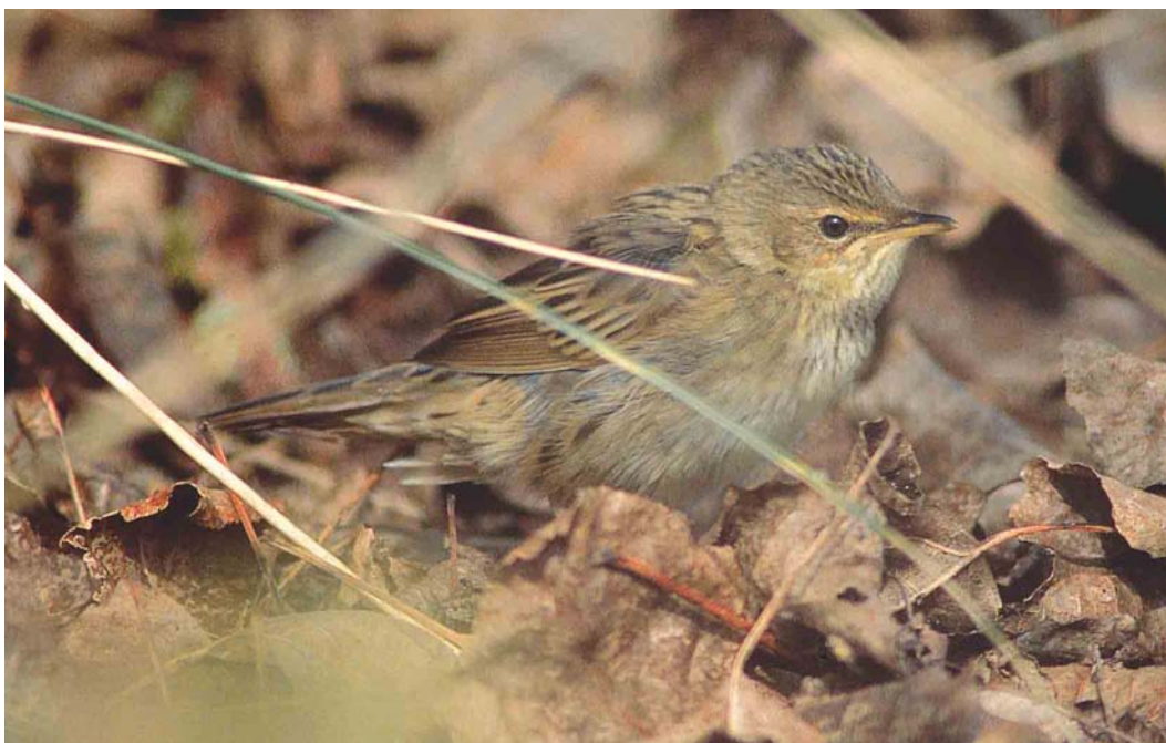
255 Kleine Sprinkhaanzanger / Lanceolated Warbler Locustella lanceolata , Knokke-Heist, West-Vlaanderen, 1 oktober 2000 ( Patrick Beirens )