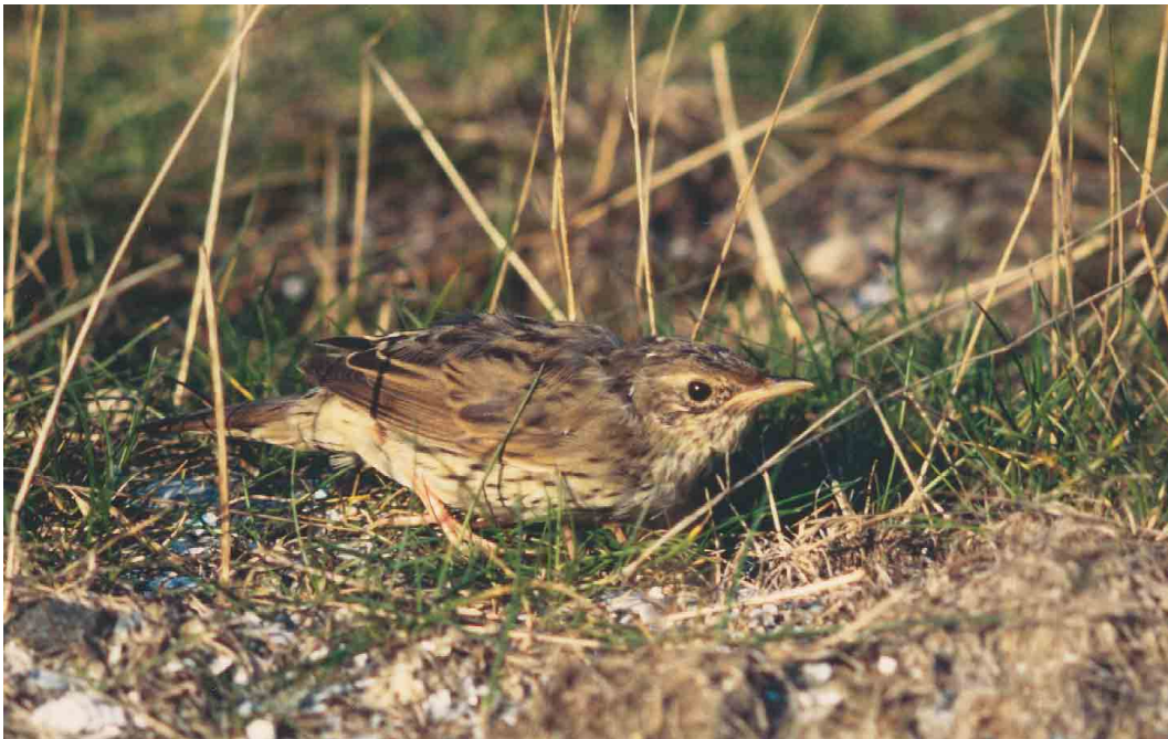
253 Kleine Sprinkhaanzanger / Lanceolated Warbler Locustella lanceolata , Zeebrugge, West-Vlaanderen, 10 oktober 1994 ( Filip De Ruwe )