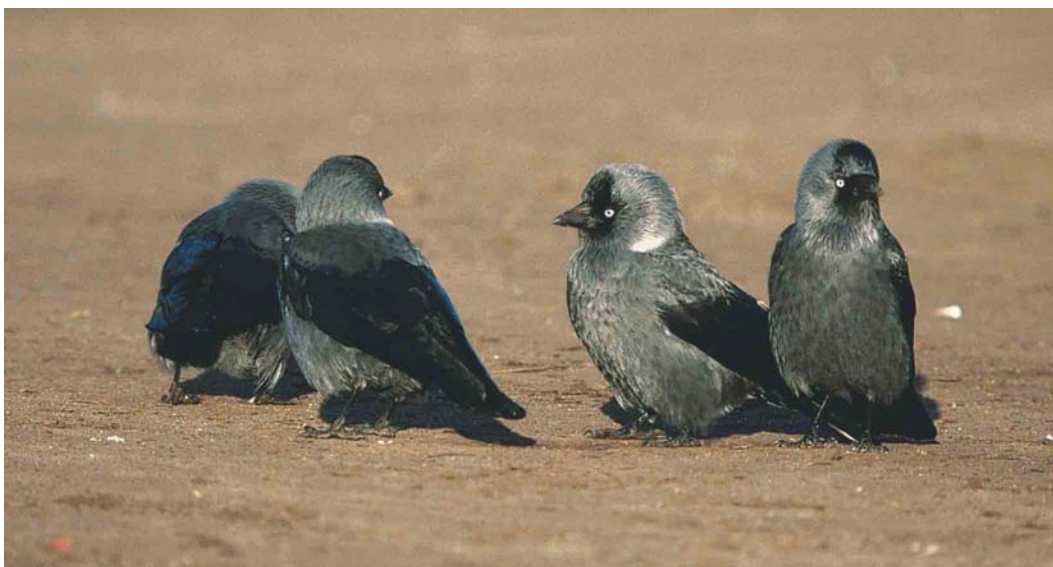
240 Probable Nordic Jackdaws / Noordse Kauwen Corvus monedula monedula , Wijster, Drenthe, Netherlands, 16 December 2001. These birds stand out because of their uniform pale-grey head, contrasting with the black forehead and wings, reminiscent of miniature Hooded Crows C cornix . Intriguingly, they show merely a dark chin instead of a dark throat. The (half) collar in the lower neck is usually silvery grey (more whitish in the fore-neck) and rather broad. The geographical origin of these birds is, however, unclear. These pale birds tend to show up in the eastern parts of Netherlands from mid-December onwards, some two months later than most Nordic Jackdaws. 241 Nordic Jackdaw / Noordse Kauw Corvus monedula monedula , Skåne, Sweden, February 2000. Another typical monedula with grey underparts and an almost white neck patch which gradually becomes a fainter silvery collar. In Russian Jackdaw C m soemmerringii , this collar should be clearly white overall.