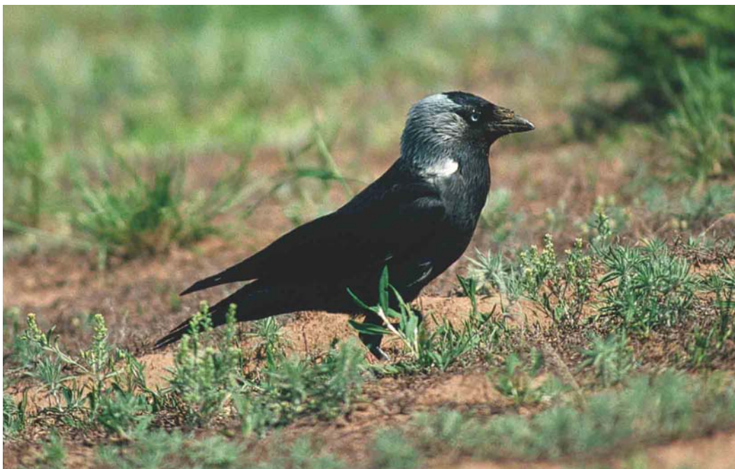
247 Russian Jackdaw / Russische Kauw Corvus monedula soemmerringii , Korgalzhyn, Tengiz, Kazakhstan, 25 May 2003

It seems that of the three subspecies, spermologus and the eastern and south-eastern populations of soemmerringii are most easy to identify. Voipio (1969) concluded that because of the overall darker plumage and the lack of a pale neck-patch and collar in spermologus , the difference between this subspecies and monedula is stronger than that between monedula and the western populations of soemmerringii . Voipio (1969) also considered the white neck-patch and collar to be the main basis for separation between monedula and western populations of soemmerringii . In the latter, however, these can be lacking in females and in first-winter plumage and obscured because of wear in breeding plumage. This leaves only adult males in fresh plumage identifiable by their neck-patch and collar;