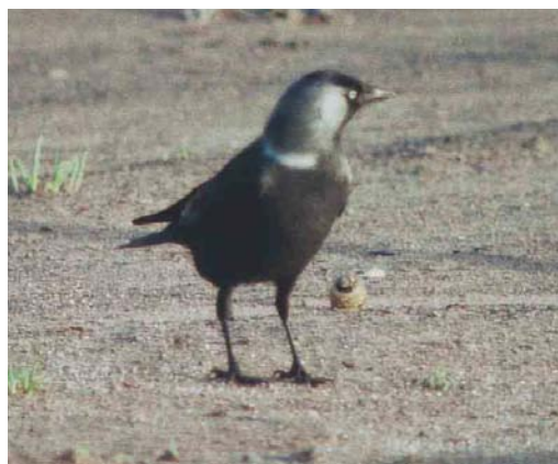
249 Russian Jackdaw / Russische Kauw Corvus monedula soemmerringii , Veendam, Groningen, Netherlands, 3 February 1988. Very contrasting bird with long, broad and white collar, very pale nape and ear coverts and almost black underparts. These features make it very likely that this is an eastern soemmerringii , probably a rare vagrant to the Netherlands.

all other field marks show overlap with monedula . Given these findings, it might be considered to combine at least the western populations of soemmerringii with monedula and restrict soemmerringii to the dark-bodied populations previously named as 'collaris', 'pontocaspicus' and 'ultracollaris'. A result of such a decision would be that many 'eastern jackdaws' could be quite easily distinguished from spermologus by their pale or white neck-patch and collar and the tone of their underparts combined with the vague mottling, and that 'true' soemmerringii would become a real vagrant in western Europe for which acceptable records need thorough documentation. This said, it is obvious that more study is needed to establish the actual range and geographical variation of the various populations of soemmerringii , of which even the easternmost could reach western Europe since they are the most migratory.