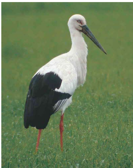
324 Zwartsnavelooievaar / Oriental Stork Ciconia boyciana , adult, Wieringermeer, Noord-Holland, mei 2003