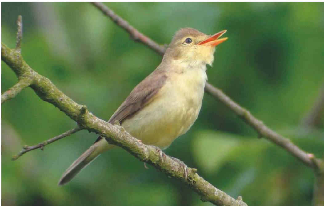
309 Orpheusspotvogel / Melodious Warbler Hippolais polyglotta , Zoetermeer, Zuid-Holland, 19 juni 2003