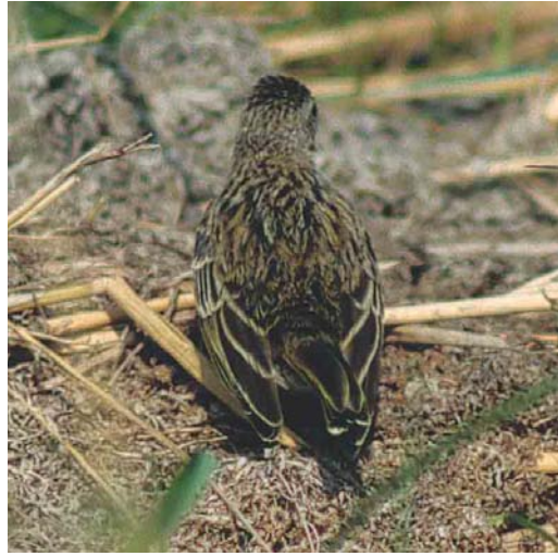
Mystery photograph VIII (July)

only one species shows a very neat and narrow black tail-band, dark outer webs of the inner primaries (resulting in the absence of an obvious pale window), largely unmarked underwings and rump, a pale shade of grey on its mantle and dark grey legs as in the mystery photograph. This is Audouin's Gull L audouinii and, in addition to these plumage characters, the long-winged appearance supports this identification.