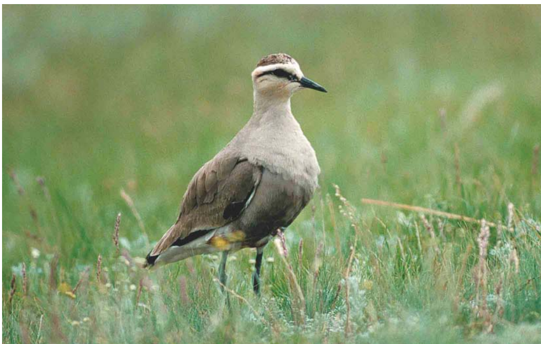
272 Sociable Lapwing / Steppekievit Vanellus gregarius , female, Korgalzhyn, Tengiz, Kazakhstan, 26 May 2003