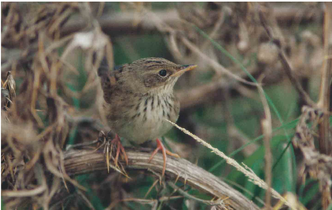
254 Kleine Sprinkhaanzanger / Lanceolated Warbler Locustella lanceolata , Zeebrugge, West-Vlaanderen, 7 oktober 1996 ( Kris De Rouck )