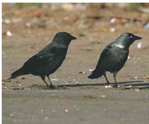
236 Nordic Jackdaw / Corvus monedula monedula , Wijster, Drenthe, Netherlands, 11 January 2003 ( Rudy Offereins ). Typical bird with silvery collar and plumbeous grey underparts, mantle and scapulars, latter contrasting with dark wings. Ear-coverts and nape are paler than in adult-winter Common Jackdaw C m spermologus . Note also faint dark mottling on underparts. 'Scaly' underparts and particularly scapulars are not this obvious in every monedula . 237 Nordic Jackdaws / Noordse Kauwen Corvus monedula monedula , Wijster, Drenthe, Netherlands, 17 January 2003 ( Rudy Offereins ). Note differences in shape and intensity of collar and similarity in tone of underparts, with faint dark mottling. 238 Nordic Jackdaw / Noordse Kauw Corvus monedula monedula , Wijster, Drenthe, Netherlands, 17 January 2003 ( Rudy Offereins ). Although this bird shows no collar, the plumbeous grey underparts with faint mottling and scapulars clearly point to monedula . 239 Nordic Jackdaws / Noordse Kauwen Corvus monedula monedula , Wijster, Drenthe, Netherlands, 16 December 2001 ( Rudy Offereins ). Bird on the right is a classic individual. Bird on the left is a first-winter because of the brown tinge in the wing-feathers and hardly visible brown iris; it shows a faint collar and is therefore probably monedula .

subspecies (Cramp & Perrins 1994), a few remarks can be made. First-winter birds can generally be identified by the brownish-tinged iris and juvenile dull-brown primaries, secondaries and tail whereas adult birds have shiny black feathers (Voous 1960, Cramp & Perrins 1994). The field marks to identify the various subspecies in first-winter plumage are more subtle. Monedula can be told from the almost uniform grey-black spermologus by its paler grey under-