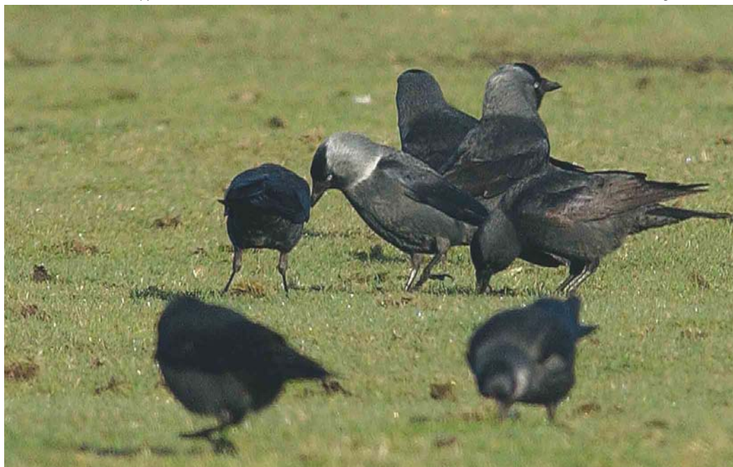
242 Nordic Jackdaw / Noordse Kauw Corvus monedula monedula (centre), with Common Jackdaws / Kauwen C m spermologus , Julianadorp, Noord-Holland, Netherlands, 10 February 2003. This bird is photographed in bright sunlight, which probably exaggerates the pale collar. The rather thin collar, pale underparts and mantle are typical for monedula but it could be rather difficult to rule out western soemmerringii .

Being clinal, the variation in the collar in monedula and soemmerringii is enormous. A distinctive trend in Scandinavia is that the silvery collar in monedula gradually darkens towards the west and south-west and the average size as well as the frequency of occurrence of the white neck-patch gradually decreases until this character entirely disappears in spermologus (Voipio 1969). The same trend is also noticeable from