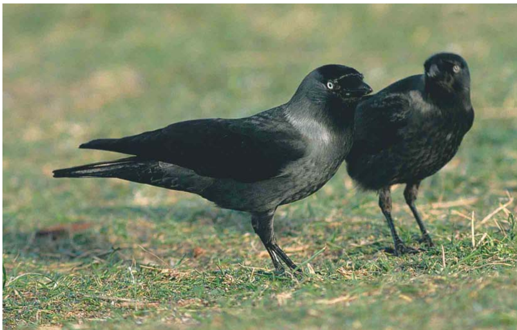
246 Common Jackdaws / Kauwen Corvus monedula spermologus , Scheveningen, Zuid-Holland, Netherlands, 6 January 1999 (Arnoud B van den Berg). Note that bright sunlight is enhancing contrasts.

The occurrence of both eastern subspecies in the Netherlands seems largely restricted to the higher (sand)grounds of the east and south. In lower areas, spermologus is much more numerous (cf Jukema & Rijpma 1997, Bijlsma et al 2000). Groups of jackdaws can be encountered, often in the company of Rooks, on intensively used grassland or arable land. Large groups of jackdaws can be seen on rubbish-tips, such as the VAM