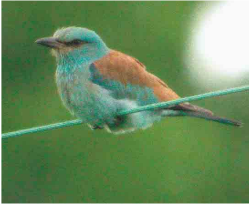
319 Scharrelaar / European Roller Coracias garrulus , Frenois, Luxembourg, 25 mei 2003 (Marc Ameels)