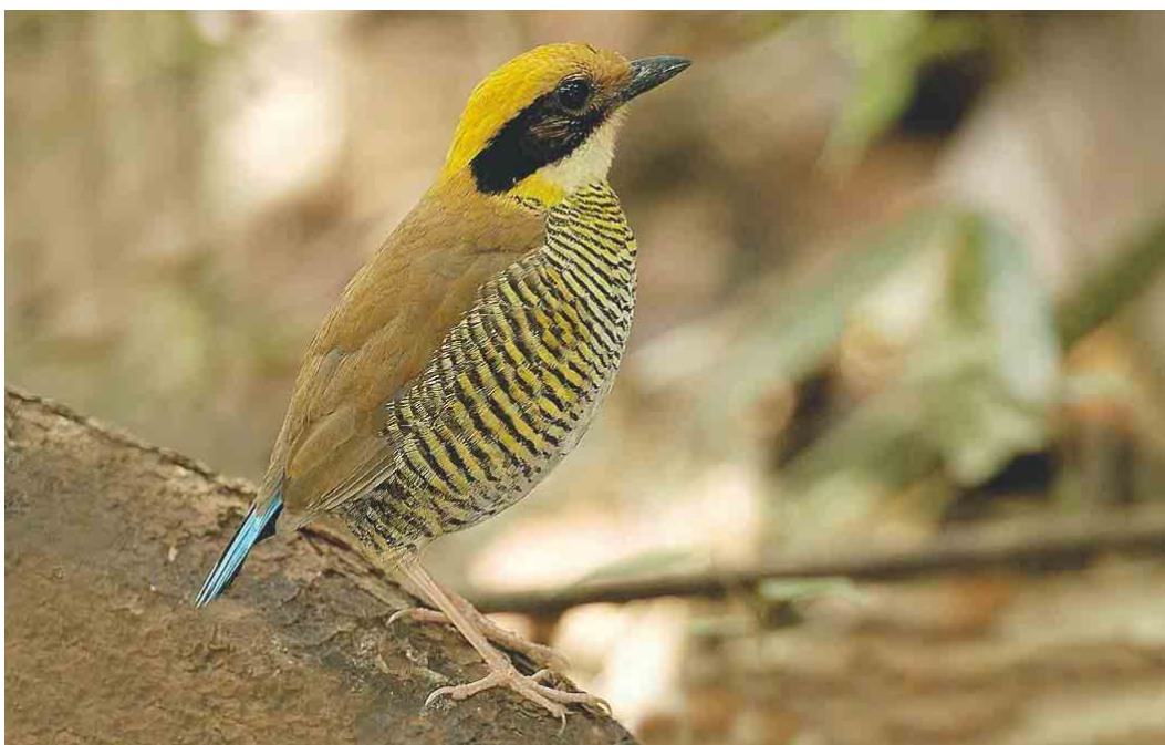
269 Gurney's Pitta / Gurneys Pitta Pitta gurneyi , female, Khao Nor Chuchi, Khao Pra-Bang Khram reserve, Thailand, 4 April 2003 (Kanit Khanikul)