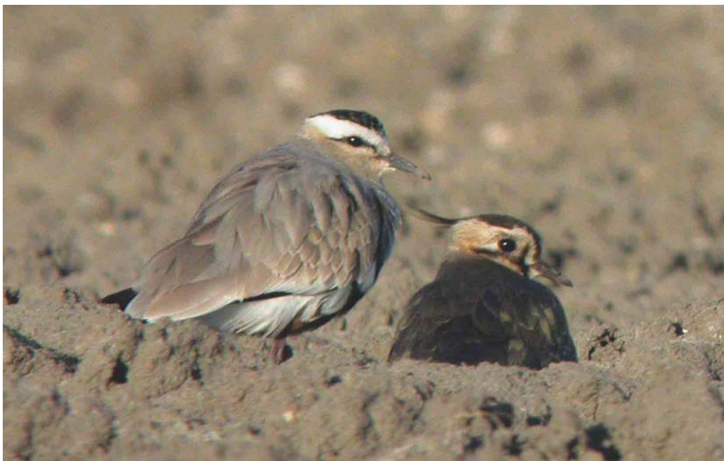
273 Sociable Lapwing / Steppekievit Vanellus gregarius , with Northern Lapwing / Kievit V vanellus , Müntschemier, Bern, Switzerland, 14 March 2003 (Adrian Jordi) cf Dutch Birding 25: 187, 2003