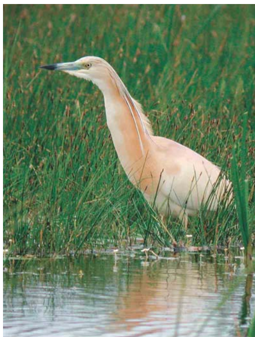
276 Western Reef Egret / Westelijke Rifreiger Egretta gularis , Praia, Santiago, Cape Verde Islands, 12 April 2003 277 Squacco Heron / Ralreiger Ardeola ralloides , Værnengene, Vestjylland, Denmark, 5 June 2003 278 Dalmatian Pelican / Kroeskoppelikaan Pelecanus crispus , Lesvos, Greece, May 2003