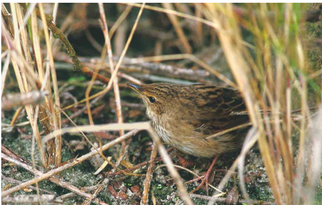
256 Kleine Sprinkhaanzanger / Lanceolated Warbler Locustella lanceolata , Knokke-Heist, West-Vlaanderen, 1 oktober 2000