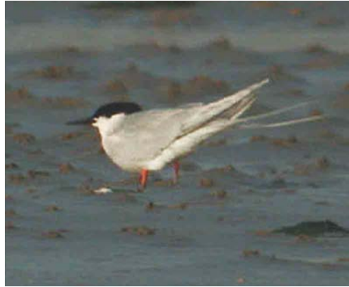
320 Dougalls Stern / Roseate Tern Sterna dougallii , Zeebrugge, West-Vlaanderen, 16 juni 2003

Falco vespertinus over Poederlee, Antwerpen; op 15 mei was kortstondig een vrouwtje aanwezig bij Verrebroek; op 5 juni werd er één opgemerkt te Kalmthout; op 6 juni waren er waarnemingen te Tielen, Antwerpen, en Rochefort, Luxembourg; en op 15 juni vloog er één laag over De Gavers. Een mogelijke Sakervalk F cherrug werd op 15 juni gefotografeerd bij Geraardsbergen, Oost-Vlaanderen.