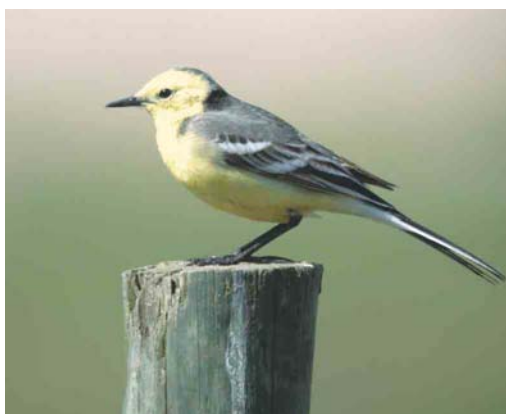
293 Magnificent Frigatebird / Amerikaanse Fregatvogel Fregata magnificens , Ilheu De Baluarte, Boavista, Cape Verde Islands, 6 April 2003 ( Nico Geiregat ) 294 Eurasian Crag Martin / Rotswaluw Hirundo rupestris , Lemland, Lågskär, Ahvenanmaa, Finland, 27 May 2003 ( Harry J Lehto ) 295 Booted Warbler / Kleine Spotvogel Acrocephalus caligatus , Ottenby, Öland, Sweden, 30 May 2003 ( Fredrik Hansson ) 296 Plain Martin / Vale Oeverzwaluw Riparia paludicola (left), with House Martin / Huiszwaluw Delichon urbica , Eilat, Israel, 1 July 2003 ( James P Smith ) 297 African Collared Dove / Izabeltortel Streptopelia roseogrisea , Bir Shalatein, Egypt, 14 May 2003 ( Tommy Frandsen/Cursorius ) 298 Citrine Wagtail / Citroenkwikstaart Motacilla citreola , male, Beijershamn, Öland, Sweden, 31 May 2003 ( Fredrik Hansson )