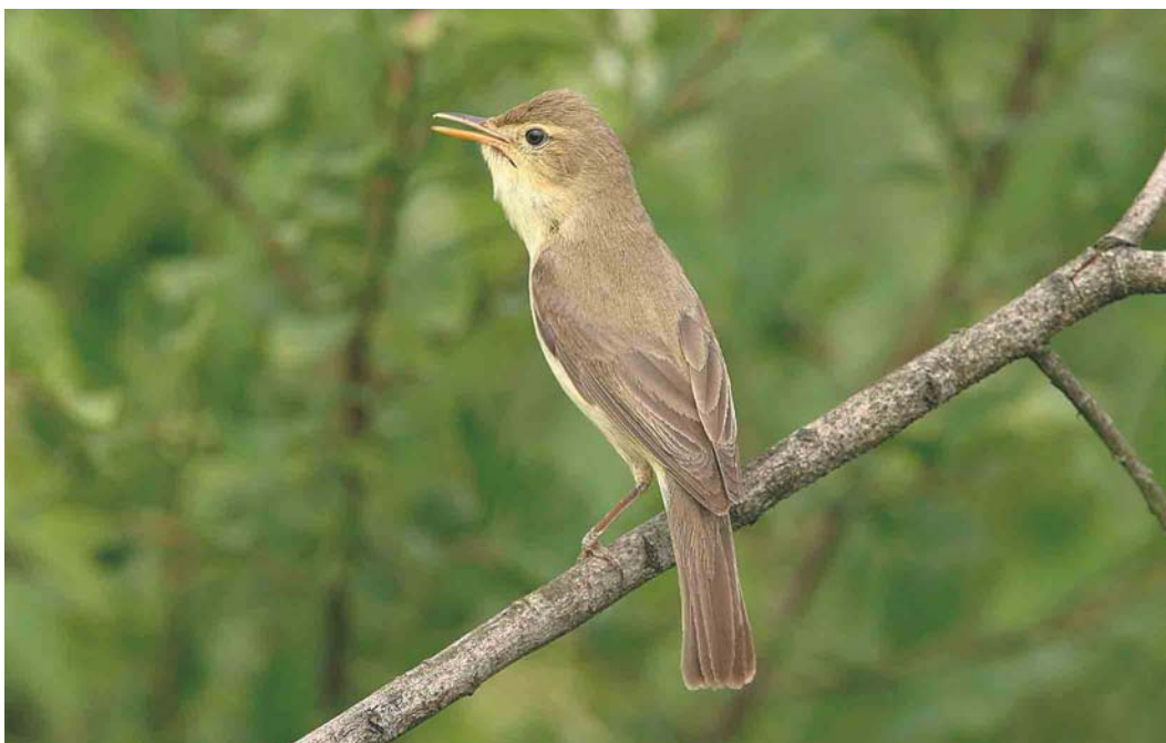
308 Orpheusspotvogel / Melodious Warbler Hippolais polyglotta , Mariapeel, Limburg, 14 juni 2003