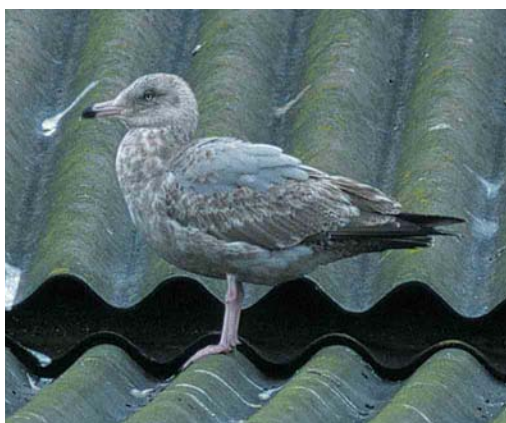
262 American Herring Gull / Amerikaanse Zilvermeeuw Larus smithsonianus , first-winter, Afurada, Porto, Portugal, 1 April 2001 ( Visa Rauste ). Note virtually wholly dark tail, 'Venetian blind' effect on inner primary window, bordered by pronounced broken terminal bar. 263 American Herring Gull / Amerikaanse Zilvermeeuw Larus smithsonianus , second-winter, Matosinhos, Porto, Portugal, 30 March 2001 ( Christian Cederroth & Cecilia Johansson ). Note complete row of dark greater coverts, virtually completely blackish tail and dark shawl. 264 American Herring Gull / Amerikaanse Zilvermeeuw Larus smithsonianus , second-winter, Matosinhos, Porto, Portugal, 30 March 2001 ( Christian Cederroth & Cecilia Johansson ). Note densely barred undertail-coverts, dark breast and belly and subdued brownish inner primary window. 265 American Herring Gull / Amerikaanse Zilvermeeuw Larus smithsonianus , second-winter, Matosinhos, Porto, Portugal, 30 March 2001 ( Theo Bakker/Cursorius ). Note large body, pale grey upperparts, clouded grey-brown underparts and markedly two-toned bill.

tic Gull L fuscus tend to be smaller and comparatively narrower- and longer-winged; odd individuals with largely dark tails are a pitfall but the underparts tend to be coarsely streaked and mottled dark brown, rather than uniformly clouded; usually they lack an obvious pale mid-wing window and dense barring on the upper- and undertail-coverts, and develop less pale on the bill-base. Pontic Gull L cachinnans and nominate Michahellis , although of similar size as smithsonianus , can easily be eliminated by their largely