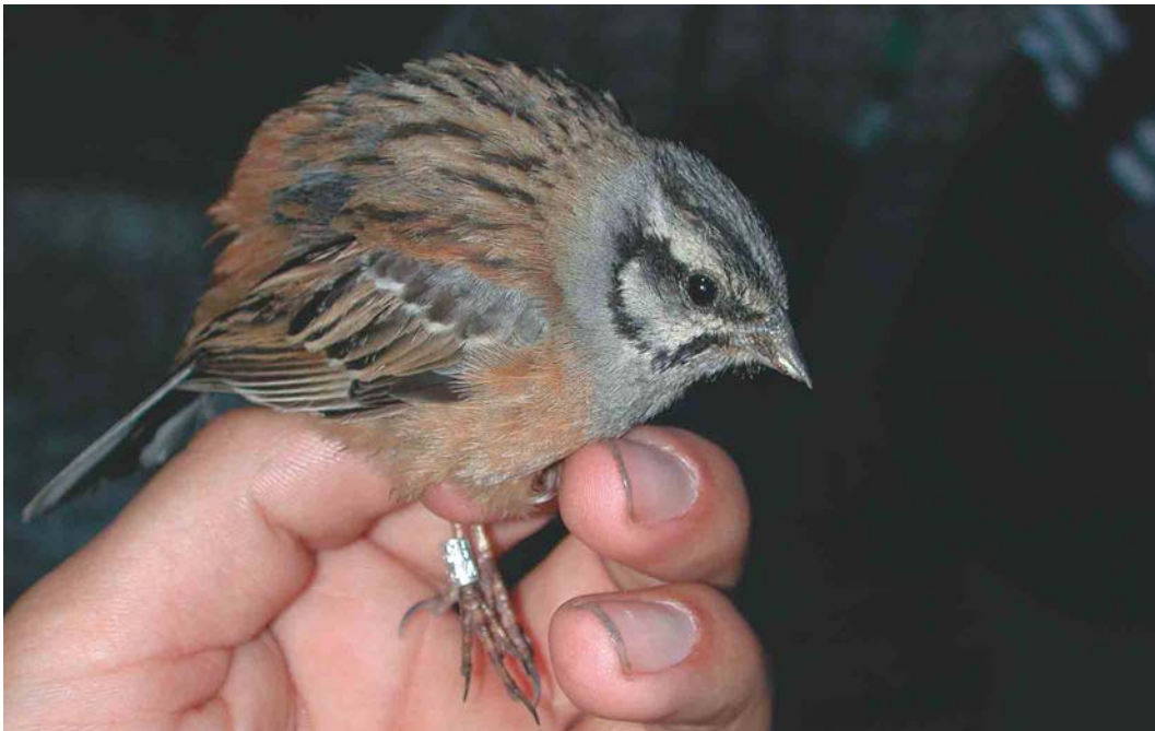
289 Rock Bunting / Grijze Gors Emberiza cia , first-summer male, Gedser, Falster, Denmark, 1 June 2003