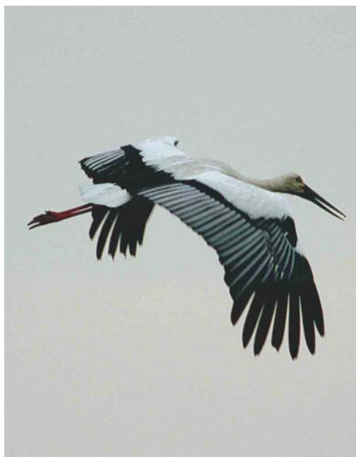
325 Zwartsnavelooievaar / Oriental Stork Ciconia boyciana , adult, Wieringermeer, Noord-Holland, 24 mei 2003

Ooievaar beschouwd. De soort is zwaar beschermd en wordt maar in zeer kleine aantallen in gevangenschap gehouden. In 1987 ging het wereldwijd om 105 vogels die legaal in gevangenschap werden gehouden, waarvan 85 in Azië, 17 in Europa en drie in Noord-Amerika (Hong Kong Bird Rep 1990: 126-148; Dutch Birding 15: 224-225, 1993). In een poging om te achterhalen wat de herkomst van het exemplaar in de Wieringermeer kon zijn, werd contact gezocht met verschillende vogelparken. Vanuit Vogelpark Walsrode, Niedersachsen, Duitsland, werd gemeld dat een geringd vrouwtje (de moeder van c 30 uitgebroede jongen) met een open ring was ontsnapt in het najaar van 2002. In Walsrode bevond zich het enige broedpaar in gevangenschap van Europa en zijn vanaf 1987 jarenlang jongen uitgebroed; in mei 2003 waren echter nog slechts twee (gepaarde) vogels in het park aanwezig (Dieter Rinke in litt). In Parc Paradisio in Cambron, Hainaut, België, worden sinds ten minste 1998 twee exemplaren gehouden; deze vogels waren ongeringd maar wel voorzien van een (niet-zichtbare) chip. Op 17 januari 2003 ontsnapte hier een vrouwtje dat in 1994 in Tokio, Japan, in gevangenschap was uitgebroed. Deze vogel werd nog twee weken in de omgeving van het park gezien en dook vier weken later op in Oost-Vlaanderen en weer twee weken later over de grens bij Rozendaal, Noord-Brabant (Steffen Patzwahl in litt).