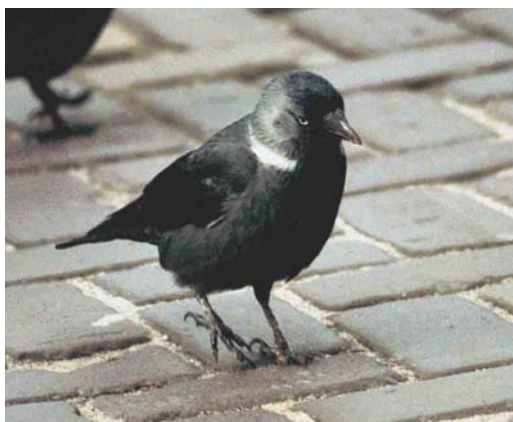
248 Russian Jackdaw / Russische Kauw Corvus monedula soemmerringii , Leiden, Zuid-Holland, Netherlands, January 1995 (Teus J C Luijendijk). Main feature of this bird is the long and overall white collar. It is likely that this bird belongs to the western populations of soemmerringii because of the plumbeous grey underparts and mantle.