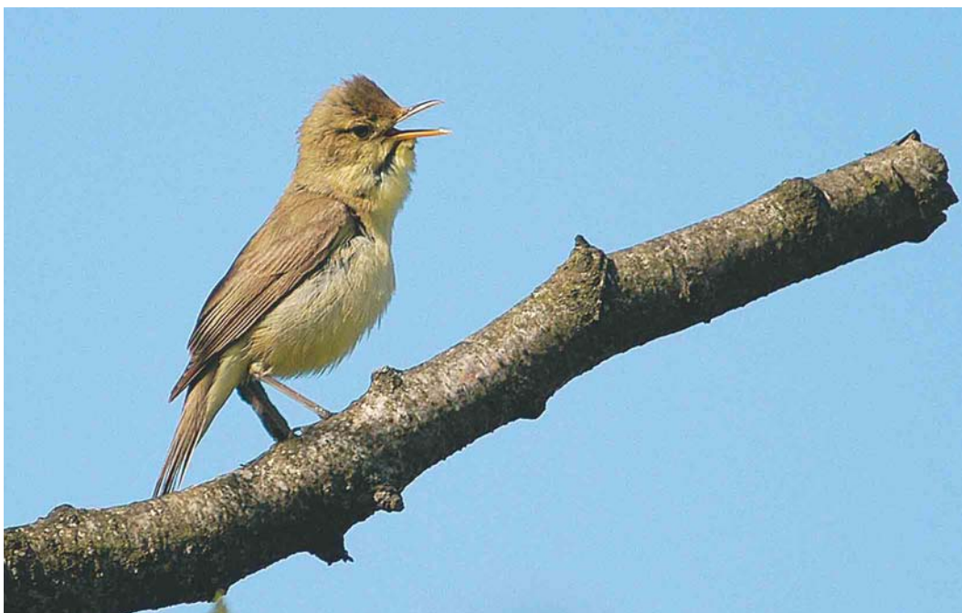
283 Melodious Warbler / Orpheusspotvogel Hippolais polyglotta , Mariapeel, Limburg, Netherlands, 15 June 2003