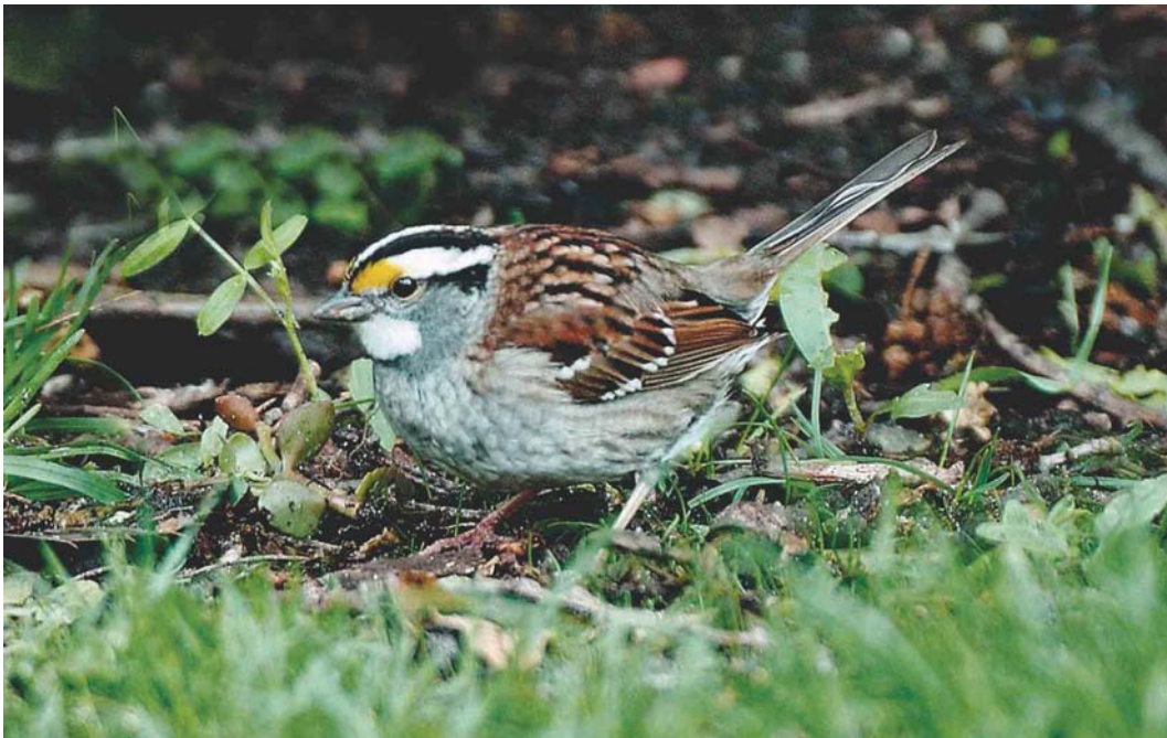
291 White-throated Sparrow / Witkeelgors Zonotrichia albicollis , Stapleton Woods, Wirral, England, May 2003