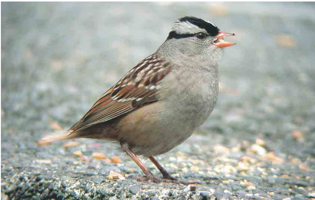
290 White-crowned Sparrow / Witkruingors Zonotrichia leucophrys , Durseey Sound, Cork, Ireland, May 2003