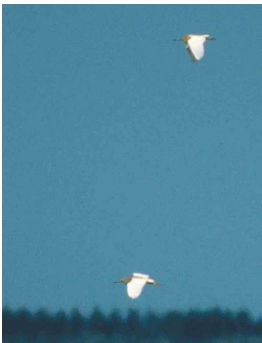
302 Ralreigers / Squacco Herons Ardeola ralloides , Ezumakeeg, Friesland, 9 juni 2003

op 26 juni bij Katwijk aan Zee, Zuid-Holland. De grootste deceptie op determinatiegebied dit voorjaar was het vermeende vrouwtje Steppekiekendief Circus macrourus dat vanaf 11 juni op het Deelensche Veld verbleef. Hoewel er her en der al twijfel was, werd de vogel pas op 25 juni definitief ontmaskerd als Grauwe Kiekendief C. pygargus ('uiteraard' door buitenlandse experts). Dit geeft weer eens aan hoe moeilijk het is om 'ringtail'-kiekendieven op naam te brengen. Tot begin juni werd nog een klein aantal doortrekkende Grauwe Kiekendieven gemeld. Kleine Aquila -arenden werden waargenomen op 16 mei op Texel en op 18 mei in de Oostvaardersplassen. Een gefotografeerde arend op 2 juni bij Finsterwolde, Groningen, bleek een sub-adulte Schreeuwarend A. pomarina . Op 11 mei werd een donkere vorm Dwergarend Hieraetus pennatus in gezelschap van twee Zwarte Wouwen en een Buizerd Buteo buteo gezien bij 's-Gravenpolder, Zeeland. Verder waren er meldingen van Dwergarend op 28 mei bij Almere, op 30 mei in de Weerribben, Overijssel, op 31 mei bij Nieuwer-ter-Aa, Utrecht, en op 1 juni over Rijswijk, Zuid-Holland. Op 19 juni vloog een lichte vorm een kwartiertje boven de Plasserwaard bij Opheusden, Gelderland – lang genoeg om gefotografeerd te worden. Verspreid over de periode passeerden nog enkele 10-tallen Visarenden Pandion haliaetus . In de Oostvaardersplassen hebben in maart twee vogels aan een nest gebouwd maar na korte tijd bleef daar