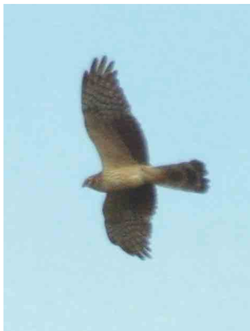
321 Grauwe Kiekendief / Montagu's Harrier Circus pygargus, eerste-zomer vrouwtje, Deelensche Veld, Hoge Veluwe, Gelderland, 21 juni 2003