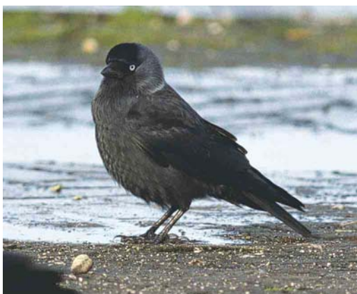
243 Probable Nordic Jackdaw / Noordse Kauw Corvus monedula monedula , Lauwersoog, Groningen, Netherlands, 29 November 2000 (Rudy Offereins). Uniformly coloured bird with faint silvery collar. Such birds could very well originate from the intergradation zone between Common Jackdaw C m spermologus and monedula , sometimes referred to as C m 'turrium' .

eastern Europe towards the west (Glutz von Blotzheim & Bauer 1991). Furthermore, there are individuals possessing no patch or collar or just a vague one. This is more often the case in monedula than in soemmerringii , and these are relatively often females (Voous 1960, Voipio 1969). In southern Finland, the average size of the white patch in the foreneck increases from south-west to north-east and, especially, east. The average size of this patch in the easternmost Finnish