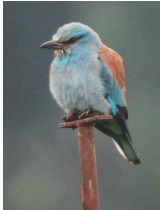
285 Lesser Grey Shrike / Kleine Klapekster Lanius minor , Kerzers, Fribourg, Switzerland, 14 May 2003 ( Adrian Jordi ) 286 European Roller / Scharrelaar Coracias garrulus , Wauwiler Moos, Luzern, Switzerland, 13 May 2003 ( Adrian Jordi ) 287 Caspian Stonechat / Kaspische Roodborsttapuit Saxicola maura variegata , Skagen, Denmark, 18 May 2003 ( Ole Krogh ) 288 Thick-billed Warbler / Diksnavelrietzanger Acrocephalus aedon , Fair Isle, Shetland, Scotland, 16 May 2003 ( Deryk Shaw )