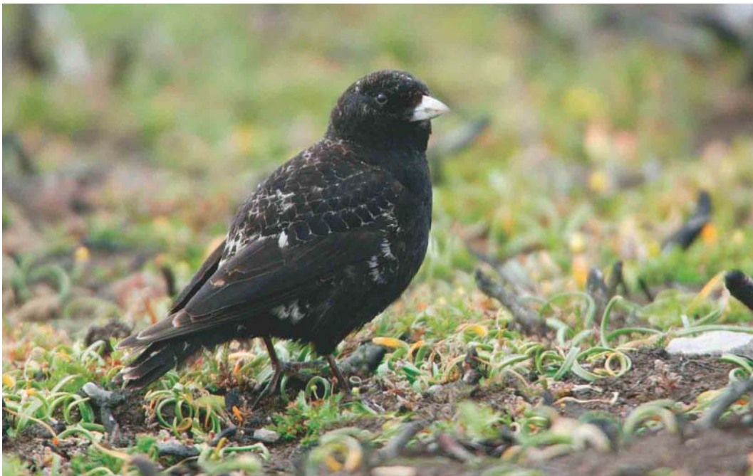
292 Black Lark / Zwarte Leeuwerik Melanocorypha yeltoniensis , male, South Stack, Anglesey, Wales, June 2003