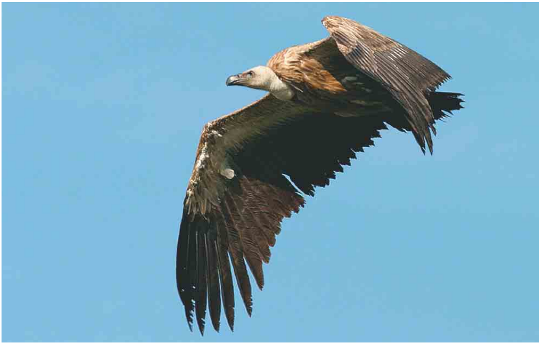
301 Vale Gier / Eurasian Griffon Vulture Gyps fulvus , onvolwassen, De Wijk, Drenthe, 19 juni 2003

Holland, en op 21 mei een groep van 11 (!) langs Bergen aan Zee, Noord-Holland. De vroegste Vale Pijlstormvogel P mauretanicus ooit vloog op 26 juni langs Camperduin. Vale Stormvogeltjes Oceanodroma leucorhoa vlogen op 3 mei langs Camperduin (één) en langs Huisduinen, Noord-Holland (twee). Kuifaalscholwers Stictocarbo aristotelis werden opgemerkt op 29 mei langs Breskens, Zeeland (twee), en op 31 mei één op het Kanaal door Zuid-Beveland, Zeeland. Op 10 en 15 mei werd een Woudaap Ixobrychus minutus gezien in polder IJdoorn bij Durgerdam, Noord-Holland, en op 28 juni werd er één gehoord langs de Oostvaardersdijk, Flevoland. Naast deze doorgegeven waarnemingen werd bekend dat bijvoorbeeld in oostelijk Noord-Brabant op vier locaties Woudapen verbleven, waarbij op één locatie zelfs drie roepende. Kwakken Nycticorax nycticorax werden gezien op 5 mei in de Duursche Waarden, Overijssel, op 30 mei bij Borssele, Zeeland, en op 9 juni over het Bovenwater, Flevoland. In juni tekende zich een ware influx van Ralreigers Ardeola ralloides af: na een vroege waarneming op 20 mei bij Westervoort, Gelderland, verschenen vogels op 3 juni bij Buitenpost, Friesland, op 5 juni bij Aldeboarn (Oldeboorn), Friesland, van 7 tot 15 juni in het Quackjeswater, Zuid-Holland, op 9 en 21 juni twee en op 24 juni één in de Ezumakeeg, Friesland, en op 12 juni in de Oostvaardersplassen, Flevoland. Koereigers Bubulcus ibis vlogen op 18 mei langs Terneuzen, Zeeland, en op 8 juni langs Huisduinen. In