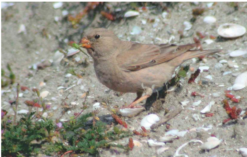
311 Woestijnvink / Trumpeter Finch Bucanetes githagineus , Maasvlakte, Zuid-Holland, 31 mei 2003