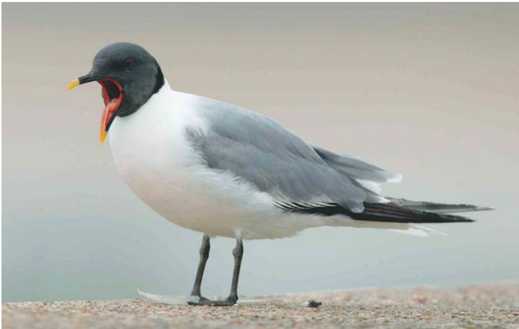
274 Sabine's Gull / Vorkstaartmeeuw Larus sabini , presumed second-summer, Lowestoft, Suffolk, England, June 2003 (Nigel Blake)