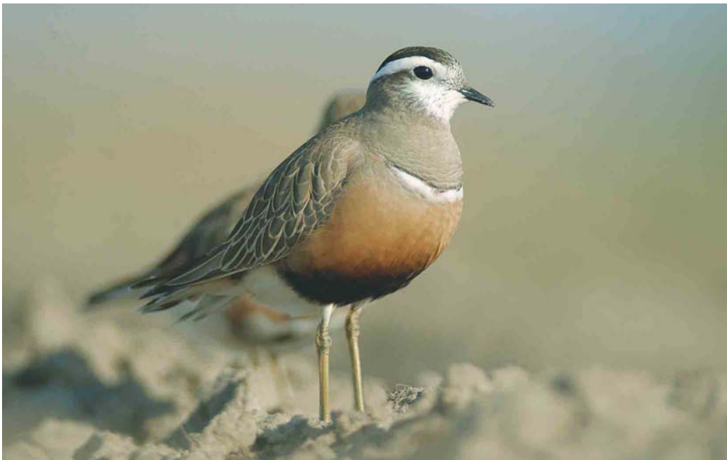
300 Morinelplevier / Eurasian Dotterel Charadrius morinellus , Texel, Noord-Holland, 10 mei 2003