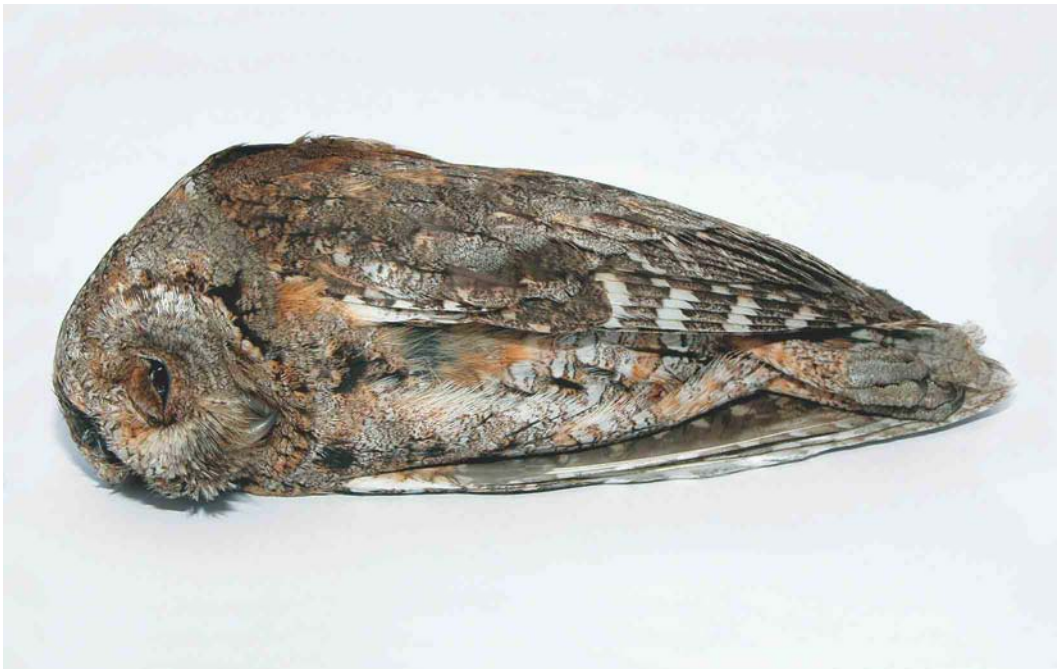
299 Dwergooruil / European Scops Owl Otus scops , Warns, Friesland, 8 mei 2003 ( Ep van Hijum )