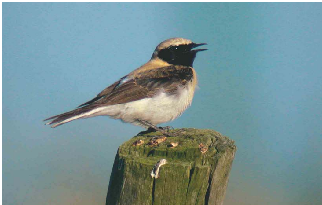
310 Oostelijke Blonde Tapuit / Eastern Black-eared Wheatear Oenanthe melanoleuca , eerste-zomer mannetje, Texel, Noord-Holland, 4 mei 2003 (Hans ter Haar)