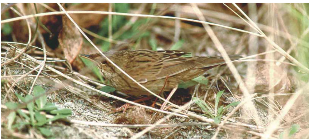
257 Kleine Sprinkhaanzanger / Lanceolated Warbler Locustella lanceolata , Knokke-Heist, West-Vlaanderen, 1 oktober 2000 (Kris De Rouck) 258 Kleine Sprinkhaanzanger / Lanceolated Warbler Locustella lanceolata , Knokke-Heist, West-Vlaanderen, 1 oktober 2000 (Koen Verbanck) 259 Kleine Sprinkhaanzanger / Lanceolated Warbler Locustella lanceolata , Knokke-Heist, West-Vlaanderen, 1 oktober 2000 (Kris De Rouck)