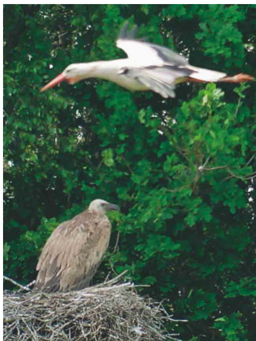
322 Vale Gier / Eurasian Griffon Vulture Gyps fulvus , onvolwassen, met Ooievaar / White Stork Ciconia ciconia , De Wijk, Drenthe, 4 juni 2003

Sinds de waarneming van een Vale Gier in april-mei 1993 nabij Durgerdam, Noord-Holland (de eerste twitchbare voor Nederland), is het aantal waarnemingen van deze soort in Nederland opmerkelijk toegenomen. Sinds 1997 is de soort jaarlijks vastgesteld, met zelfs groepen van zes, twee, 18 en 16 of meer in respectievelijk 1998, 2000, 2001 en 2002. Eén van de vogels in 2001 droeg een Spaanse ring. MARTEN VAN DIJL