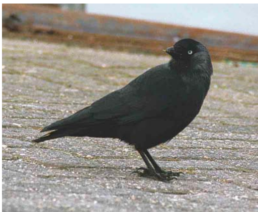
244 Common Jackdaw / Kauw Corvus monedula spermologus , Lauwersoog, Groningen, Netherlands, 5 February 2000. Typical adult-winter with overall dark plumage.

population is more than twice that of the westernmost population, whereas the whiteness of the collar increases from west to east. In the easternmost population, 'collarless' adults were virtually absent (Voipio 1969). The underparts and upperparts of monedula can also be variable. Most birds show blackish-grey to grey underparts and mantle, generally becoming darker towards the western parts of their range. Some monedula , however, can show evenly pale grey underparts, nape and ear-coverts, mantle and scapulars with contrasting black wings and crown, somewhat reminiscent of a miniature Hooded Crow C cornix . In these types of birds, the lack of a dark throat is very obvious. The geographical origin of these birds is, however, unclear. They may even come from within the range of soemmerringii . In the Netherlands, such birds usually show up from December onwards, about two months later than most monedula .