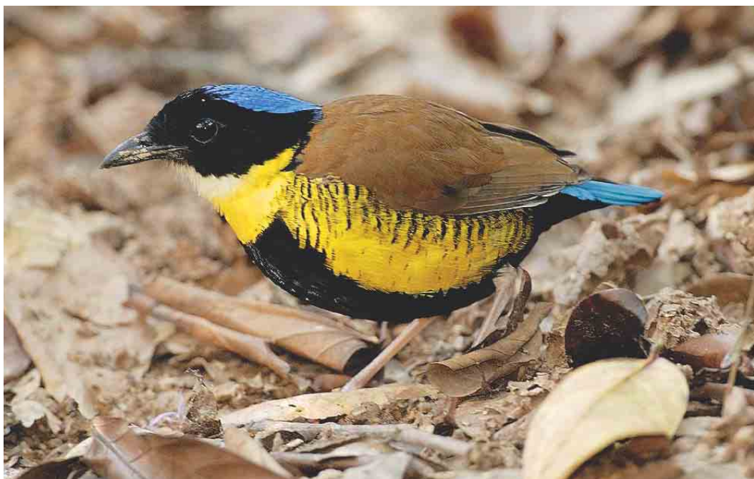
266 Gurney's Pitta / Gurneys Pitta Pitta gurneyi , male, Khao Nor Chuchi, Khao Pra-Bang Kham reserve, Thailand, 4 April 2003 (Kanit Khanikul)