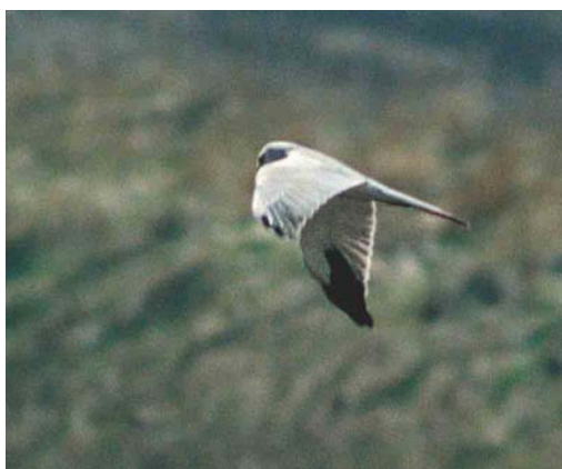
209 Dwergaalscholver / Pygmy Cormorant Microcarbo pygmeus , Eijsder Beemden, Limburg, 23 maart 2003 ( Karel Lemmens ) 210 Amerikaanse Smient / American Wigeon Mareca americana , mannetje, Ouderkerkerplas, Ouderkerk aan de Amstel, Noord-Holland, 6 april 2003 ( Jan den Hertog ) 211-212 Steppiekiekendief / Pallid Harrier Circus macrourus , mannetje, Breskens, Zeeland, 21 april 2003 ( Garry Bakker ) 213-214 Steppiekiekendief / Pallid Harrier Circus macrourus , mannetje, Eemshaven-Oost, Groningen, 16 april 2003 ( Eric Koops )