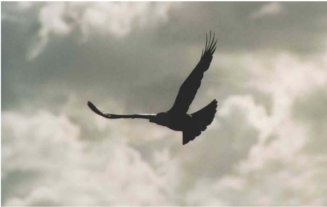
175-176 House Crow / Huis kraai Corvus splendens , adult, Hoek van Holland, Zuid-Holland, Netherlands, 4 April 2002 (Edwin Winkel)