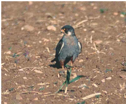
156-157 Red-footed Falcon / Roodpootvalk Falco vespertinus , first-summer male, Madria, Cyprus, 5 May 1997

Our notes are based on field experience in South Africa, on studies of skins of amurensis , and on field observations of several 1000s vespertinus in Italy, elsewhere in Europe and in the