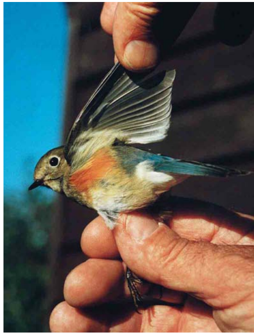
164-165 Blauwstaart / Red-flanked Bluetail Tarsiger cyanurus , eerstejaars mannetje, Kroonspolders, Vlieland, Friesland, 11 oktober 1999 (Gerrit Bochem)

KOP Grotendeels olijfbroin; voorhoofd, teugel en gebied onder oog iets lichter bruin. Oogring witachtig. BOVENDELEN Rug en mantel egaal olijfbroin, op stuit overgaand in blauwachtige bovenstaartdekveren. ONDERDELEN Borst donker olijfbroin. Flank oranje. Rest van onderdelen grotendeels crèmekleurig wit. Onderstaartdekveren witachtig. VLEUGEL Hand- en armpennen bruin met lichtere olijf-