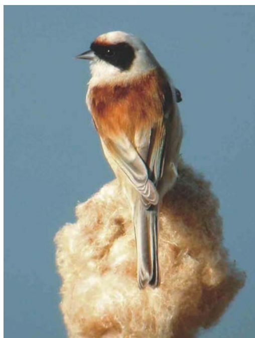
225 Buidelmees / Eurasian Penduline Tit Remiz pendulinus , Lier-Anderstad, Antwerpen, 23 maart 2003

bedroeg 136 bij Rijkevorsel, Antwerpen, op 5 april. Op 9 maart pleisterde een adulte Ringsnavelmeeuw L. delawarensis te Roksem, West-Vlaanderen, en op 24 maart was er kortstondig een adulte aanwezig te Bredene. De adulte Grote Burgemeester L. hyperboreus van Oostende werd op 1 maart voor het laatst opgemerkt. Op 15 maart werd een eerste-winter gezien bij Diepenbeek. Langs Knokke trokken op 13 april twee Reuzensterms Sterna caspia en op 20 april vloog een Lachstern Gelochelidon nilotica langs Koksijde, West-Vlaanderen.