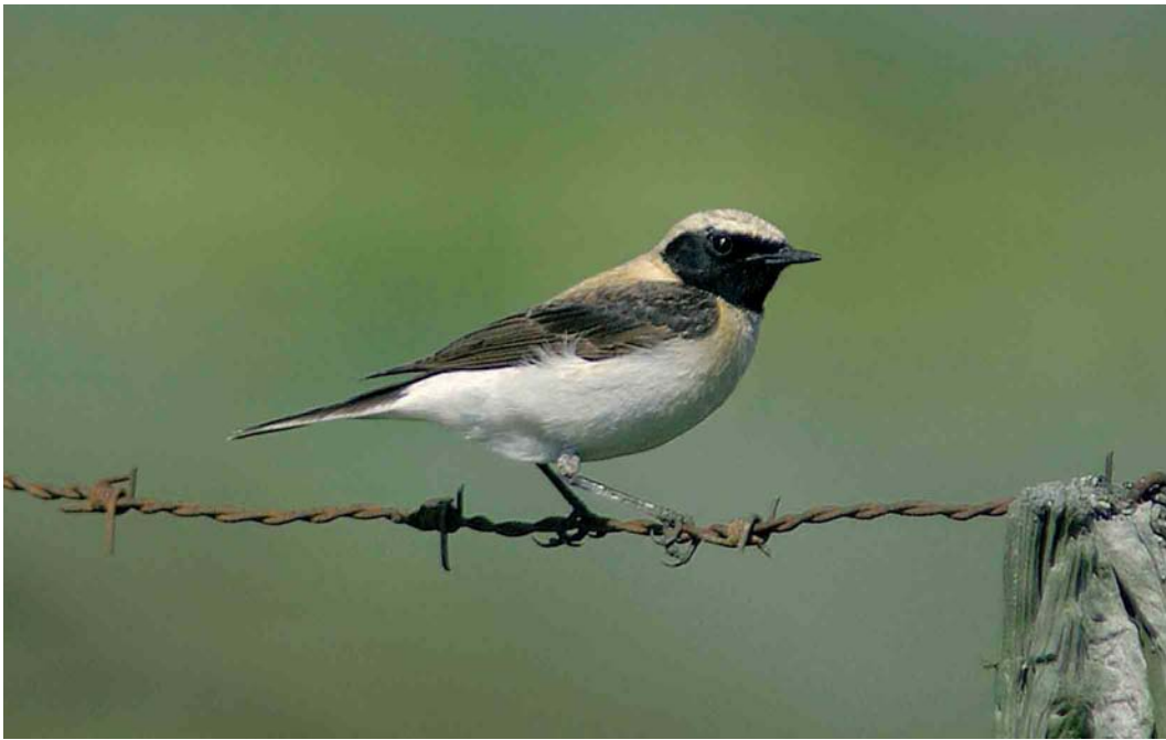
232-233 Oostelijke Blonde Tapuit / Eastern Black-eared Wheatear Oenanthe melanoleuca , eerste-zomer mannetje, Texel, Noord-Holland, 4 mei 2003