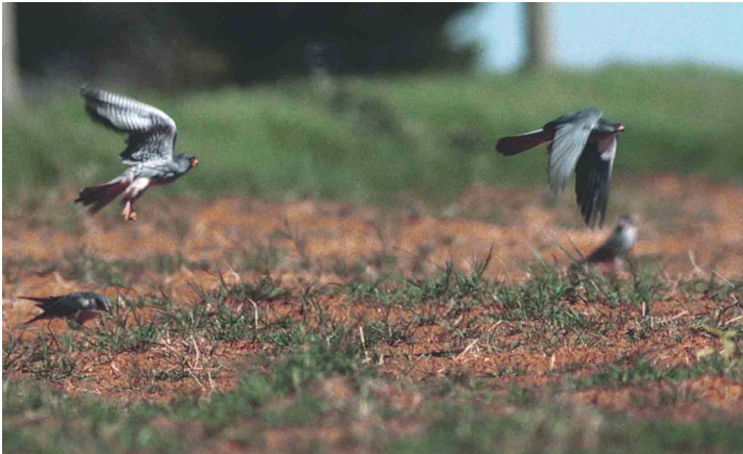
163 Amur Falcons / Amoeroodpootvalken Falco amurensis , second calendar-year male (left) and adult male, Wakkerstroom, Transvaal, South Africa, 19 March 1996. Note pale grey moulted adult-type rectrices and black marks on underwing-coverts. Note also very pale grey adult-like new underbody-feathers; in Red-footed Falcon F. vespertinus these would be darker.