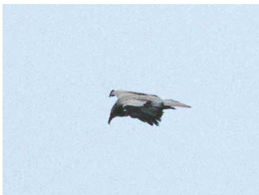
170-171 Aasgier / Egyptian Vulture Neophron percnopterus , adult, Epen, Limburg, 25 mei 2001

leerd zijn door de mond- en klauwzeer crisis (MKZ) die grote delen van Europa trof. Hierdoor werd het in onder andere Spanje nadrukkelijk verboden om slachtafval en kadavers in de open lucht te laten liggen en kunnen gieren getroffen zijn door voedselschaarste. Omdat de toename van het aantal waarnemingen van gieren in Nederland al van enkele jaren eerder stamt, is dit hooguit een additionele verklaring voor een fenomeen dat bredere oorzaken moet kennen.