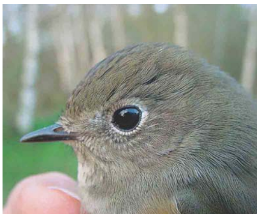
168 Blauwstaart / Red-flanked Bluetail Tarsiger cyanurus , eerstejaars, Groene Glop, Schiermonnikoog, Friesland, 5 november 2001

De determinatie als Blauwstaart was eenvoudig (zie de hierboven behandelde kenmerken van de