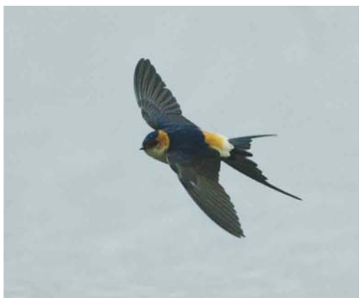
227-228 Roodstuitzwaluw / Red-rumped Swallow Hirundo daurica , Eijsder Beemden, Limburg, 19 april 2003

mei druppelden er opnieuw waarnemingen binnen. Pieter Duin en Eric Menkveld ontdekten op 2 mei een Roodstuitzwaluw boven de Geul op Texel, Noord-Holland, die tot 5 mei aanwezig bleef en vanaf 4 mei werd vergezeld door een tweede. Op 3 mei trokken er exemplaren over Middelburg, Zeeland, en langs de Vlinderbalg aan de oostkant van het Lauwersmeergebied, Groningen. Op 4 mei vlogen er nog exemplaren langs Breskens en langs Bakkeveen, Friesland, en op 12 mei was een exemplaar ter plaatse bij het Jaap Deensgat in de Lauwersmeer, zodat de teller half mei al op 14 stond.