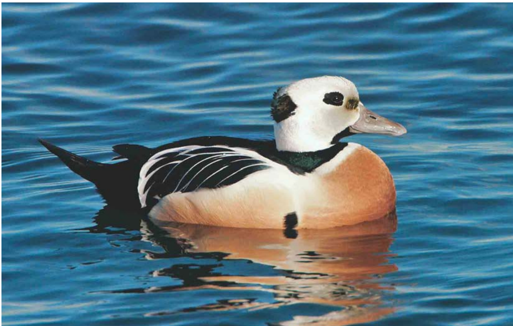
182 Steller's Eider / Stellers Eider Polysticta stelleri , adult male, Borgarfjörður Eystri, Iceland, 23 March 2003