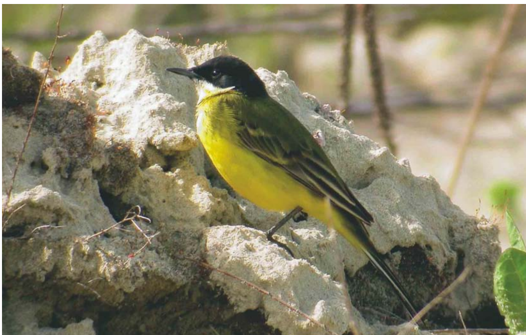
223 Gele kwikstaart / yellow wagtail Motacilla , mannetje, Koningshooikt, Antwerpen, 28 april 2003 (Kris De Rouck)