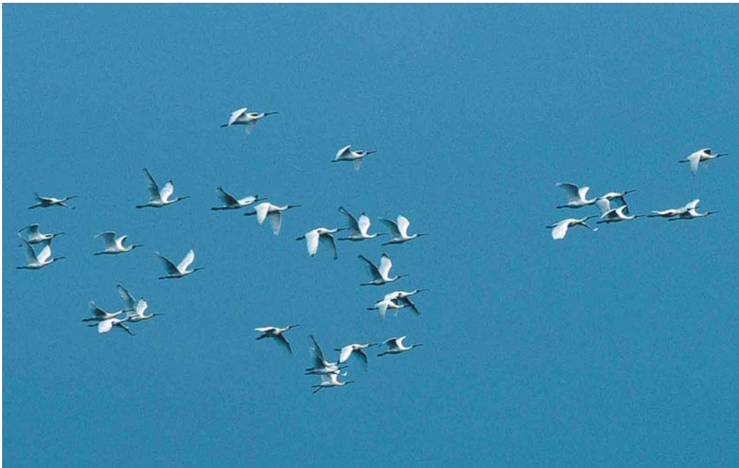
181 Black-faced Spoonbills / Kleine Lepelaars Platalea minor , Mai Po, Hong Kong, China, 3 March 2003 (Roef Mulder)