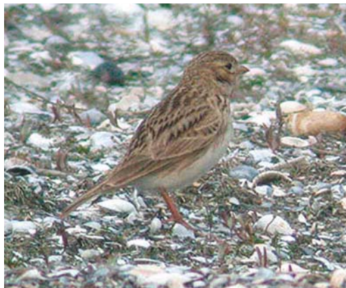
229 Kleine Kortteenleeuwerik / Lesser Short-toed Lark Calandrella rufescens, Zeebrugge, West-Vlaanderen, 27 april 2003