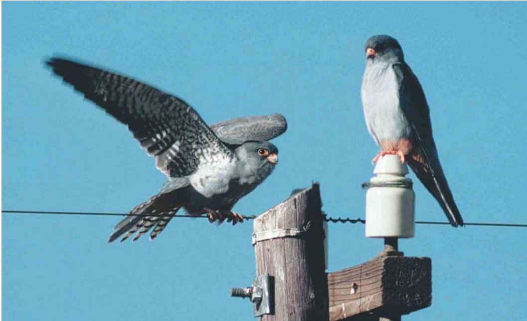
162 Amur Falcons / Amoeroodpootvalken Falco amurensis , second calendar-year male (left) and adult male, Boshof, Orange Free State, South Africa, 17 March 1996 ( Arnoud B van den Berg )