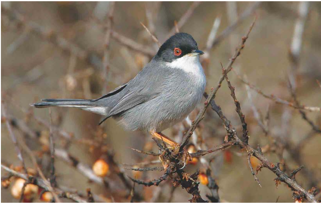
201 Sardinian Warbler / Kleine Zwartkop Sylvia melanocephala , male, Holme, Norfolk, England, 22 March 2003