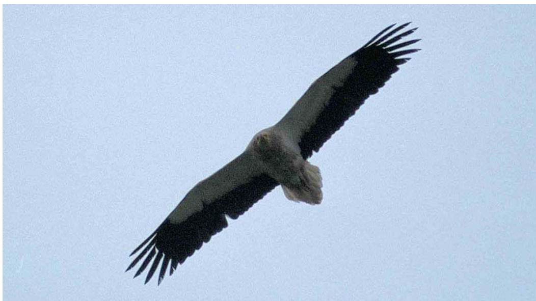
169 Aasgier / Egyptian Vulture Neophron percnopterus , adult, Epen, Limburg, 25 mei 2001

duidt op een adulte vogel. De vaalbruine vlek op de middelste dekveren van de bovenvleugel zou kunnen duiden op een niet geheel volwassen exemplaar maar deze vlek is ook vaak bij adulte vogels aanwezig (Forsman 1999, Ferguson-Lees & Christie 2001).