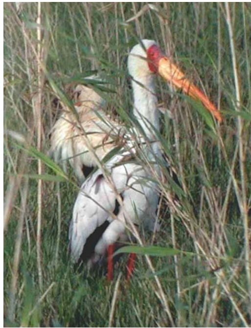
185 Montagu's Harrier / Grauwe Kiekendief Circus pygargus , dark-morph male, Belen, Spain, 13 April 2003 ( Simon Woolley ) 186 Yellow-billed Stork / Afrikaanse Nimmerzat Mycteria ibis , with White Stork / Ooievaar Ciconia ciconia , Casa de Bombas, Brazo de la Torre, Isla Mayor, Sevilla, Spain, 14 April 2003 ( Ricard Gutiérrez ) 187 Swinhoe's Storm-petrel / Chinees Stormvogeltje Oceanodroma monorhis , Eilat, 19 April 2003 ( James P Smith )