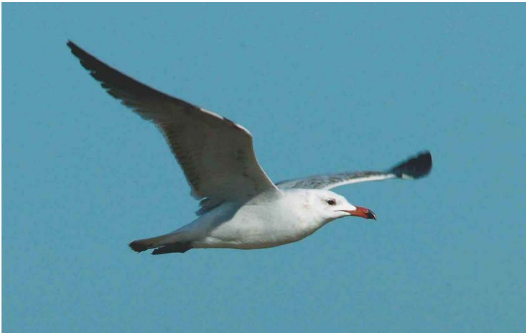
183 Audouin's Gull / Audouins Meeuw Larus audouinii , second-summer, Dungeness, Kent, England, 6 May 2003