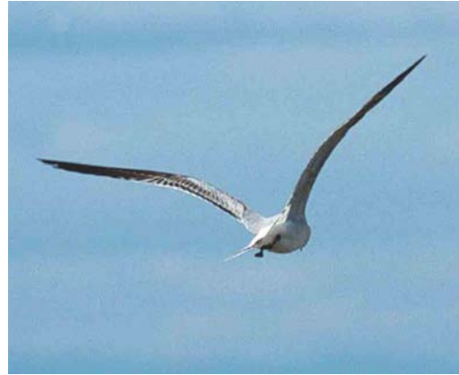
Mystery photograph VI (May)

breast and belly, while Cretzschmar's shows less contrast. In the mystery bird, a difference in colour can be seen between the submoustachial stripe and throat and the darker breast and belly. In Ortolan, the markings on the breast appear, unlike in Cretzschmar's, more as dots than as streaks. The crown-streaks tend to be more prominent in Ortolan than in Cretzschmar's. These crown-streaks border a patch of plain feathers creating a lateral crown stripe, which tends to be narrow in Ortolan. In Cretzschmar's, this lateral crown stripe is broader in front of the eye than in Ortolan and almost meeting above the bill. The mystery bird seems to have dot-shaped markings on its breast, obvious crown-streaks, reaching rather far downwards, creating a narrow supercilium. Furthermore, there is a range of even more variable subtleties in plumage differences. For instance, the dark malar stripe and markings on upper- and underparts tend to be more black-ish and stronger in Ortolan than in Cretzschmar's.