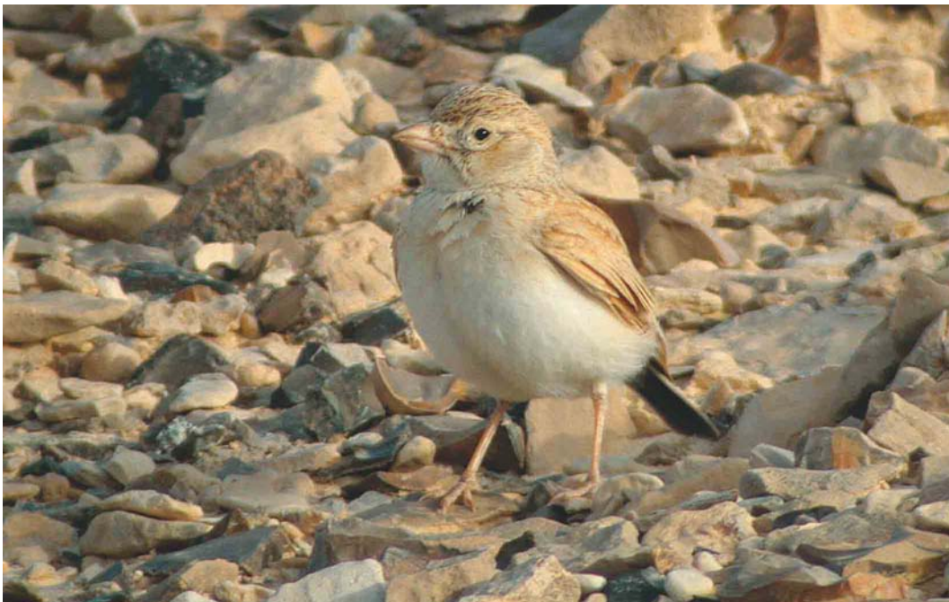
202 Dunn's Lark / Dunns Leeuwerik Eremalauda dunnii , Sede Boker, Israel, 6 April 2003 (James P Smith)