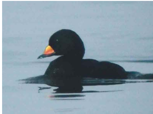
189 Presumed Short-billed Gull / vermoedelijke Amerikaanse Stormmeeuw Larus canus brachyrhynchus , adult, Praia da Vitoria, Terceira, Azores, 19 February 2003 ( Peter Alfrey ) 190 Bonaparte's Gull / Kleine Kokmeeuw Larus philadelphia , Calais, Pas-de-Calais, France, 3 May 2003 ( Jacques Leclercq ) 191 Yellow-billed Stork / Afrikaanse Nimmerzat Mycteria ibis , Casa de Bombas, Brazo de la Torre, Isla Mayor, Sevilla, Spain, 15 April 2003 ( Tomasz Kulakowski ) 192 Black Scoter / Amerikaanse Zee-eend Melanitta americana , adult male, Blåvands Huk, Ringkøbing, Jylland, Denmark, 28 March 2003 ( Ole Krogh )

26 April. The long-staying Western Reef Egret Egretta gularis gularis at Isla Mayor, Sevilla, Spain, was seen again at Entremuros on 14 April. Up to two Yellow-billed Storks Mycteria ibis were at Casa de Bombas, Brazo de la Torre, Isla Mayor, Sevilla, Spain, from February through April. From 14 April onwards, 100s of breeding Glossy Ibises Plegadis falcinellus were visible from Cerrado Garrido, Doñana, Sevilla. A total of 73 Black-faced Spoonbills Platalea minor died and 15-17 were treated and rescued during this winter's botulism outbreak at Tseng-wen estuary, Taiwan, which has been the wintering site of c 640 of the species' world population of 1074 (see www.hkbws.org.hk/bfs/index.html for further information). More than 100 were present at Mai Po, Hong Kong, China, in early March. Two unringed Lesser Flamingos Phoeniconaias minor were discovered at Fuente de Piedra, Málaga, Spain, on 22 March. In the Camargue, a pair was found in the colony of Greater Flamingos Phoenicopterus roseus at Étang du Fangassier on 17 April.