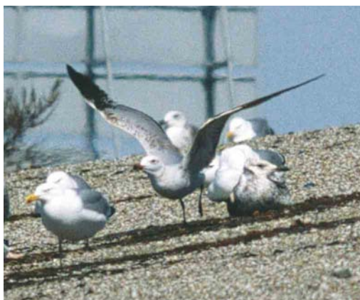
230-231 Audouins Meeuw / Audouin's Gull Larus audouinii , tweede-zomer, Neeltje Jans, Zeeland, 1 mei 2003

over de stormvloedkering weg. Ondanks verwoed zoeken in de verre omtrek werd de vogel niet teruggevonden. Niet in Nederland tenminste, want op 5 mei 2003 ontdekte David Walker, 'warden' van het bekende Dungeness Bird Observatory in Kent, Engeland, dezelfde vogel toen deze tijdens een zeevloed langsvloog. Anders dan in Nederland bleef de vogel hier wel geruime tijd aanwezig. De laatste waarneming bij Dungeness was in de late avond van 7 mei. Ongetwijfeld is dit de eerste maal dat één vogel in beide landen voor een eerste geval zorgde.