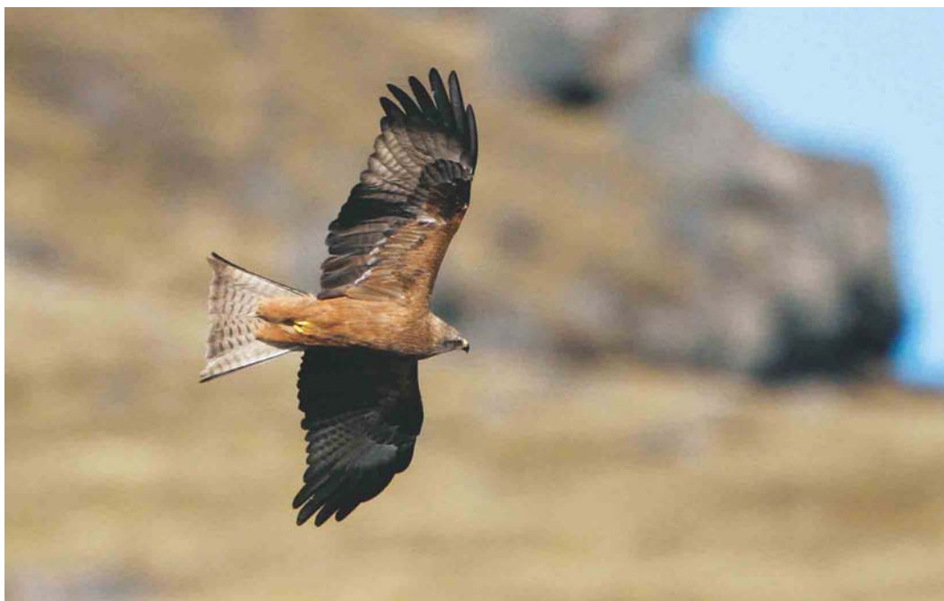
188 Black Kite / Zwarte Wouw Milvus migrans , Höfðabrekka, Mýrdal, Iceland, 11 April 2003

and the second stayed at Øster Hedekrog, Samsø, Jylland, from 27 April into May. In France, one was present at Bouin, Vendée, France, on 15-21 April. The male at Llanfairfechan, Gwynedd, Wales, first seen on 19 January 2001 remained this winter from 3 November 2002 to at least 18 April. The fifth or sixth White-winged Scoter M deglandi for Iceland was a male at Núpasveit from 6 April into May. The long-staying male Steller's Eider Polysticta stelleri first seen in January 1998 as the ninth for Iceland remained at Borgarfjörður Eystri. The fifth Hooded Merganser Lophodytes cucullatus for Iceland was an adult male at Reykjadalur from 18 April onwards. Several long-staying American Black Ducks Anas rubripes were reported during the period, eg, in Scilly on 7 April on St Martin's and on 14 April on Tesco and at Garður, Iceland, into May.