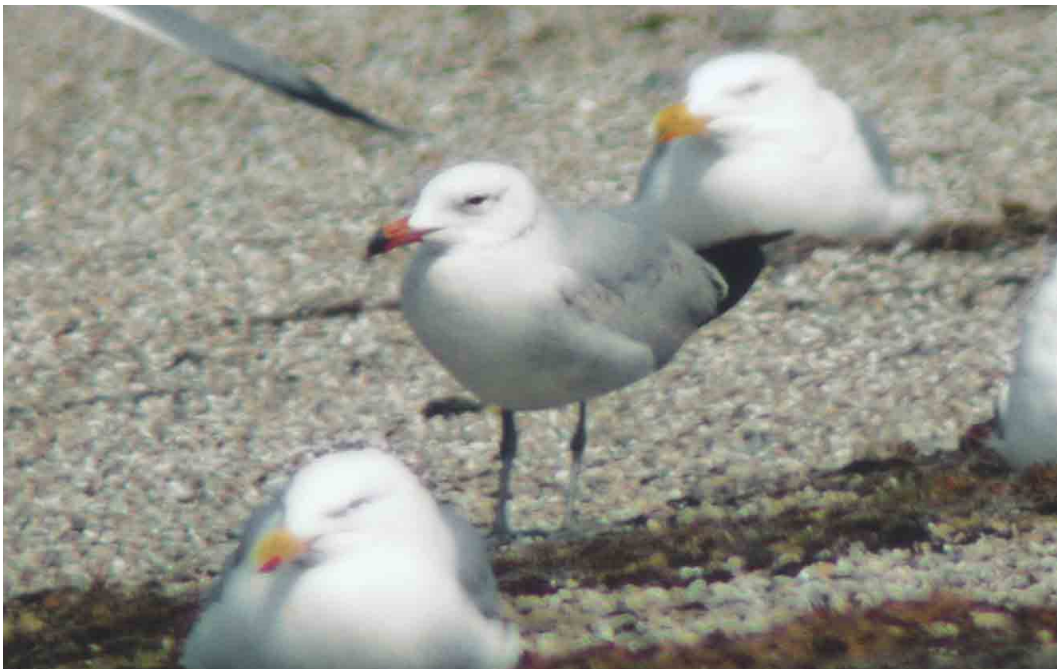
184 Audouin's Gull / Audouins Meeuw Larus audouinii , second-summer, Neeltje Jans, Zeeland, Netherlands, 1 May 2003