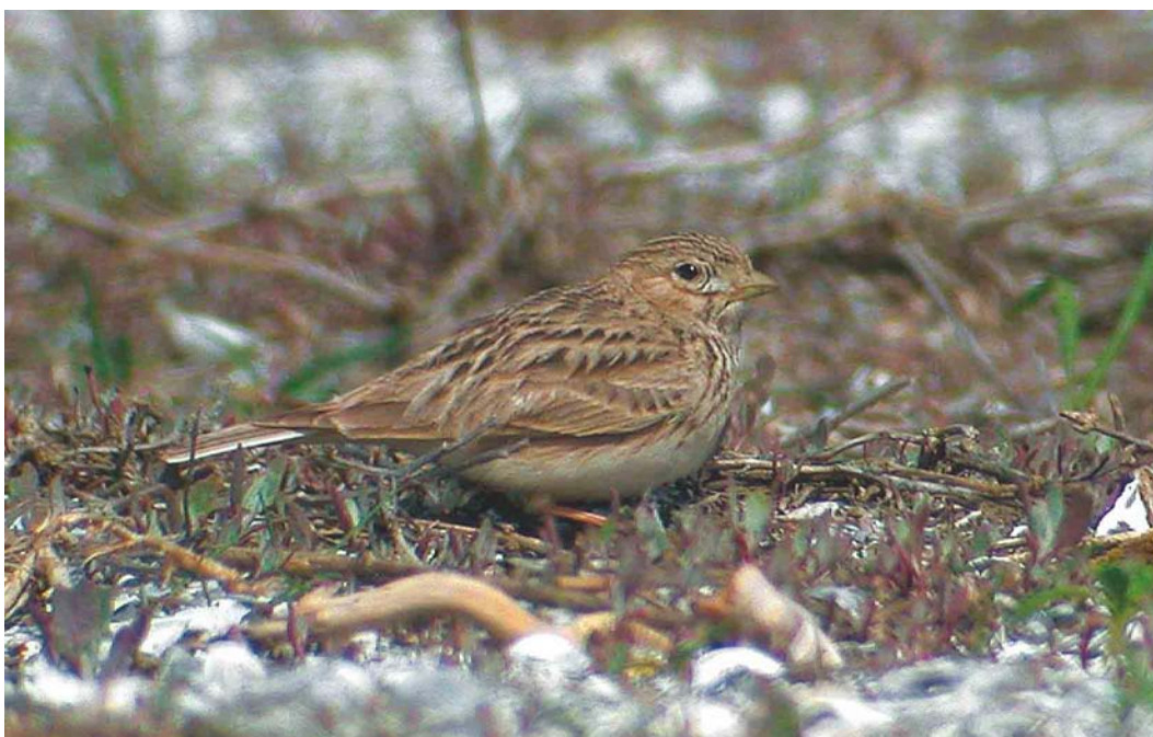
224 Kleine Kortteenleeuwerik / Lesser Short-toed Lark Calandrella rufescens , Zeebrugge, West-Vlaanderen, 27 april 2003