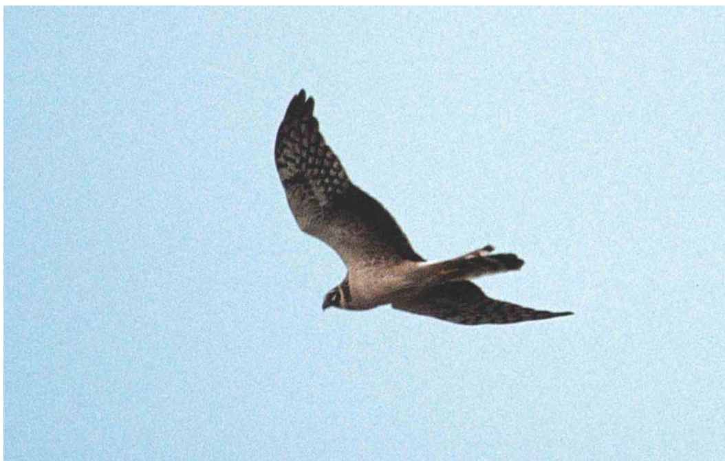
204 Steppekiekendief / Pallid Harrier Circus macrourus , Eemshaven-Oost, Groningen, 26 april 2003

Delta kwamen geen meldingen meer. Ongeveer 18 Zwarte Rotganzen B nigricans werden gezien, vrijwel alle in het Waddengebied. De Grote Tafeleend Aythya valisineria van het Noordhollands Duinreservaat bij Castricum werd voor het laatst gezien op 5 maart. Witoogeenden A nyroca zwommen op 4 en 5 maart bij Windesheim, Overijssel, van 23 maart tot 2 april op het Hijkerveld, Drenthe, van 30 maart tot 29 april op De Baend bij Well, Limburg, op 30 maart (een paar) bij Valkenswaard, Noord-Brabant, vanaf 21 april één, met op 26 april zelfs twee, in het Kromslootpark bij Almere, Flevoland, en op 28 april op de Landschotse Heide, Noord-Brabant. Op 7 maart dook een mannetje Ringsnaveleend A collaris op bij Windesheim. Op 2 april vloog een onvolwassen mannetje Koningseider Somateria spectabilis langs Bloemendaal aan Zee, Noord-Holland. Een mannetje Brilzee-eend Melanitta perspicillata vloog op 22 april langs de Zuidpier van IJmuiden, Noord-Holland. De Ouderkerkerplas, Noord-Holland, leverde al eerder Amerikaanse Smienten Mareca americana op; dit jaar verbleef er één van 6 tot 14 april. Een andere zwom van 30 maart tot 6 april weer in de Reeuwijkse Plassen, Zuid-Holland. Een mannetje Blauwvleugeltaling Anas discors vloog langs Camperduin, Noord-Holland, op 15 april. Van 7 tot 17 maart was een Amerikaanse Wintertaling A carolinensis te zien in de Prunjepolder. Op 20 maart werden ten noorden van de Brouwersdam, Zuid-Holland, c 600 Roodkeelduikers Gavia stellata geteld met daarbij twee