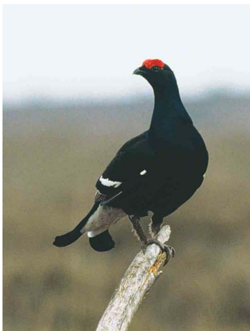
205 Slechtvalk / Peregrine Falcon Falco peregrinus , Hemwegcentrale, Amsterdam, Noord-Holland, 12 april 2003 206 Korhoen / Black Grouse Tetrao tetrix , mannetje, Holterberg, Overijssel, 25 april 2003 207 Middelste Bonte Specht / Middle Spotted Woodpecker Dendrocopos medius , Elzetterbos, Limburg, 5 april 2003 208 Grijskopspecht / Grey-headed Woodpecker Picus canus , Oosterbeek, Gelderland, 3 mei 2003