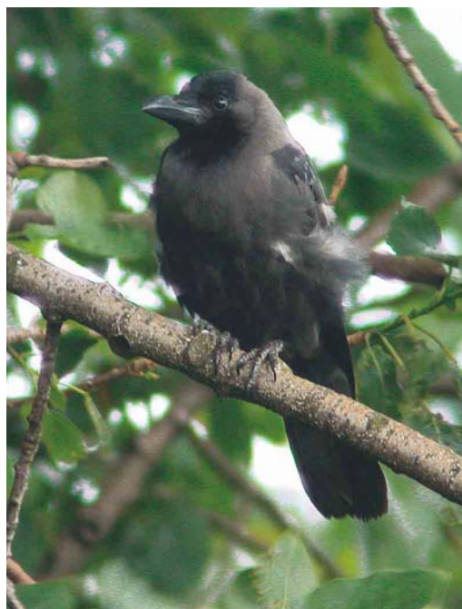
172 House Crows / Huiskraaien Corvus splendens , juvenile (left) and adult, Hoek van Holland, Zuid-Holland, Netherlands, 23 July 1998 (Leo J R Boon/Cursorius) 173 House Crow / Huiskraai Corvus splendens , adult, Hoek van Holland, Zuid-Holland, Netherlands, 28 June 2002 (Leo J R Boon/Cursorius) 174 House Crow / Huiskraai Corvus splendens , adult, Hoek van Holland, Zuid-Holland, Netherlands, 23 February 2002 (Edwin Winkel)