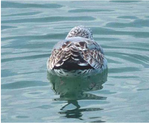
Mystery photograph V (January)