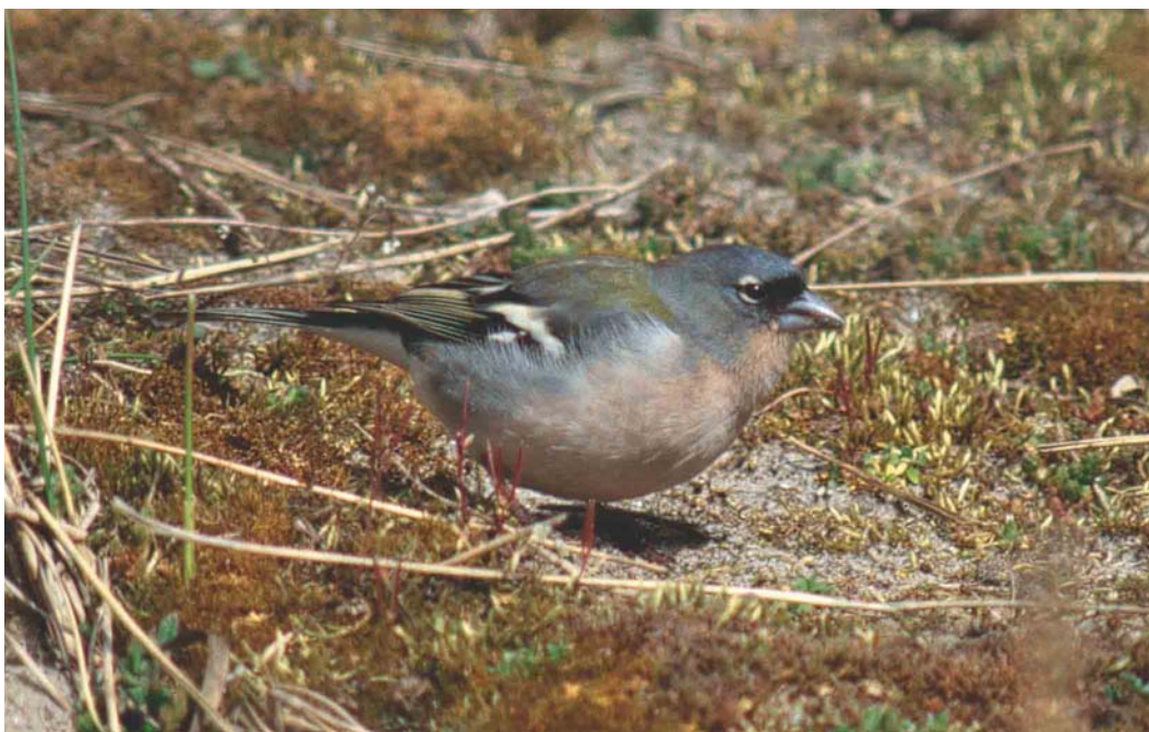
221 Afrikaanse Vink / African Chaffinch Fringilla coelebs africana/spodiogenys , mannetje, Maasvlakte, Zuid-Holland, 5 april 2003 (Harm Niesen)

de Roswaard bij Doornenburg, Gelderland. Tot begin mei werd een ongekend aantal van 13 Roodstuit-zwaluwen Hirundo daurica waargenomen: op 15 april en 4 mei langs Breskens, op 16 april in het Zwanewater, Noord-Holland, op 19 april in de Amsterdamse Waterleidingduinen, Noord-Holland, aan het Drontermeer, Flevoland, en in de Eijsder Beemden, op 20 april wederom kort in de AW-duinen, op 21 april over de Eemshaven en Schiermonnikoog, op 2 en 3 mei één en op 4 en 5 mei zelfs twee in De Geul op Texel, Noord-Holland, op 3 mei over Middelburg, Zeeland, en op de Vlinderbalg, Groningen, en op 4 mei over Bakkeveen, Friesland. Grote Piepers Anthus richardi trokken op 16 april over de Kamperhoek, Flevoland, op 21 april langs Breskens en op 26 april over de Eemshaven. Na een vroege Duinpieper A campestris op 29 maart langs Den Oever, werden er vanaf 11 april c 30 gezien, zowel overtrekkend als kort ter plaatse. Recordaantallen van c 382 000 en c 182 000 Graspieters A pratensis vlogen over de telpost bij Breskens op respectievelijk 15 en 16 april. Een 20-tal Roodkeelpiepers A cervinus werd doorgegeven vanaf 13 april, nagenoeg allemaal overvliegende. In maart waren nog c 250 Pestvogels Bombycilla garrulus op diverse locaties aanwezig met 30 op 4 maart in Nieuwegein, Utrecht, 30 op 7 maart in Borne, Overijssel, maximaal 27 tot 24 maart in Wijk bij Duurstede, Utrecht, en maximaal 42 eind maart in Geulle, Limburg. Behalve een groep van maximaal c 50 die het van 23 maart tot 21 april uit-