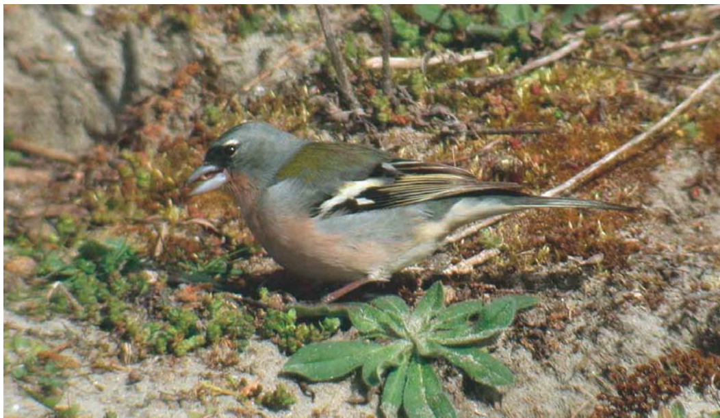
226 Afrikaanse Vink / African Chaffinch Fringilla coelebs africana/spodiogenys , mannetje, Maasvlakte, Zuid-Holland, 5 april 2003

Van 22 april tot 1 mei werden geen Roodstuitzwaluwen gemeld maar rond het eerste weekend van