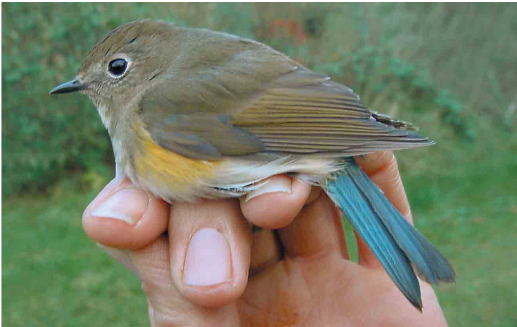
166-167 Blauwstaart / Red-flanked Bluetail Tarsiger cyanurus , eerstejaars, Groene Glop, Schiermonnikoog, Friesland, 5 november 2001 ( Henri Bouwmeester )

Blauwstaarten op Vlieland in oktober 1999 en op Schiermonnikoog in november 2001