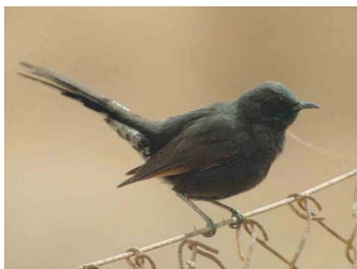
193 Collared Flycatcher / Withalsvliegenvanger Ficedula albicollis , first-summer male, Remolar-Filipines Reserve, Viladecans, Llobregat delta, Barcelona, Spain, 16 April 2003 194 Alpine Swift / Alpengierzwaluw Apus melba , Sizewell, Suffolk, England, 4 May 2003 195 Isabelline Wheatear / Izabeltapuit Oenanthe isabellina , Capo Murro di Porco, Sicily, Italy, 1 April 2003 196 Black Scrub Robin / Zwarte Waaiersstaart Cercotrichas podobe , Yotvata, Israel, April 2003

Greater Spotted Eagle A clanga at Niederriedstausee, Bern, was seen until 15 March (the species has been a winterer here since February 1996). On 6 April, one was noted at Hucel, Haute-Savoie. The fifth Tawny Eagle A rapax for Israel was a second-year over Yotvata on 18 March. An extralimital first-winter Spanish Imperial Eagle A adalberti was seen with a Lammergeier Gypaetus barbatus between Alta Ribagorça and Pallars Jussà, Lleida, Catalonia, on 5 April. A female Amur Falcon Falco amurensis occurred at Shahama, UAE, on 7 April. A male Eleonora's Falcon F eleonorae was watched for a few minutes on Tiree, Argyll, Scotland, on 1 May. A Saker Falcon F cherrug ringed as a nestling in Slovakia on 28 May 2000 appeared to be recovered at Mursuk, Lybia, on 10 October 2000.