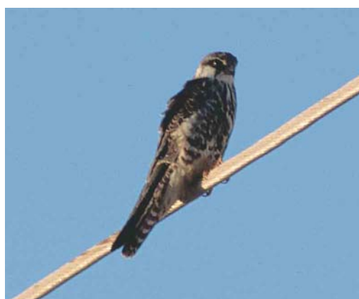
158 Red-footed Falcon / Roodpootvalk Falco vespertinus , first-summer male, Gibraltar Point, Lincolnshire, England, 4 June 1989 ( Graham P Catley ) 159 Red-footed Falcon / Roodpootvalk Falco vespertinus , adult female, Kirkby Moor, Lincolnshire, England, 15 May 1984 ( Graham P Catley ) 160 Amur Falcon / Amoerroodpootvalk Falco amurensis , adult male, Sur area, Oman, November 2001 ( Marc Duquet ) 161 Amur Falcon / Amoerroodpootvalk Falco amurensis , juvenile, Sur area, Oman, November 2001 ( Marc Duquet )

mantle. Similarly, some females moult the underbody-feathers during the partial moult, acquiring some new oddly dark-streaked feathers (these are odd-patterned new feathers similar to the few orange feathers on some second calendar-year males; they will be replaced by typical adult feathers during the first complete moult). The same identification characters as above are valid.