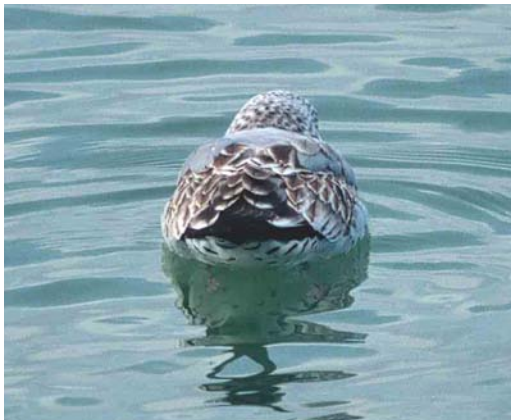
Mystery photograph V (January)