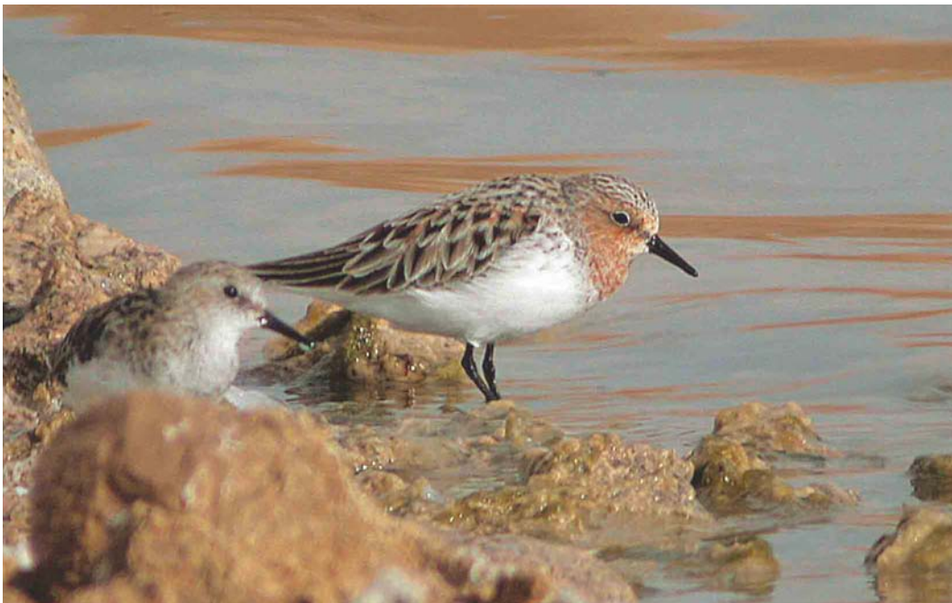
180 Red-necked Stint / Roodkeelstrandloper Calidris ruficollis , adult, Eilat, Israel, 15 April 2003 ( James P Smith )

one of the three largest ever with at least 350 individuals (7% of the Spitsbergen population), including large groups of more than 80 at Camperduin and Wieringen, Noord-Holland. The eighth Black Brant B nigricans for Iceland was at Alftanes on 14 April; two individuals were present here from 25 April onwards. In Malta, a total of 400 Ferruginous Ducks Aythya nyroca passed through the Comino Channel between 8 and 18 March. An adult male Ring-necked Duck A collaris south of Balaton lake on 20 April was (only) the first for Hungary. A female Lesser Scaup A affinis was at Bishop Middleham, Durham, England, from 5 April. Another female remained on South Uist, Outer Hebrides, Scotland, until 20 March. Quite a few males were found, for instance, three in Scotland, one remaining at Studland, Dorset, England, a confiding second-year male at Regent's Park, London, England, from 3 March to at least 7 April, at Lough Swilly, Donegal, Ireland, on 9 March, on Tenerife, Canary Islands, until 29 March, at Lagoa dos Salgados, Algarve, Portugal, from 29 March and in South Yorkshire on 7-9 April. The fourth for Denmark was a male at Tvorup Hul, Nordjylland, on 18-20 April. The first for Hungary was an adult male in the Hortobágy on 20 April. The first Black Scoter Melanitta americana for Denmark was a male at Blåvands Huk, Ringkøbing, Jylland, on 26-30 March