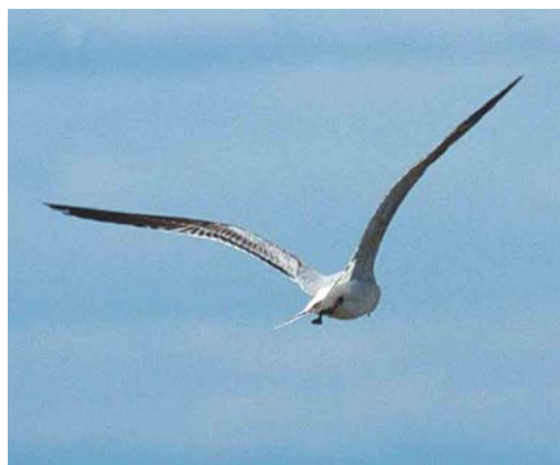
Mystery photograph VI (May)

breast and belly, while Cretzschmar's shows less contrast. In the mystery bird, a difference in colour can be seen between the submoustachial stripe and throat and the darker breast and belly. In Ortolan, the markings on the breast appear, unlike in Cretzschmar's, more as dots than as streaks. The crown-streaks tend to be more prominent in Ortolan than in Cretzschmar's. These crown-streaks border a patch of plain feathers creating a lateral crown stripe, which tends to be narrow in Ortolan. In Cretzschmar's, this lateral crown stripe is broader in front of the eye than in Ortolan and almost meeting above the bill. The mystery bird seems to have dot-shaped markings on its breast, obvious crown-streaks, reaching rather far downwards, creating a narrow supercilium. Furthermore, there is a range of even more variable subtleties in plumage differences. For instance, the dark malar stripe and markings on upper- and underparts tend to be more black-ish and stronger in Ortolan than in Cretzschmar's.