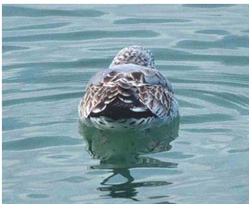
Mystery photograph V (January)