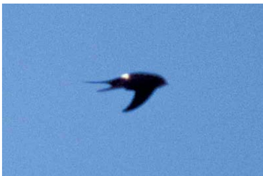
76 White-rumped Swift / Kaffergerjzwaluw Apus caffer , eastern Algarve, Portugal, 7 July 2000