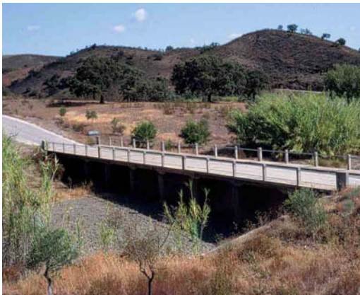
74 Breeding site of White-rumped Swift / Kaffergerzwaluw Apus caffer , eastern Algarve, Portugal, 25 July 1999 (Ray Tipper)