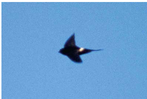
77 White-rumped Swift / Kaffergerjzwaluw Apus caffer , eastern Algarve, Portugal, 14 July 1999 (Ray Tipper)

remaining inside and lining the entrance with feathers to hinder entry (del Hoyo et al 1999, Chantler & Driessens 2000). Mark Bolton and others visited the site on 21 August and caught sight of a well-grown chick and heard vocalizations from inside the nest whenever an adult approached and briefly visited the nest. KS and KP again visited the site on 7 September and found that the body of the nest had been punctured from below in two places but the entrance was not damaged. A nearby Red-rumped Swallow's nest had suffered similar damage. The presence of two fresh sardine cans, a wine bottle and a cut stem of Giant Reed Arundo donax that had not been there on 16 July strongly suggested vandalism.