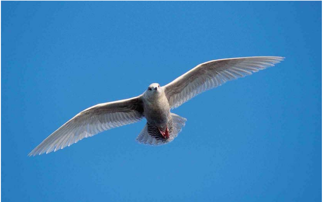
103 Kleine Burgemeester / Iceland Gull Larus glaucooides , eerste-winter, Scheveningen, Zuid-Holland, 17 februari 2002