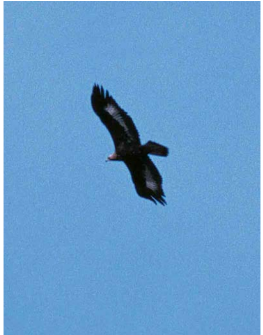
109 Steenarend / Golden Eagle Aquila chrysaetos , eerstejaars, Norg, Drenthe, 11 februari 2002

Steenarend in Midden-Drenthe Op maandag 4 februari 2002 berichtte Richard Ubels mij dat hij een dag eerder tijdens een fietstocht een grote roofvogel had waargenomen ten zuidoosten van Norg, Drenthe. Vanwege de grootte in vergelijking met Buizerd Buteo buteo en de witte vleugelvlekken dacht hij een onvolwassen Steenarend Aquila chrysaetos gezien te hebben. Vanwege de grote zeldzaamheid en het feit dat hij